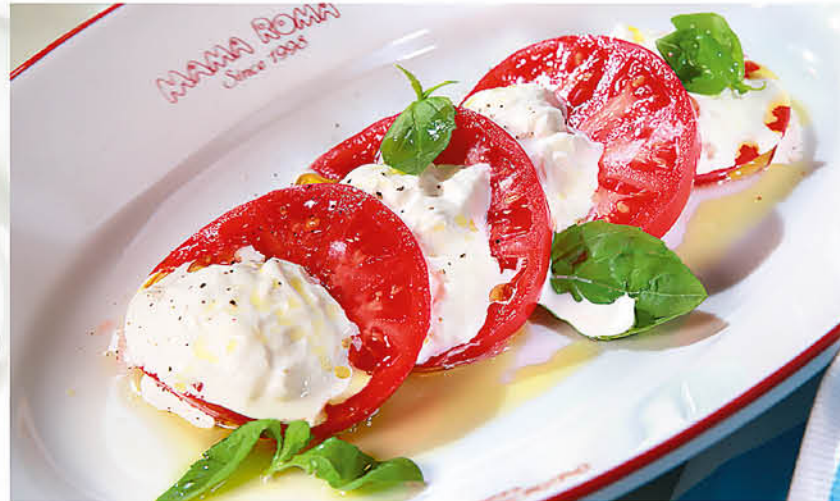
КАПРЕЗЕ нежная страчателла с баккинскими помидорами, оливковым маслом Extra Virgin и базиликом 450 р