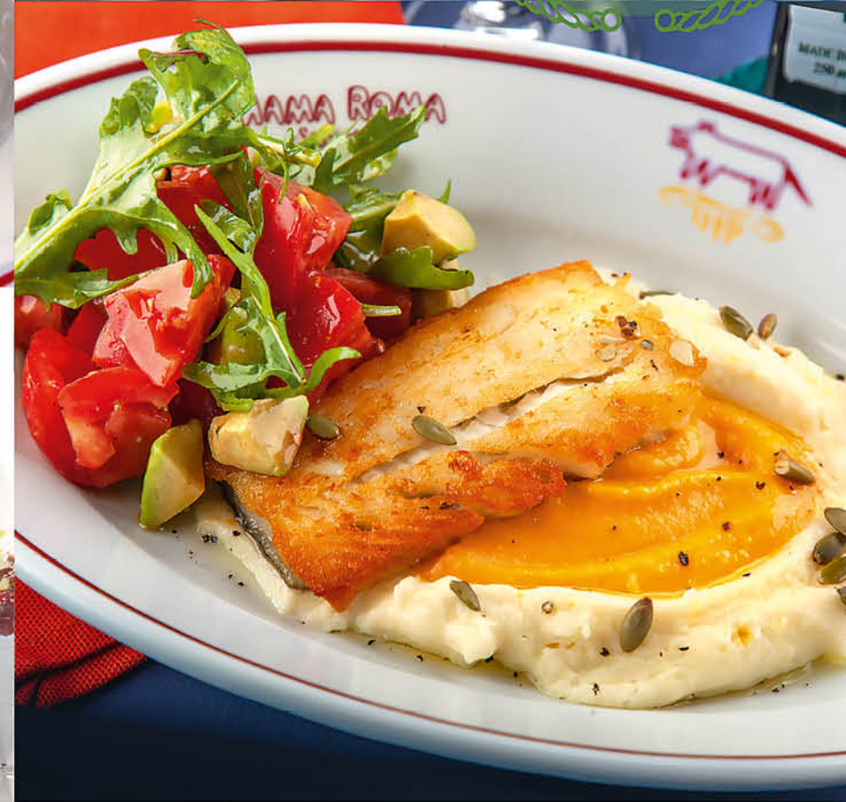
НЕЖНАЯ ТРЕСКА С ПЮРЕ И ТЫКВЕННЫМ СОУСОМ с салатом из черри, авокадо и рукколой в медово-горчичном соусе 695 р