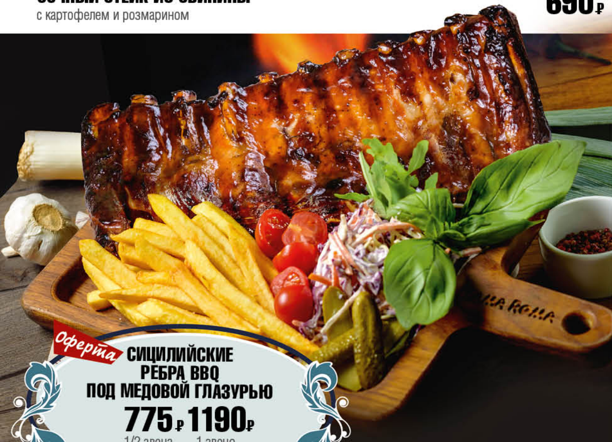
Оферта СИЦИЛИЙСКИЕ РЕБРА BBQ ПОД МЕДОВОЙ ГЛАЗУРЬЮ 775₺ 1190₺ 1/2 звена, 250 гр. 1 звено, 500 гр.