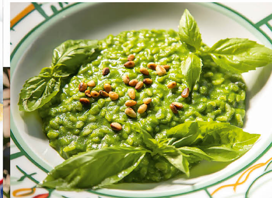
РИЗОТТО С ПЕСТО и кедровыми орешками