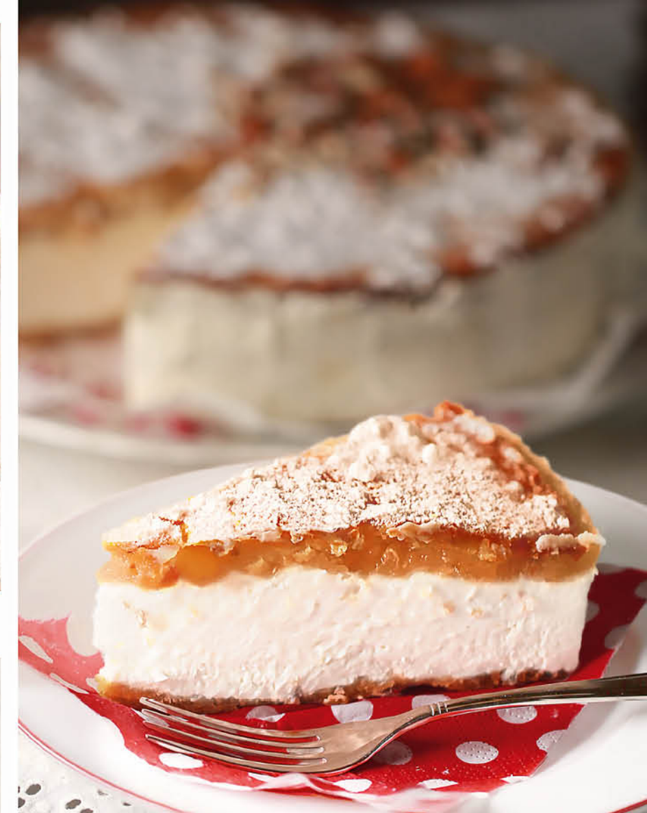
РИКОТТА С ГРУШЕЙ