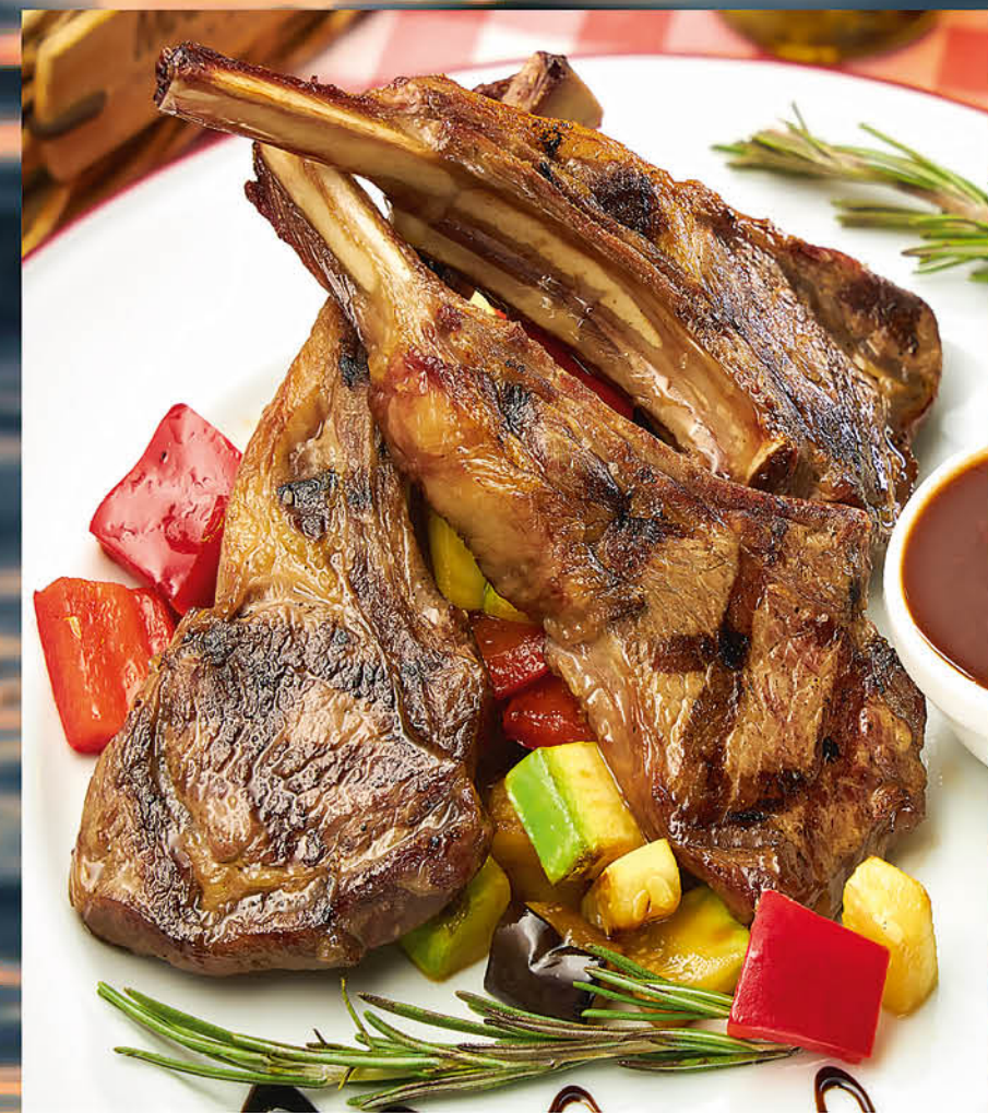
КАРЕ ЯГНЕНКА НА ГРИЛЕ с соусом Mama Roma и перцем розе