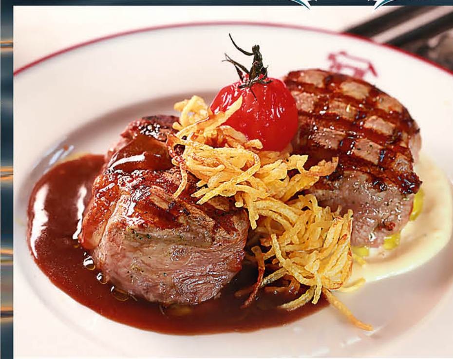
SOLE E LUNA

медальоны из свиной вырезки на гриле с хрустящим картофелем и двумя соусами