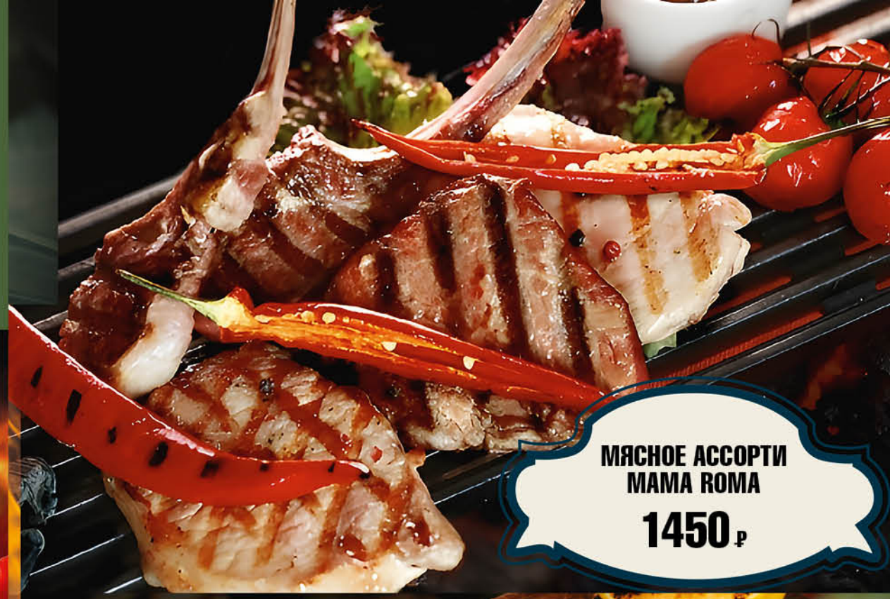
МЯСНОЕ АССОРТИ МАМА РОМА 1450₺