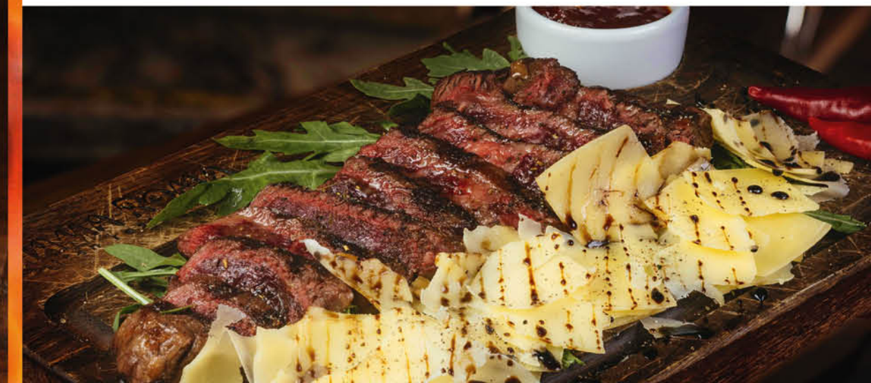
СТЕЙК ТАЛЬЯТА С ПАРМЕЗАНОМ И ЗЕЛЕНЬЮ