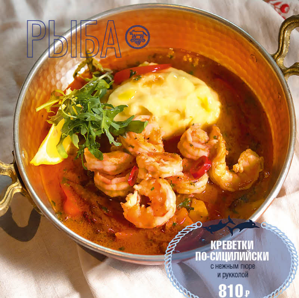
КРЕВЕТКИ ПО-СИЦИЛИЙСКИ с нежным пюре и рукколой 810 р