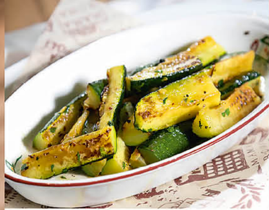
ЦУКИНИ АЛЬ ФОРНО