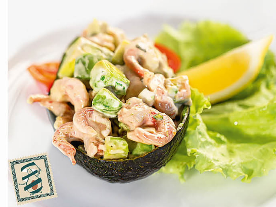
АВОКАДО С КРЕВЕТКАМИ 590 р