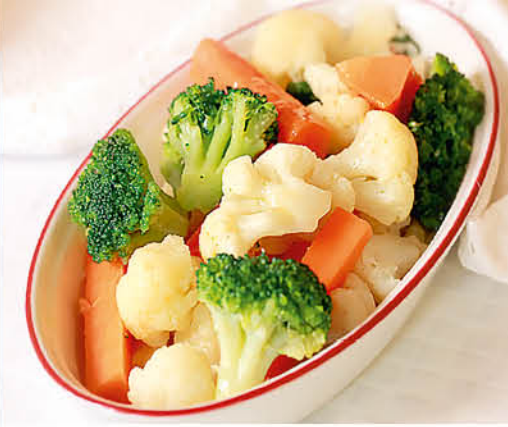
ОВОЩИ НА ПАРУ