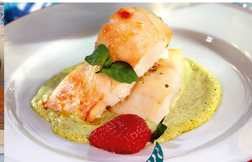
СУДАК ПОРТОФИНО с соусом Песто 795 р