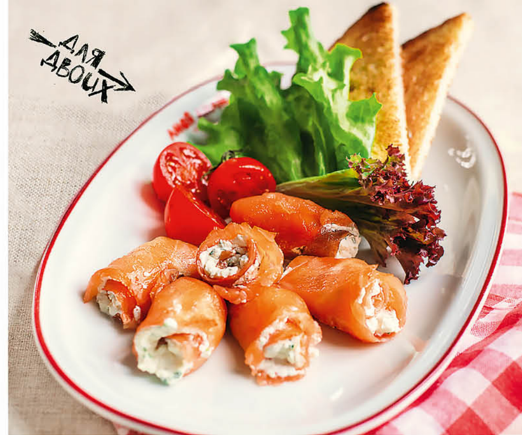
РУЛЕТКИ ИЗ КОПЧЕНОГО ЛОСОСЯ с рикоттой 780 р