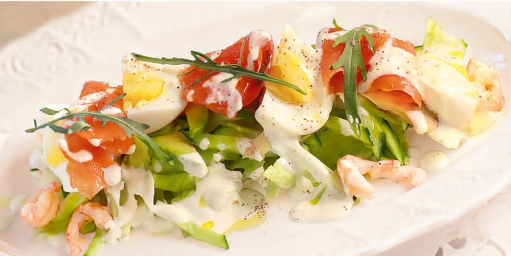
СИЦИЛИАНА FRESCA С ЛОСОСЕМ И КРЕВЕТКАМИ 595 р