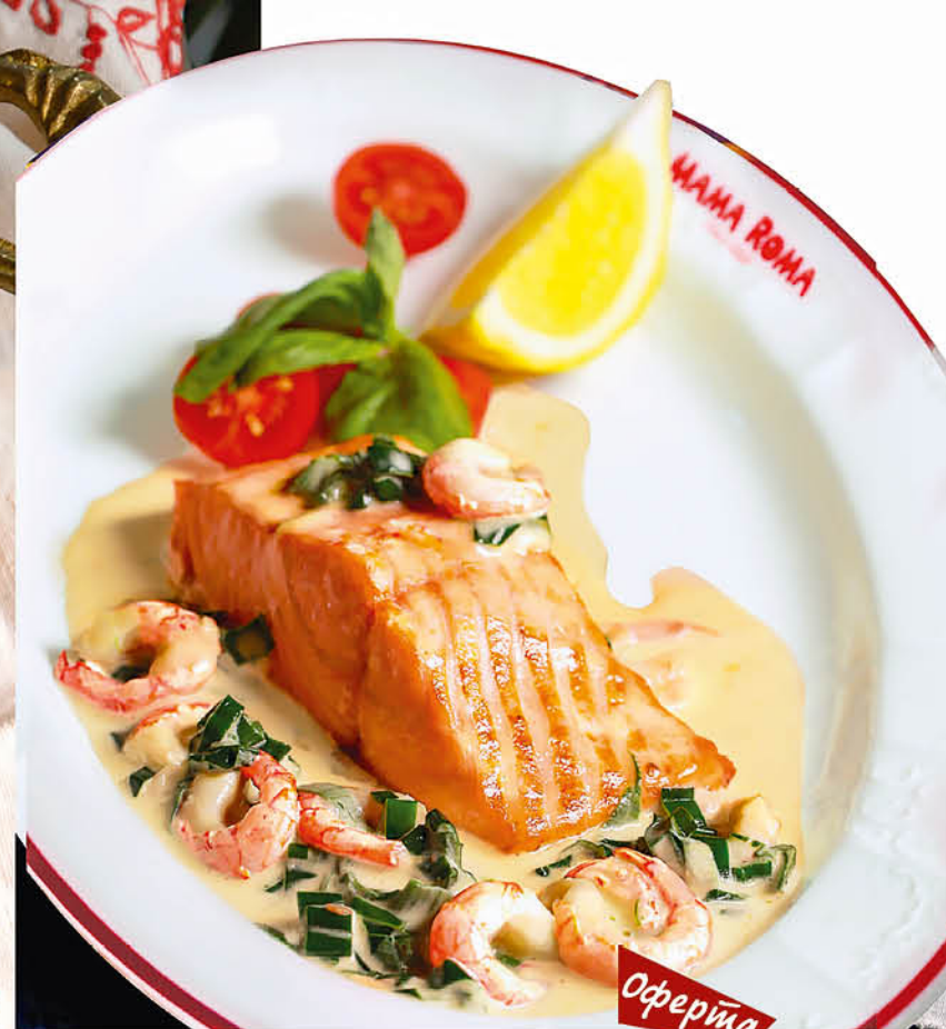
ФИЛЕ ЛОСОЯ С КРЕВЕТКАМИ в сливочном соусе 1190 р