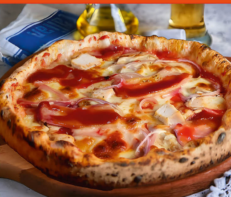
ПИЦЦА BBQ куриное филе, бекон, моцарелла, лук, соус BBQ 590 р