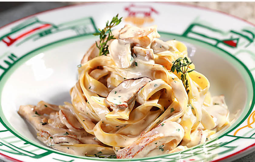
ТАЛЬЯТЕЛЛЕ С БЕЛЫМИ ГРИБАМИ в сливочном соусе