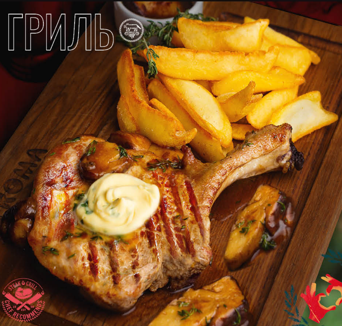
СОЧНЫЙ СТЕЙК ИЗ СВИНИНЫ с картофелем и розмарином