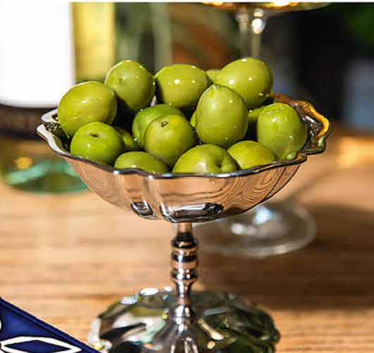
СИЦИЛИЙСКИЕ ОЛИВКИ 395 р