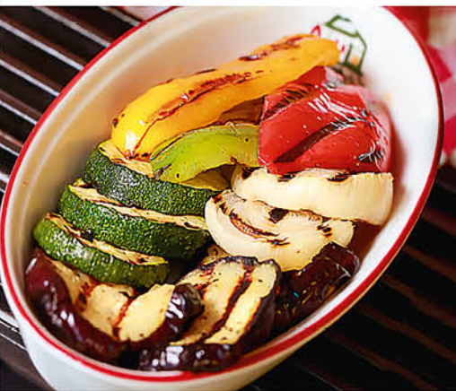
ОВОЩИ НА ГРИЛЕ