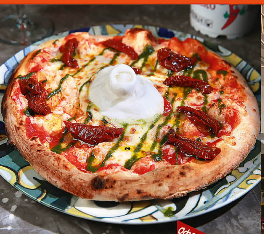
ПИЦЦА ГУРМЕ С НЕЖНОЙ БУРРАТОЙ и соусом Наполи Оферта 850 р