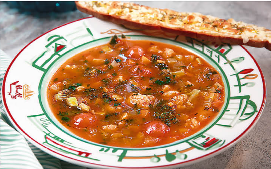
МИНЕСТРОНЕ 350₹ овощной пряный суп с соусом Наполи