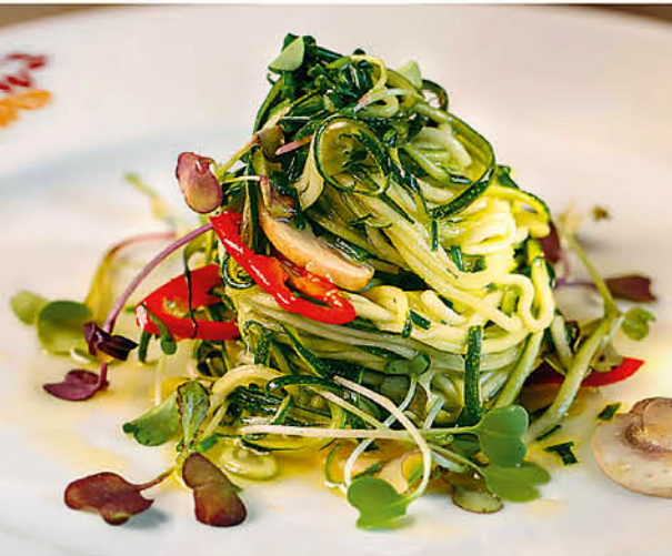
САЛАТ ИЗ ЦУКИНИ цукини, шампиньоны, оливковое масло, перец чили 295 р