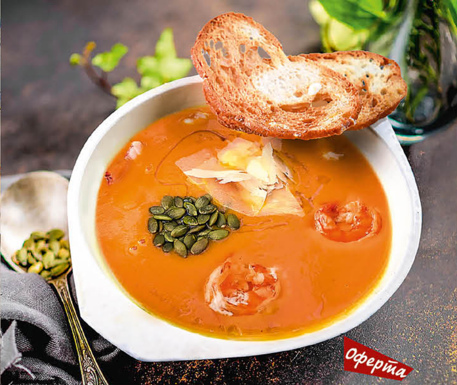
ТЫКВЕННЫЙ КРЕМ-СУП 330₹ с пармезаном 430₹ с тигровыми креветками