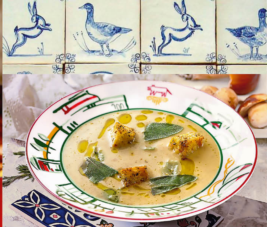
КРЕМ-СУП С БЕЛЫМИ ГРИБАМИ 445₹ грибной крем-суп с хрустящими сухариками