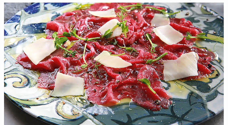
CARPACCIO карпаччо из говядины с пармезаном 890 р