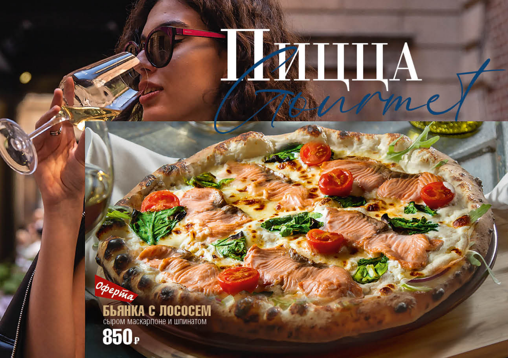
Оферта БЪЯНКА С ЛОСОСЕМ сыром маскарпоне и шпинатом 850 р