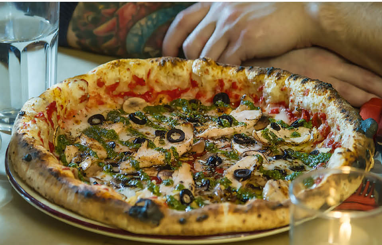
ПОЛЛО ПЕСТО куриное филе, соус Песто, грибы, черные оливки, томаты, сыр моцарелла