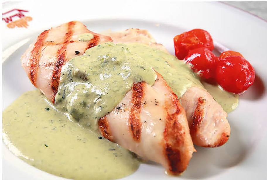
КУРИНОЕ ФИЛЕ НА ГРИЛЕ