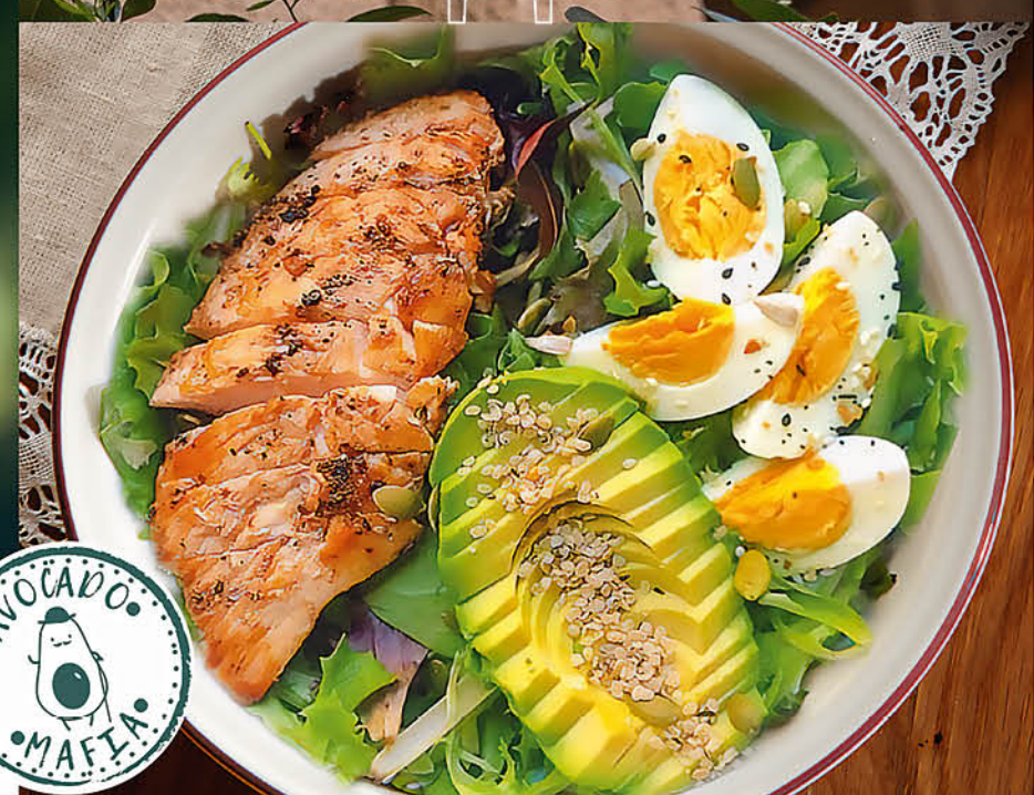
ЗЕЛЁНЫЙ САЛАТ С КУРИЦЕЙ, АВОКАДО И КИНОА курица на гриле, микс салатов, авокадо, яйца, киноа и заправка из масла авокадо 495 р