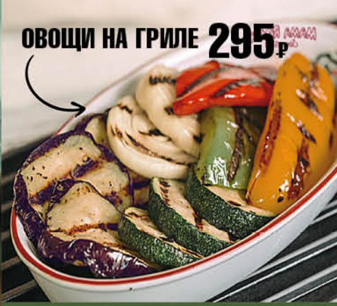
ОВОЩИ НА ГРИЛЕ 295₺