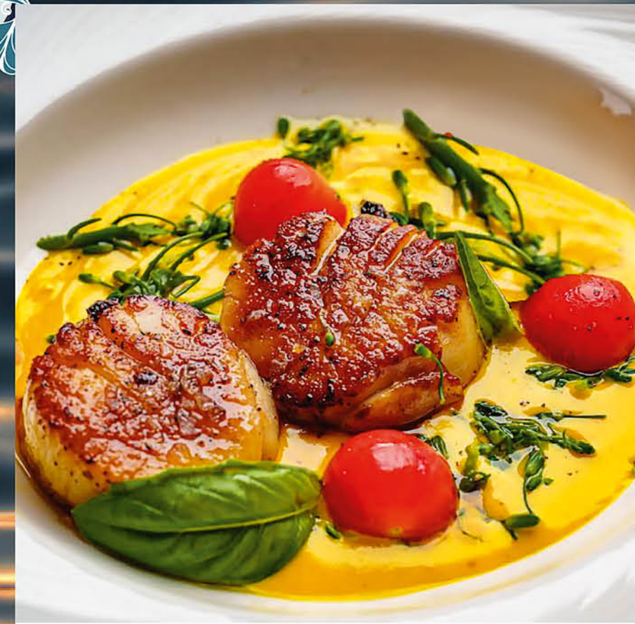
БИСТЕККИ ИЗ ИНДЕЙКИ с пюре с шафраном, базиликом и черри