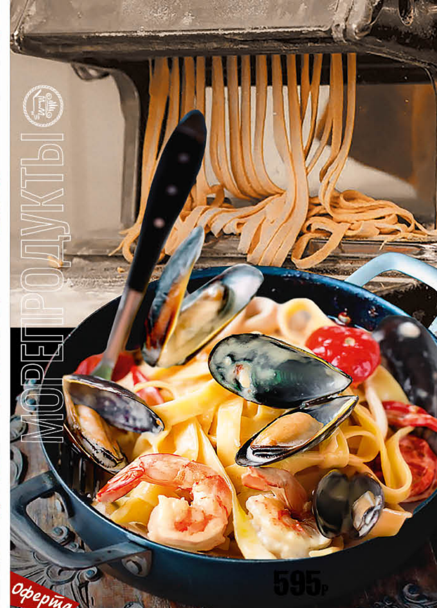
ТАЛЬЯТЕЛЛЕ ФРУТТИ ДИ МАРЕ в сливочном соусе с морепродуктами