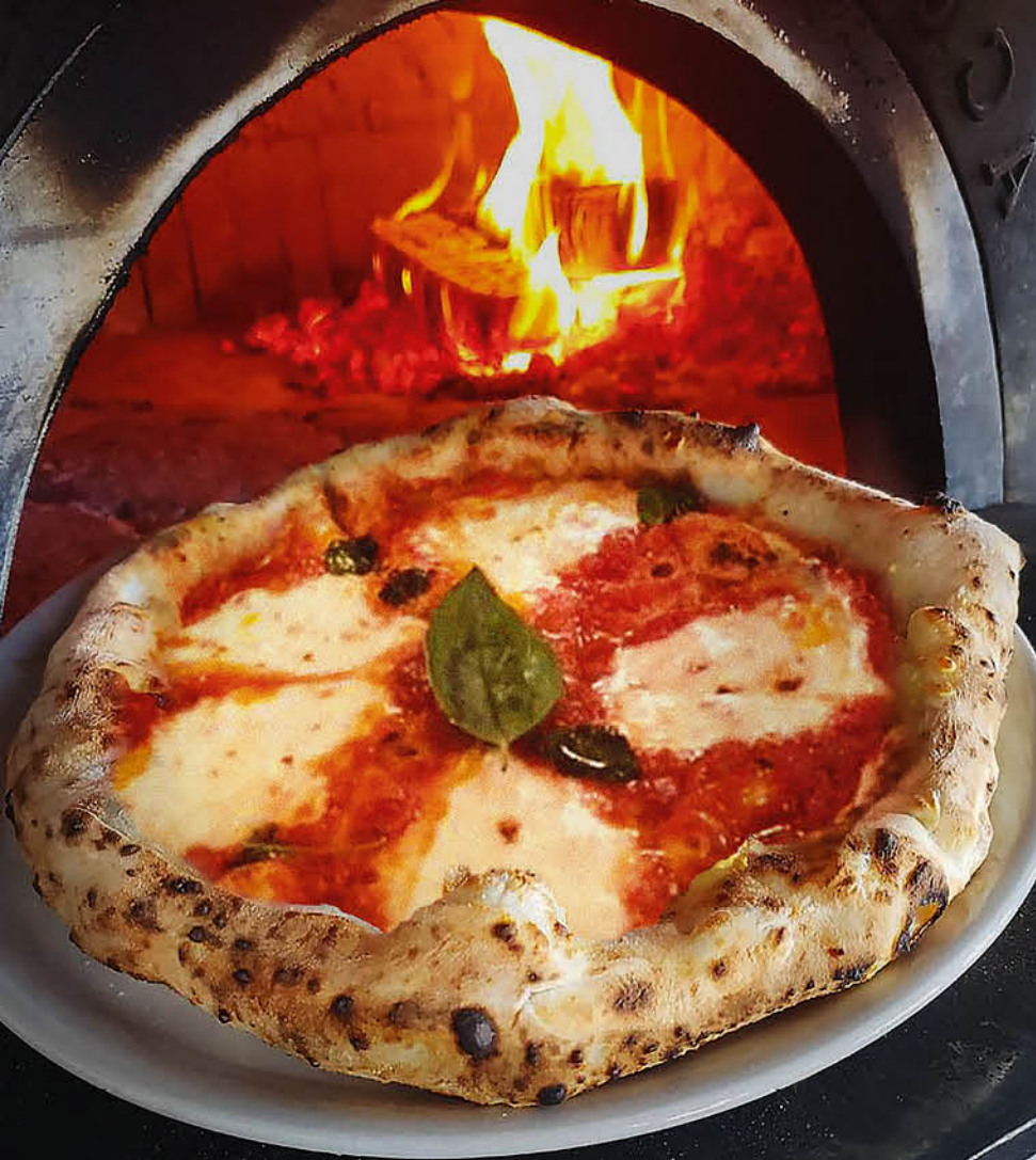
МАРГАРИТА томаты, сыр моцарелла 450₽