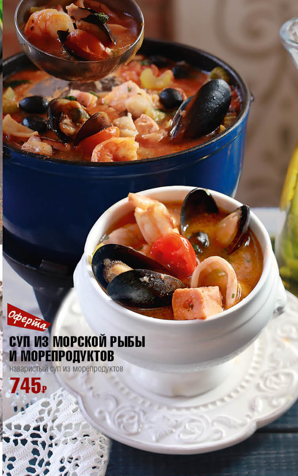
СУП ИЗ МОРСКОЙ РЫБЫ И МОРЕПРОДУКТОВ 745₹ наваристый суп из морепродуктов