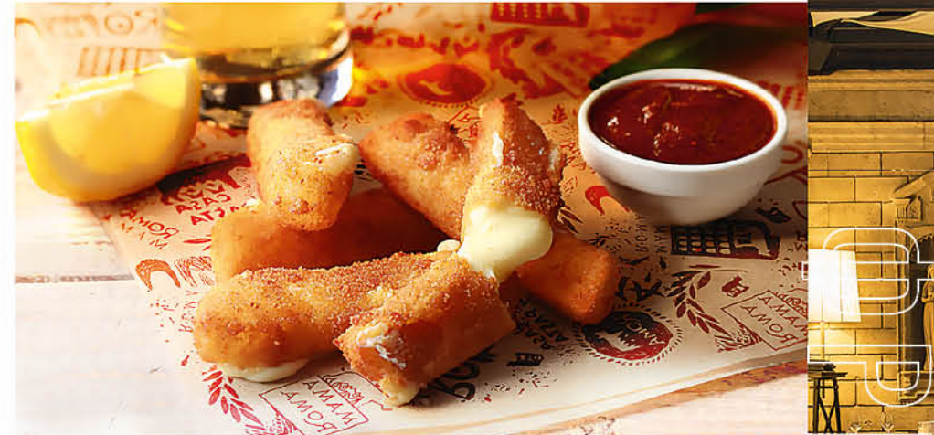
НЕЖНАЯ МОЦАРЕЛЛА В ХРУСТЯЩЕЙ КОРОЧКЕ с соусом Mama Roma 450 р