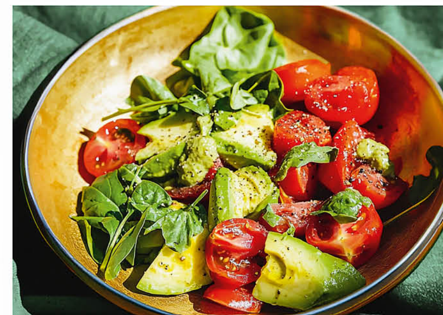
САЛАТ ИЗ АВОКАДО авокадо, бакинские томаты с зеленью в горчично-медовом соусе 590 р