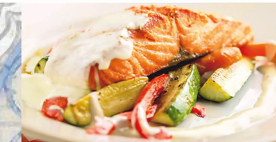
ЛОСОСЬ ЛАГО ДИ ГАРДА запеченное филе с овощами и сливочным соусом 995 р