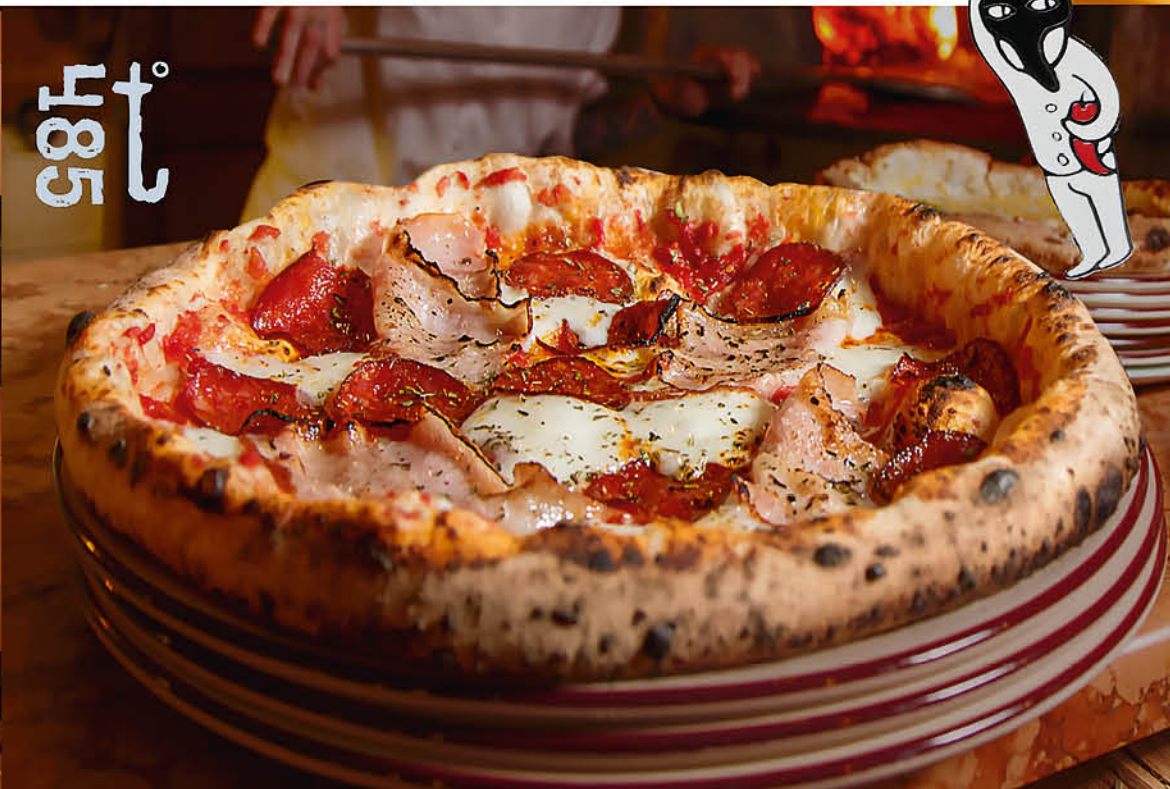
ПУЛЬЧИНЕЛЛА домашний бекон, саями, моцарелла