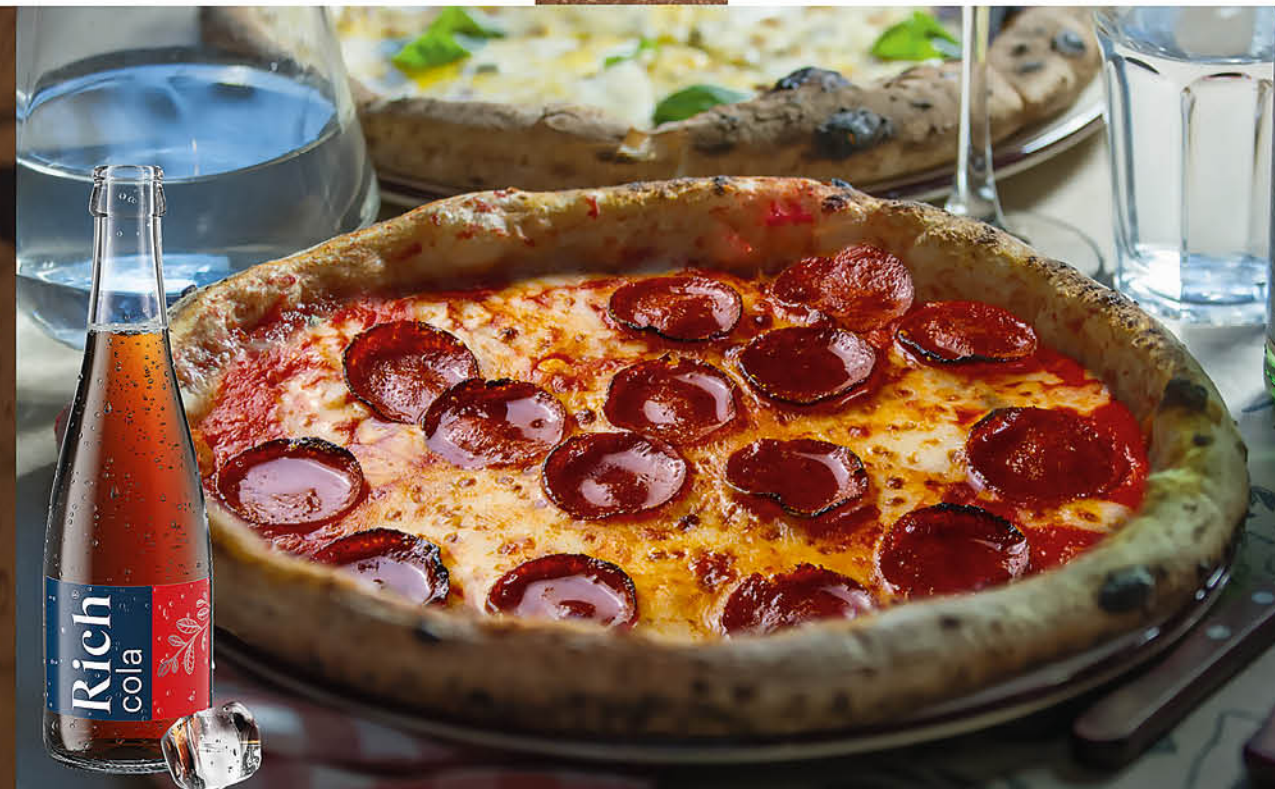
ПЕППЕРОНИ саями, томаты, сыр моцарелла