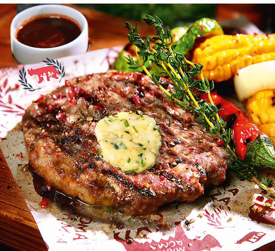
БИСТЕККА ИЗ МРАМОРНОЙ ГОВЯДИНЫ с овощами гриль