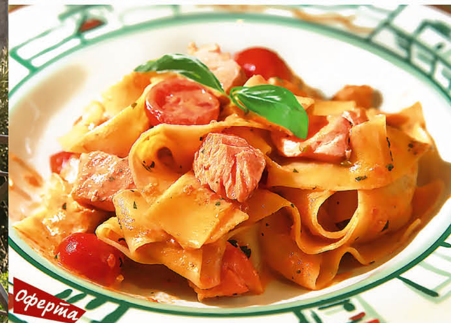
ПАППАРДЕЛЛЕ С ЛОСОСЕМ с базиликом, итальянскими травами, помидорами черри в сливочном соусе