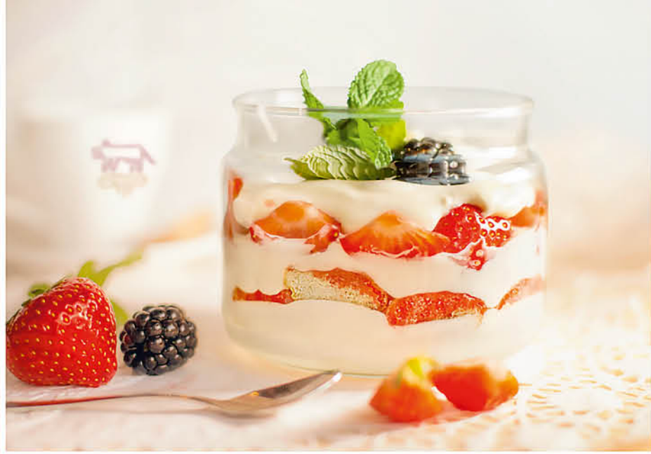
КЛУБНИЧНОЕ ТИРАМИСУ с нежным маскарпоне