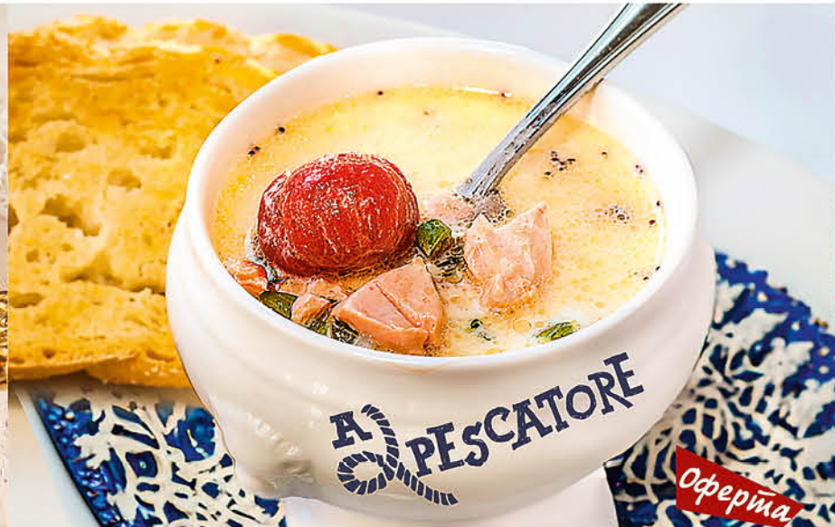
ZUPPA DI SALMONE 495₹ сливочный суп с лососем, нежной треской, помидорами черри, картофелем и пряными травами