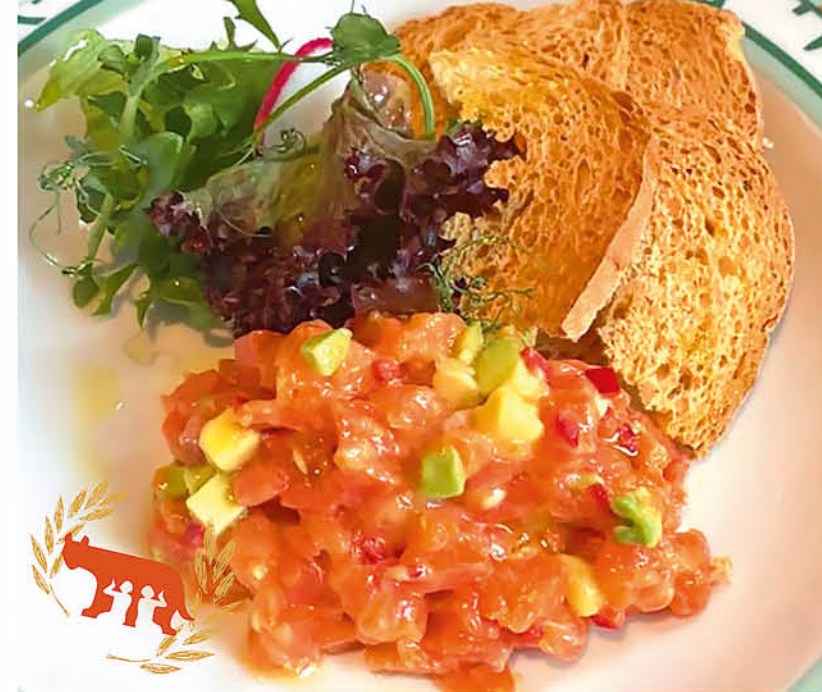
ТАРТАР ИЗ ЛОСОСЯ с авокадо, кростини, в медово-горчичном соусе 595 р