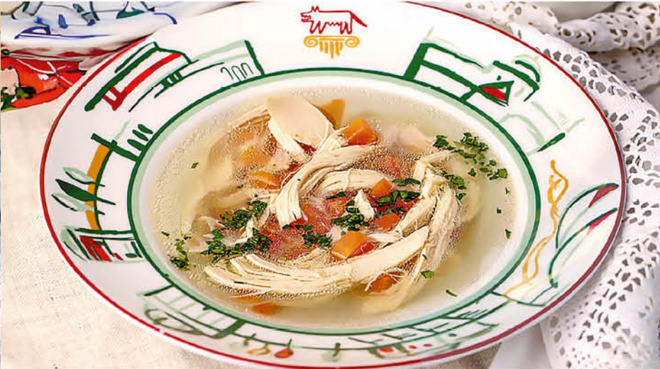
КУРИНЫЙ СУП 290₹ классический куриный суп