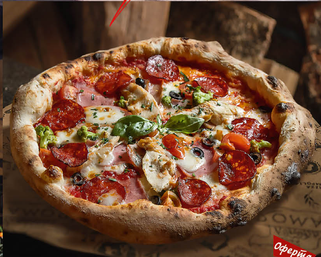
МАМА РОМА домашний бекон, салями, куриное филе, брокколи, маслины и помидоры черри 695₽ Оферта