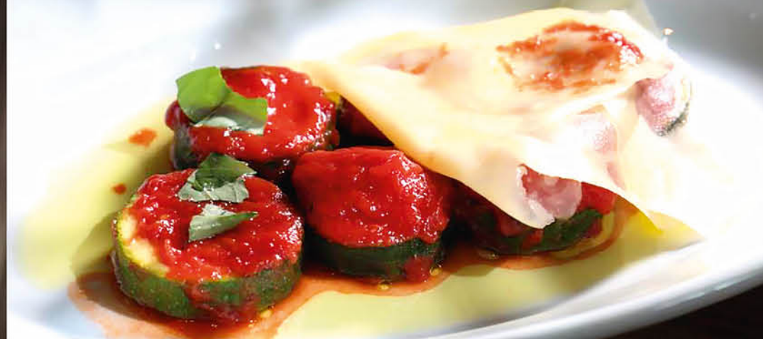
ЦУКИНИ С СОУСОМ НАПОЛИ И ПАРМЕЗАНОМ