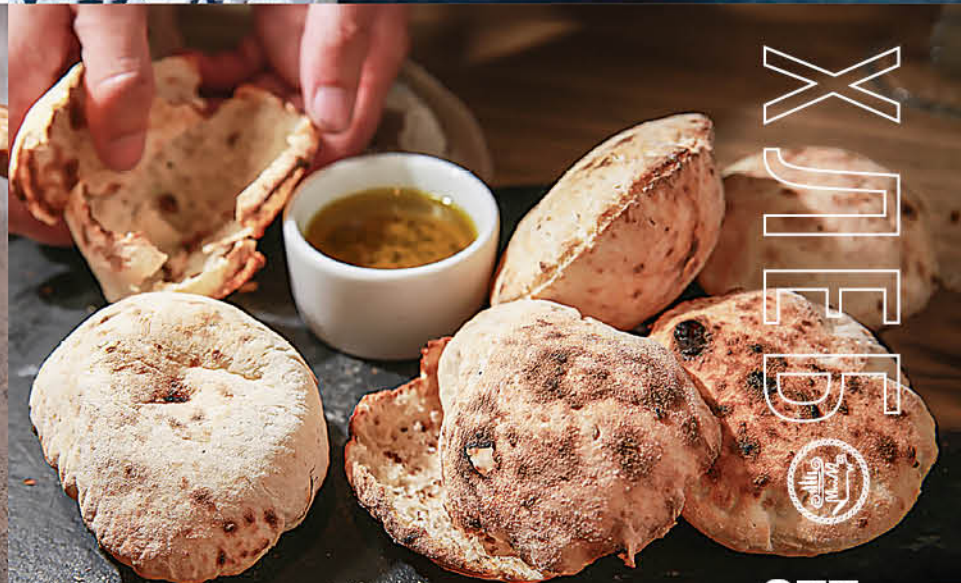
ИТАЛЬЯНСКАЯ ПИТА 255₹ с ароматным маслом 290₹ с соусом Нутт