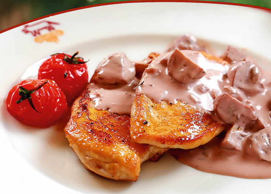
КУРИНОЕ ФИЛЕ С ГРИБАМИ, СЛИВКАМИ И ПОРТВЕЙНОМ