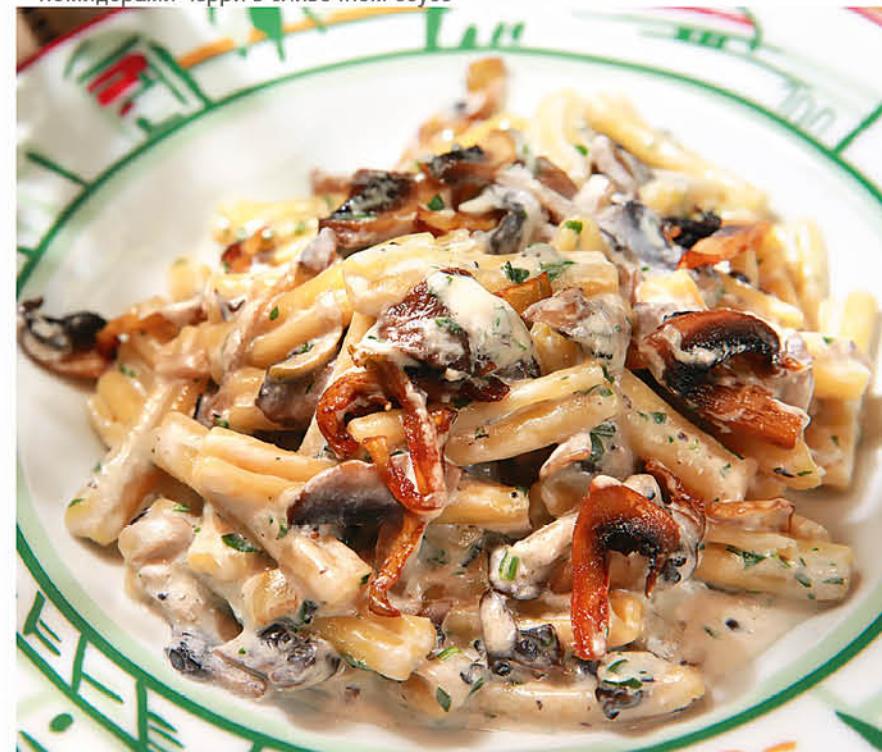
КАЗАРЕЧЧЕ с баклажанами и грибами