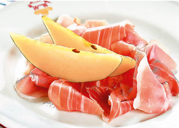
ПАРМСКАЯ ВЕТЧИНА с ломтиками сочной груши 470 р