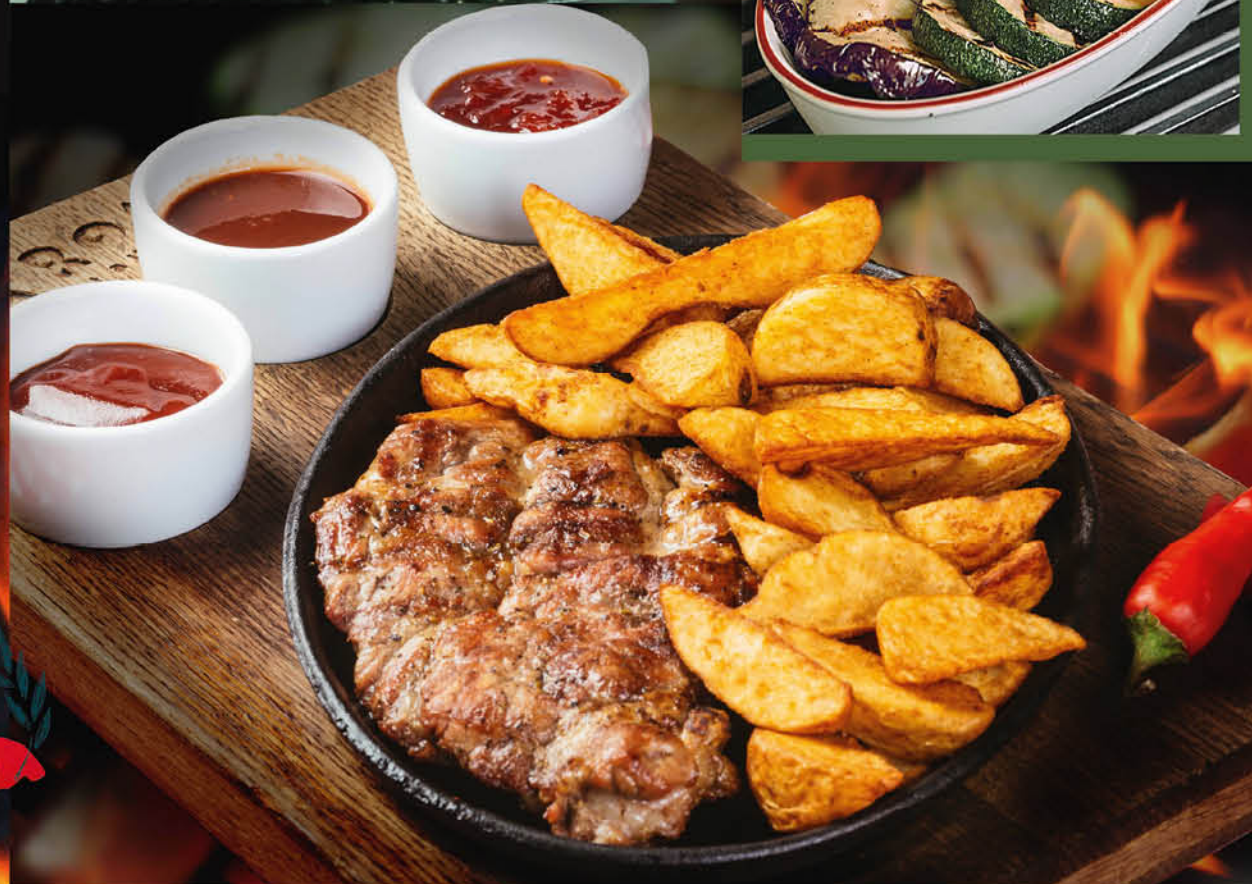
СТЕЙК ИЗ СВИНОЙ ШЕЙКИ С ЗАПЕЧЕННЫМ КАРТОФЕЛЕМ