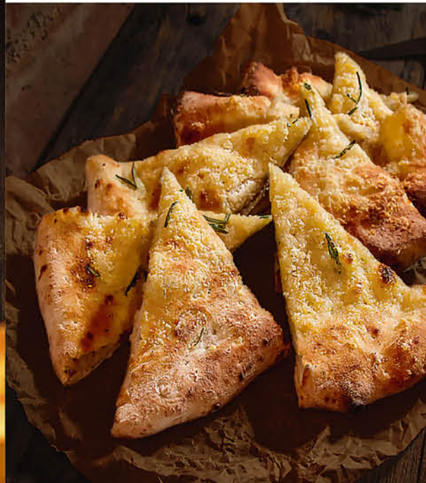
ФОКАЧЧА С РОЗМАРИНОМ 250₽ половина 160₽