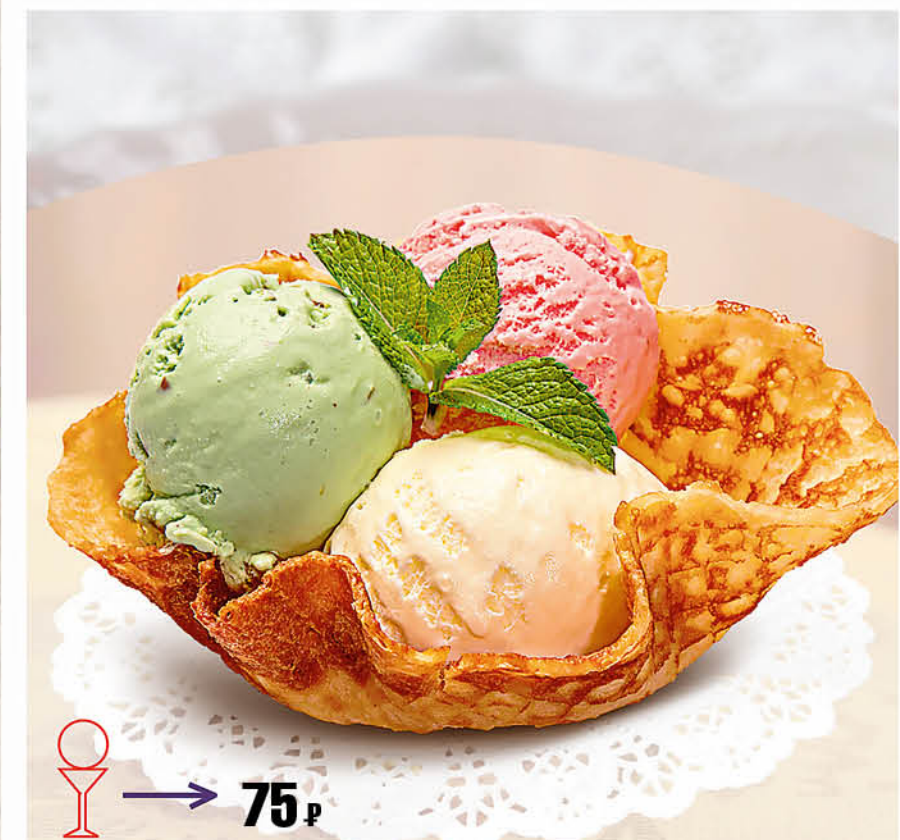
МОРОЖЕНОЕ «ТРЕ АМИЧИ»