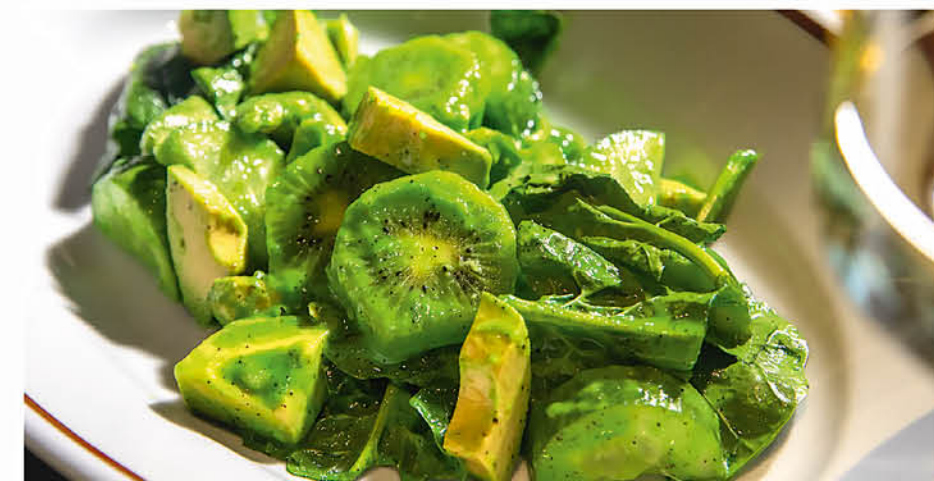
САЛАТ С АВОКАДО И КИВИ шпинат, зеленый горошек, огурец, сельдерей с соусом из тархуна 495 р