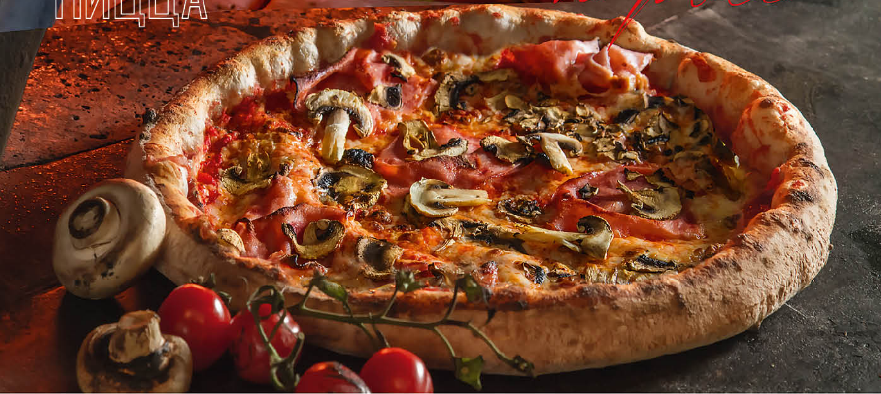
ПРОШУТТО ФУНГИ ветчина, грибы, томаты, сыр моцарелла