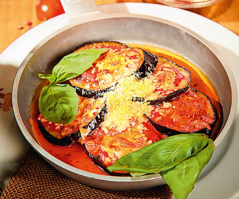
ЗАПЕЧЁННЫЕ БАКЛАЖАНЫ с пармезаном, томатами и базиликом