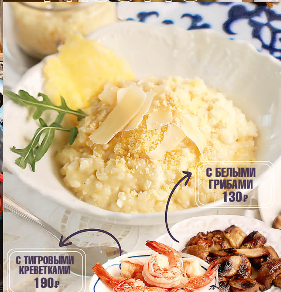
РИЗОТТО С ПАРМЕЗАНОМ