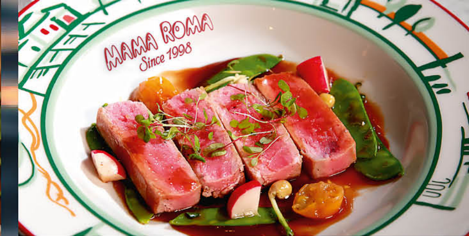
ФИЛЕ ТУНЦА С АПЕЛЬСИНОМ И МЕДОВОЙ ГОРЧИЦЕЙ 890 р