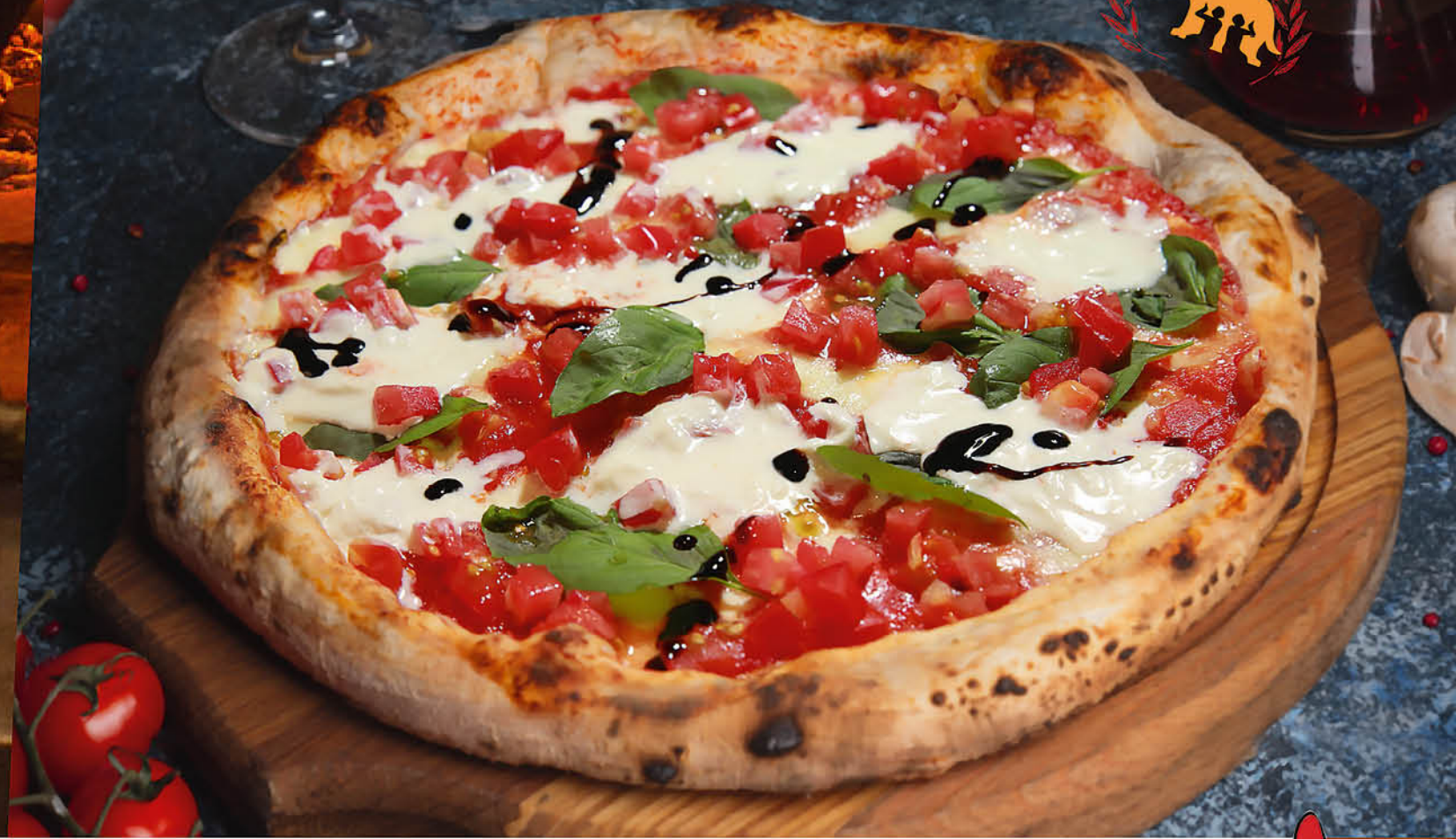
ПИЦЦА С НЕЖНОЙ СТРАЧАТЕЛЛОЙ И ТОМАТАМИ базиликом и бальзамическим соусом Modena