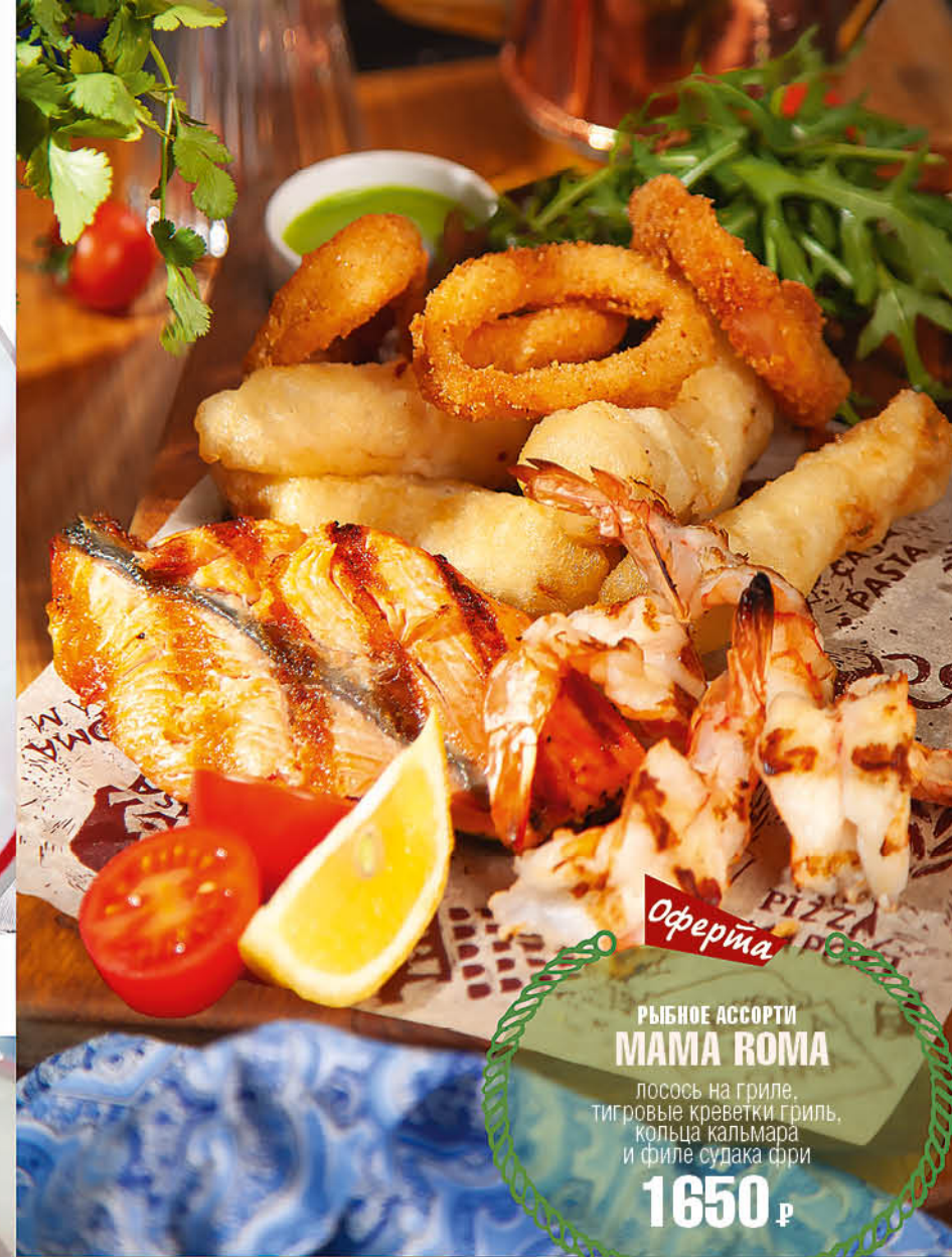
РЫБНОЕ АССОРТИ МАМА РОМА лосось на гриле, тигровые креветки гриль, кольца кальмара и филе судака фри 1650 р