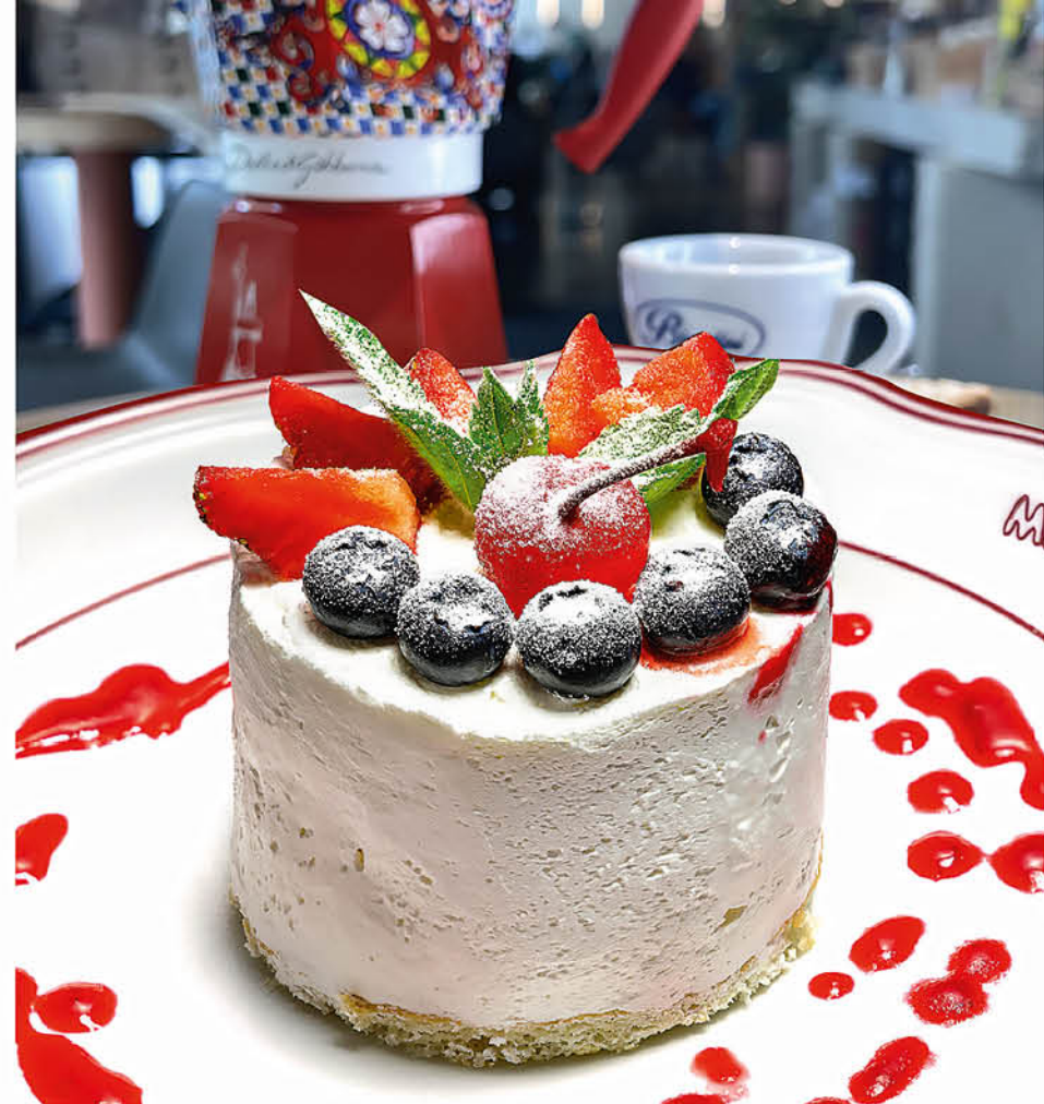
ЧИЗКЕЙК ЛЕСНЫЕ ЯГОДЫ