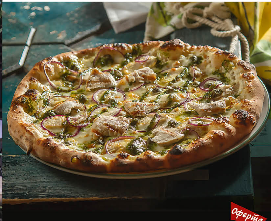
ЦЕЗАРЬ курица, соус Песто, соус Цезарь, каперсы, лук красный 690₽ Оферта