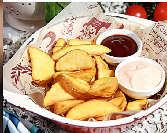
RATATE DI CASA картофель по-деревенски с двумя соусами