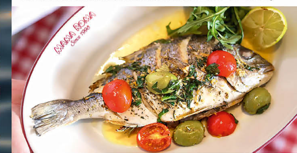
ДОРАДО С РУККОЛОЙ 1290 р