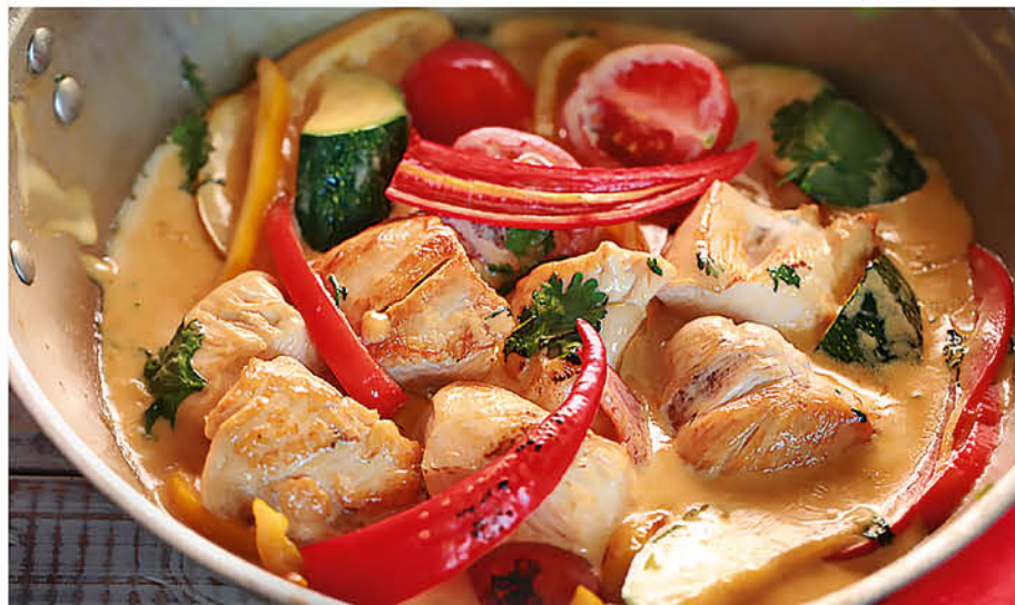
ПОЛЛО АЛЬ ФОРНО куриное филе в сливочном соусе с цукини, сладким перцем и кинзой