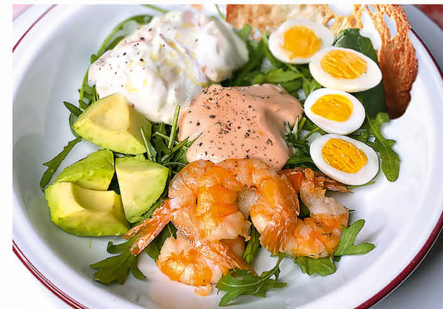
САЛАТ С КРЕВЕТКАМИ, АВОКАДО И СТРАЧАТЕЛЛОЙ нежной страчателлой, рукколой, перепелиными яйцами и соусом Капри 595 р