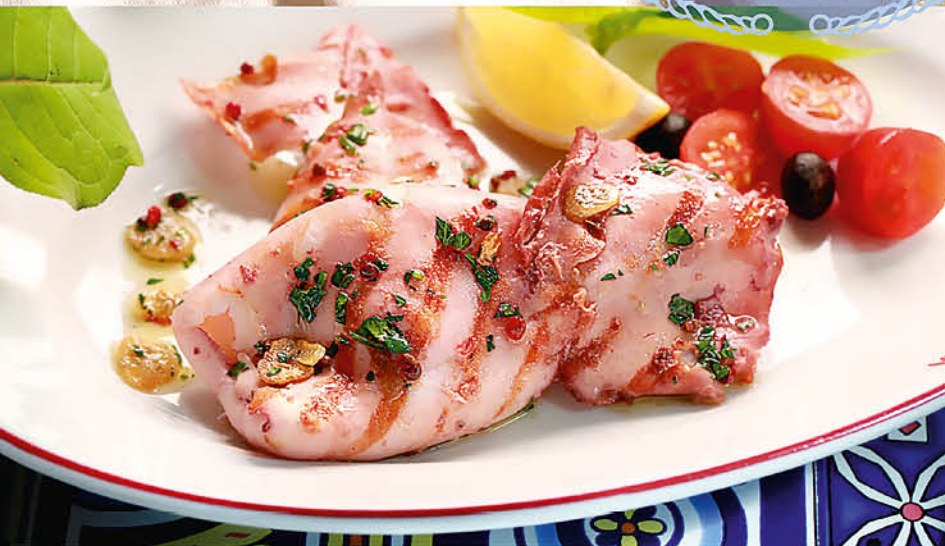
КАЛЬМАРЫ НА ГРИЛЕ в ароматном масле 495 р