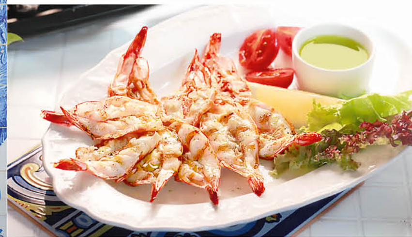
ТИГРОВЫЕ КРЕВЕТКИ 795 р