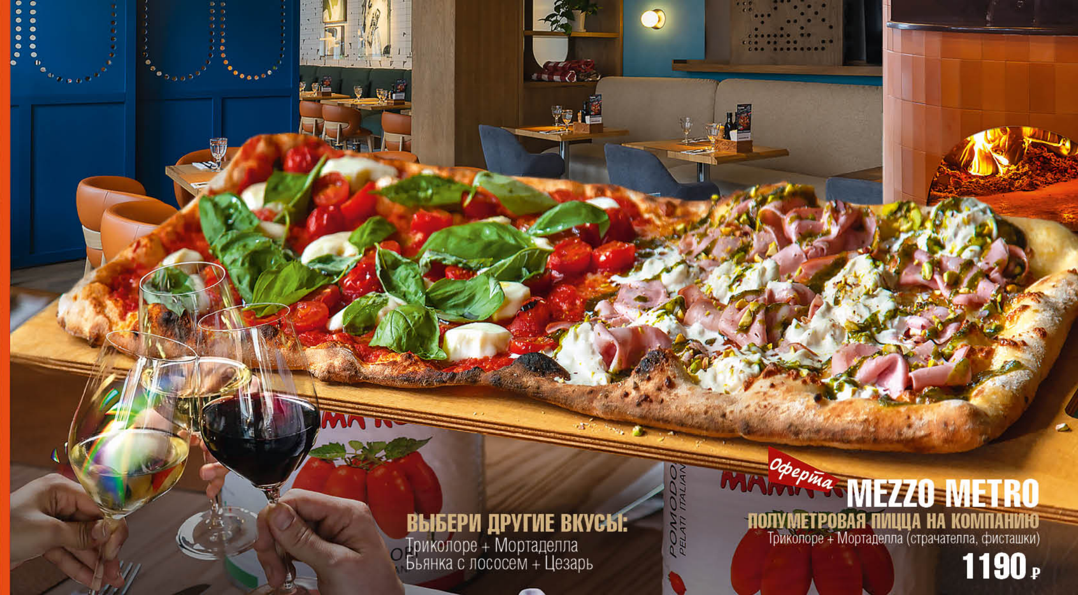
ВЫБЕРИ ДРУГИЕ ВКУСЫ: Триколоре + Мортаделла Бьянка с лососем + Цезарь