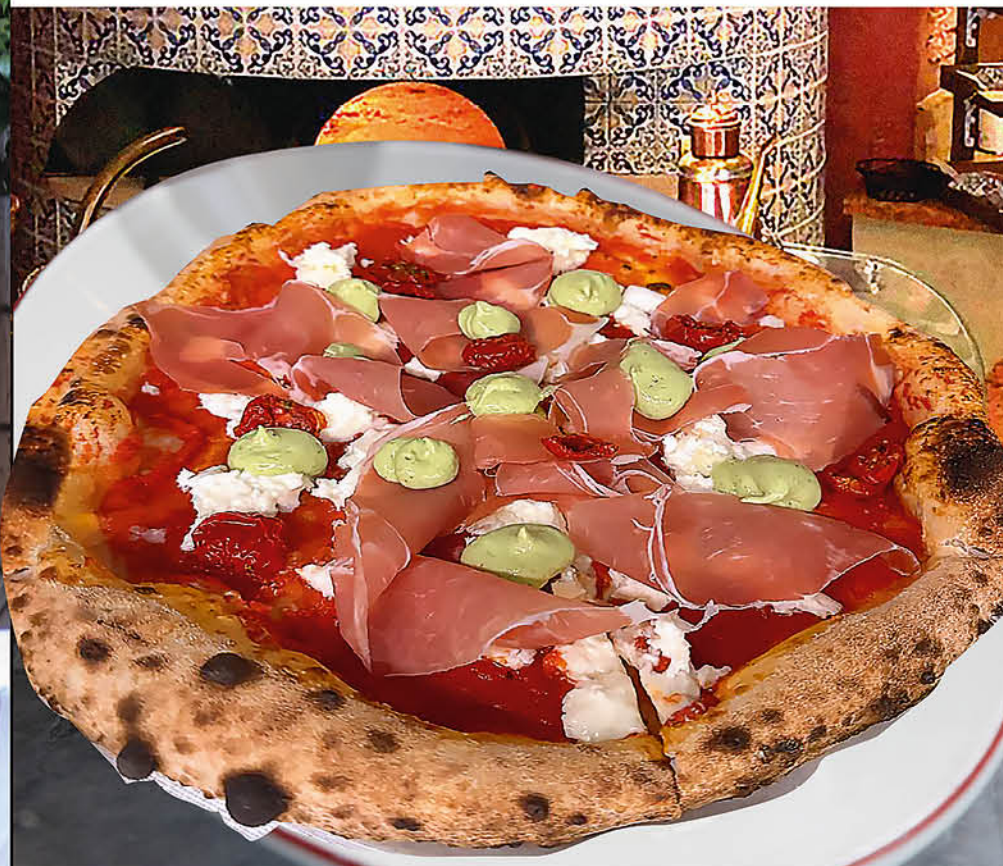
ПИЦЦА ГУРМЕ С ПРОШУТТО страчателлой, муссом из авокадо и вялеными томатами 790₽