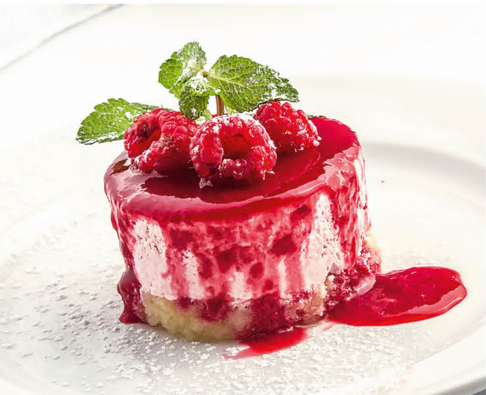
МАЛИНОВЫЙ МУСС из йогурта с ягодами, мятой и малиновым соусом