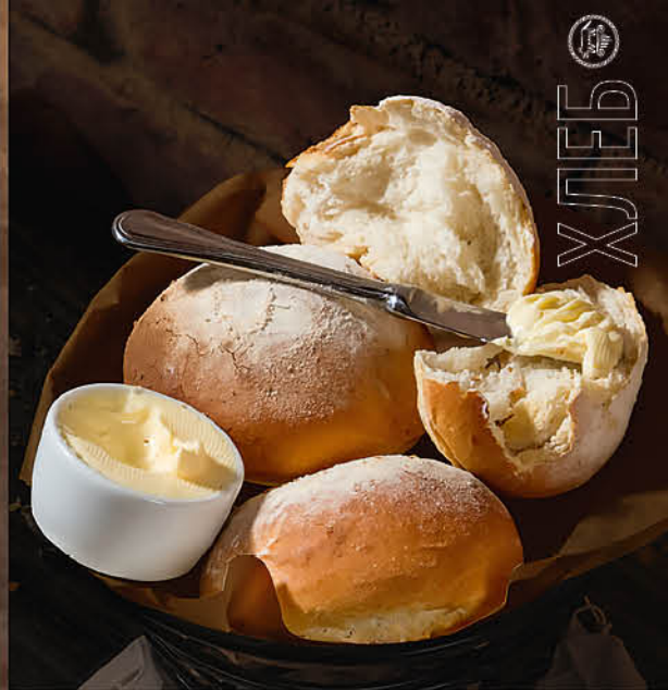
ИТАЛЬЯНСКИЙ ХЛЕБ со сливочным маслом 200₽