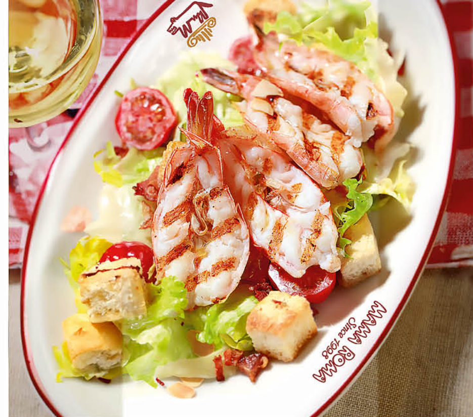
ЦЕЗАРЬ курица/креветки 490 р / 590 р