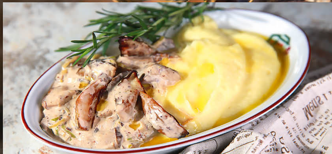
КАРТОФЕЛЬНОЕ ПЮРЕ С ЖУЛЬЕНОМ ИЗ БЕЛЫХ ГРИБОВ