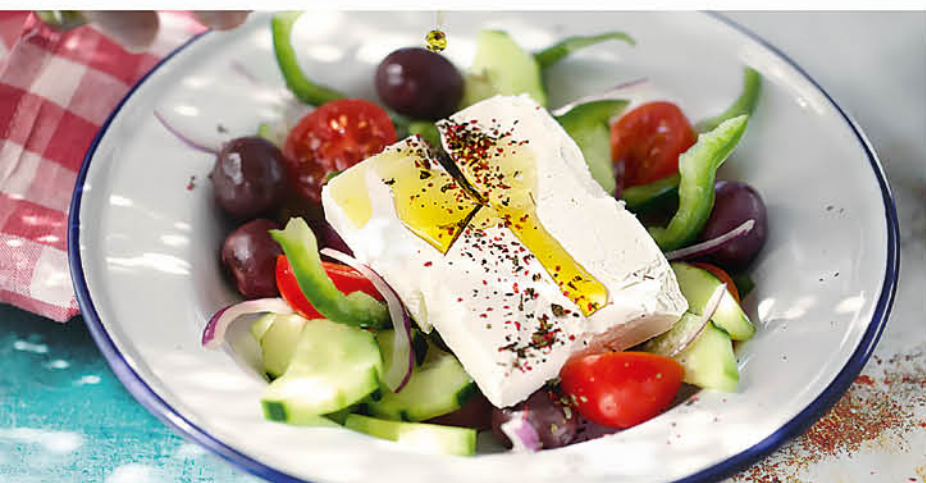
ГРЕЧЕСКИЙ САЛАТ сладкий перец, огурцы, помидоры черри, красный лук, сицилийские бурые оливки, сыр фета, оливковое масло 495 р