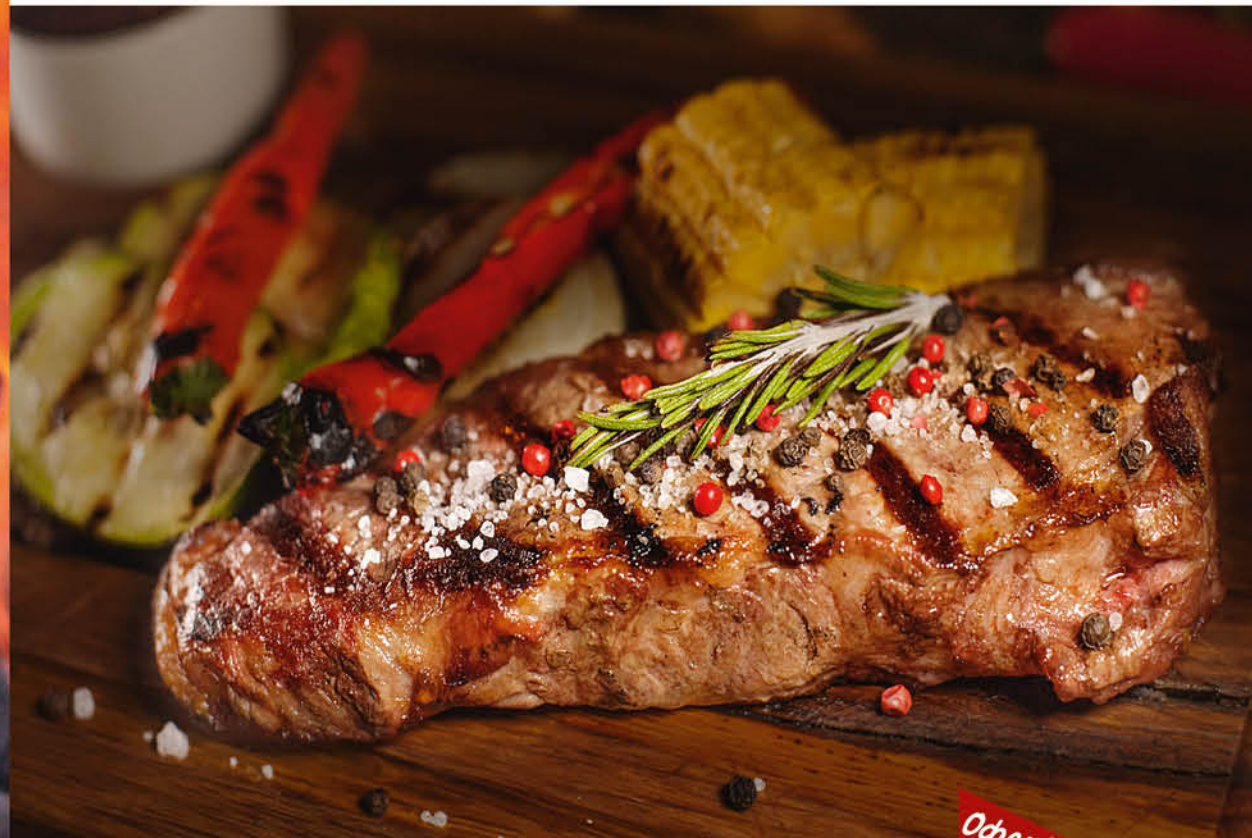
СТЕЙК СТРИПЛОЙН с овощами на гриле