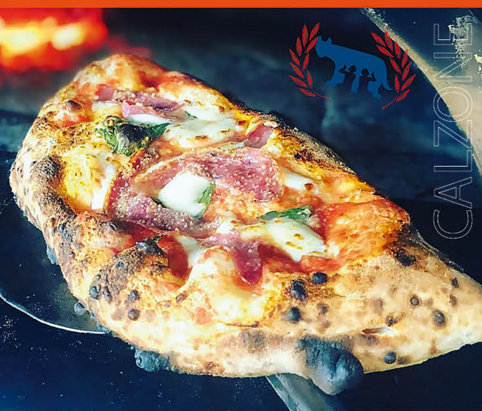
КАЛЬЦОНЕ НАМ, CHEESE & MUSHROOMS ветчина, грибы, моцарелла, пармезан, эмменталь и соус Наполи 590 р