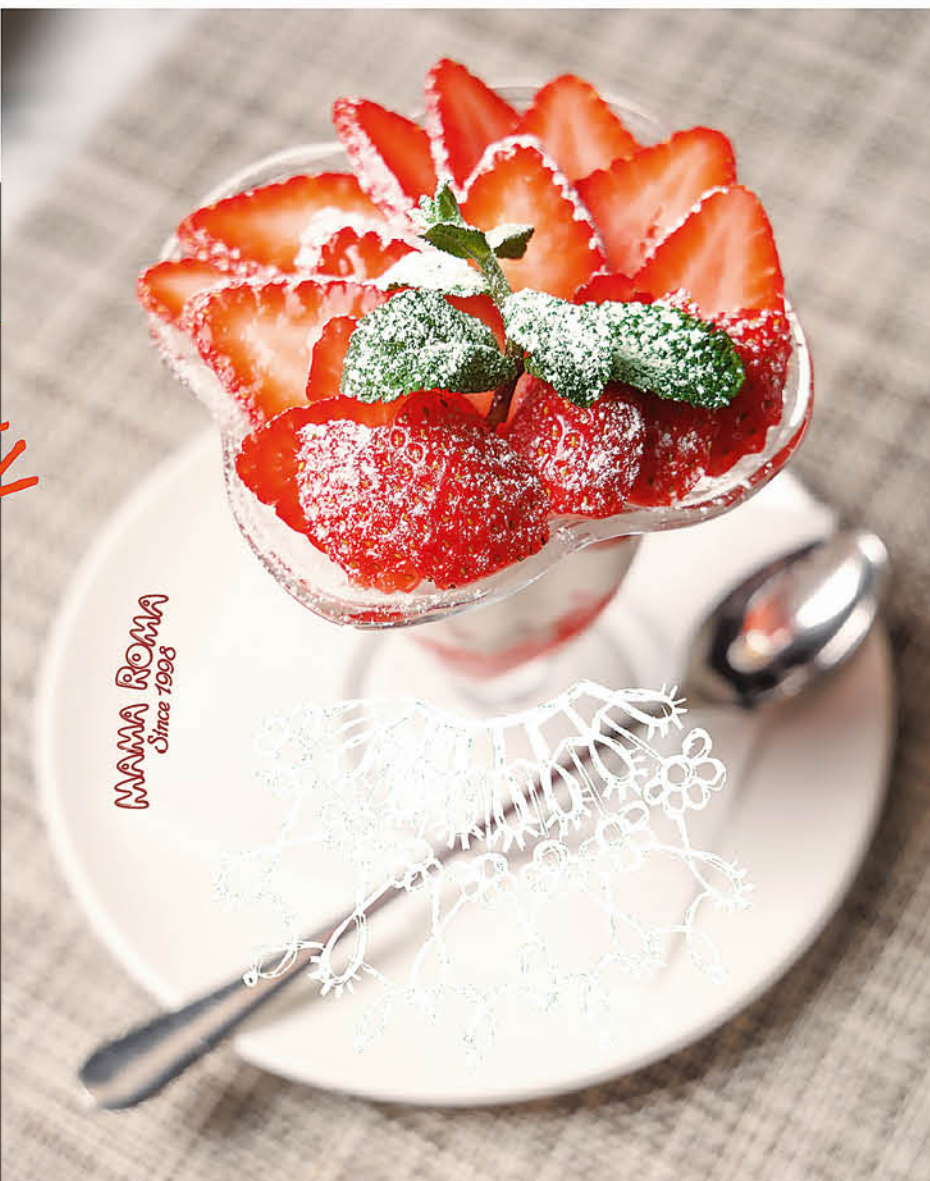
СВЕЖАЯ КЛУБНИКА С МАСКАРПОНЕ