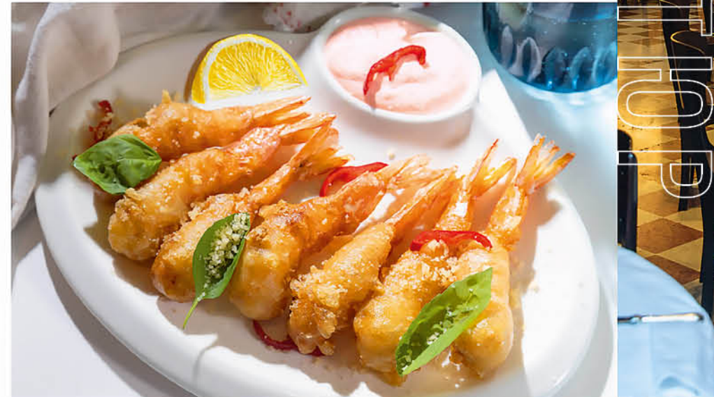
ГАМБЕРО ФРИТТО тигровые креветки в панировке с соусом Капри 695 р