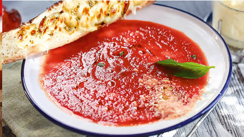
ТОМАТНЫЙ СУП 395₹ с поджаренным тостом и сыром моцарелла