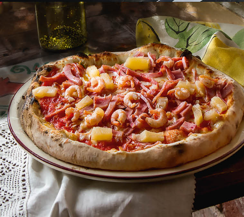
ЭКЗОТИКА креветки, ананас, ветчина, томаты, сыр моцарелла 690₽