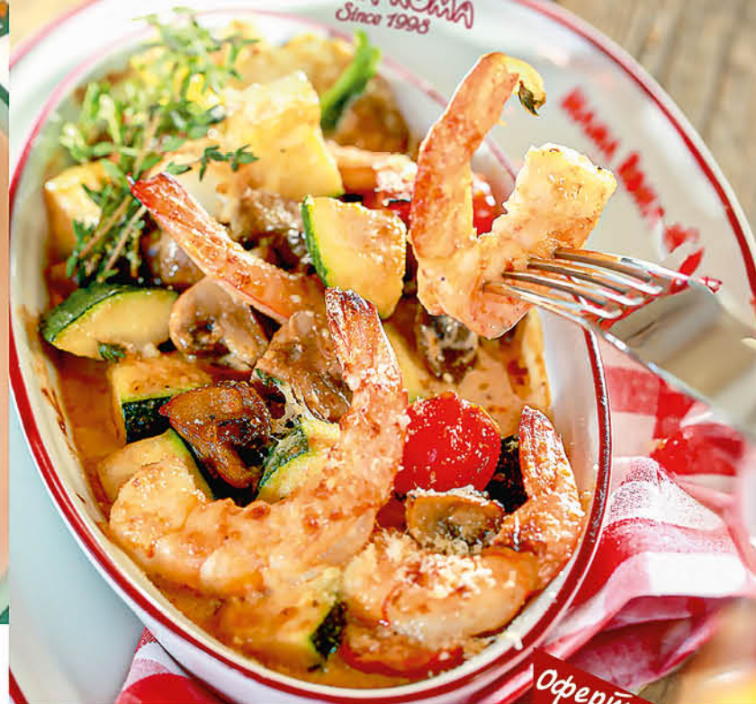
ГАМБЕРЕТТИ АЛЬ ФОРНО запеченные тигровые креветки в сливочном соусе с пармезаном, цукини и грибами 595 р