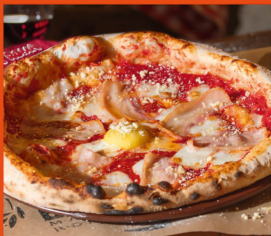
КАРБОНАРА бекон, сыр моцарелла, желток 550 р