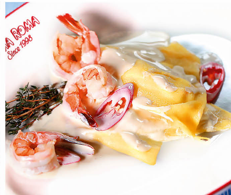
РАВИОЛИ ГРАНДЕ С ТИГРОВЫМИ КРЕВЕТКАМИ с рикоттой в сливочном соусе