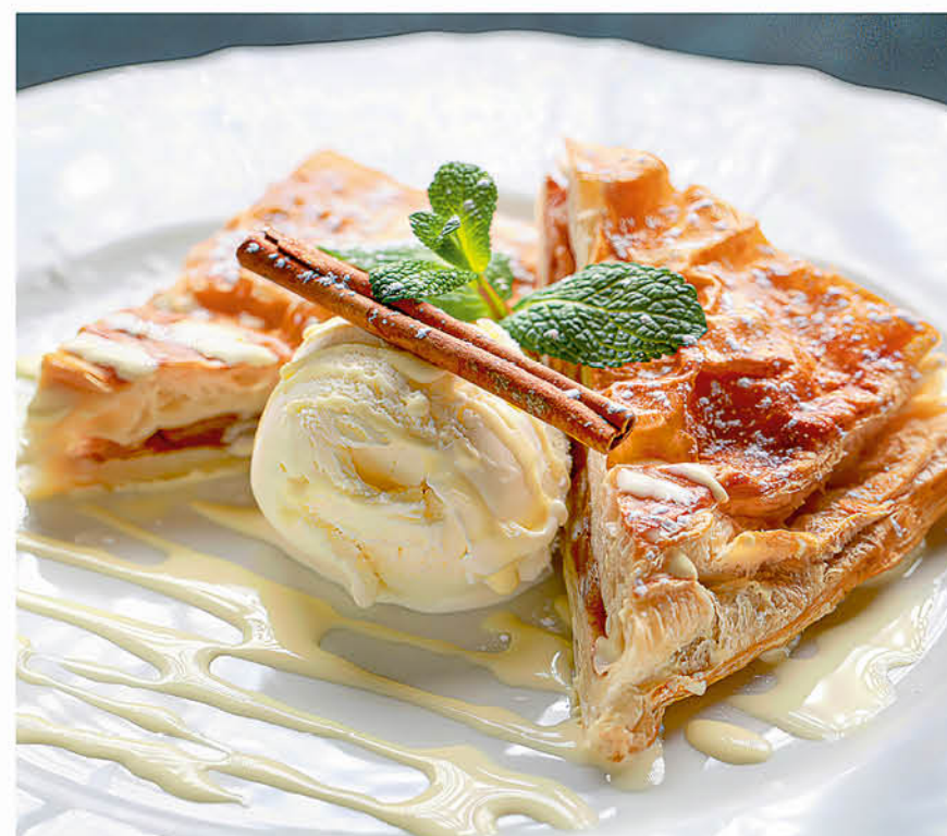
ЯБЛОЧНЫЙ ШТРУДЕЛЬ с ванильным мороженым