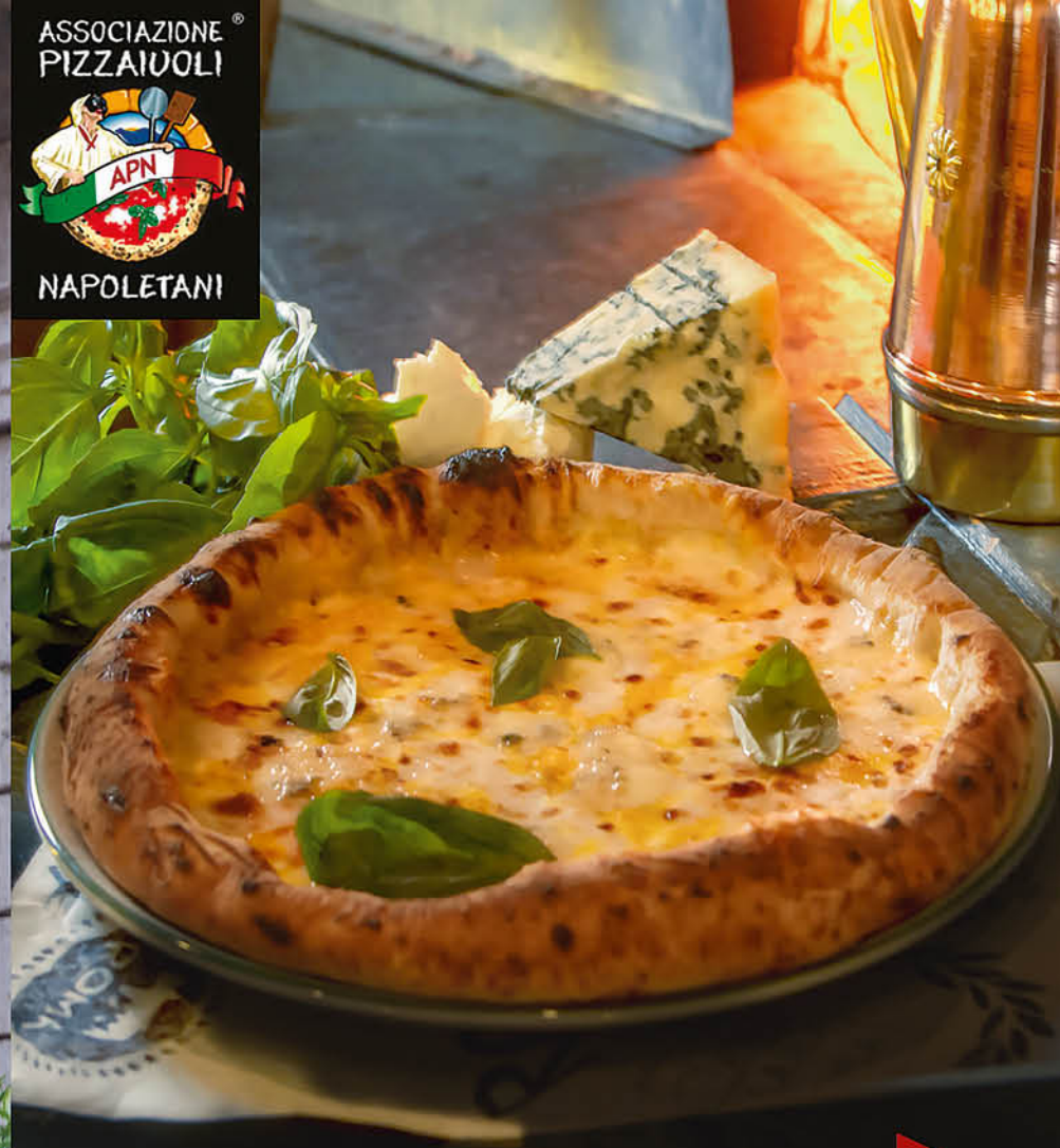
БЬАНКА ЧЕТЫРЕ СЫРА сливочный соус, моцарелла, пармезан, горгонзола, эмменталь 650₽ Оферта