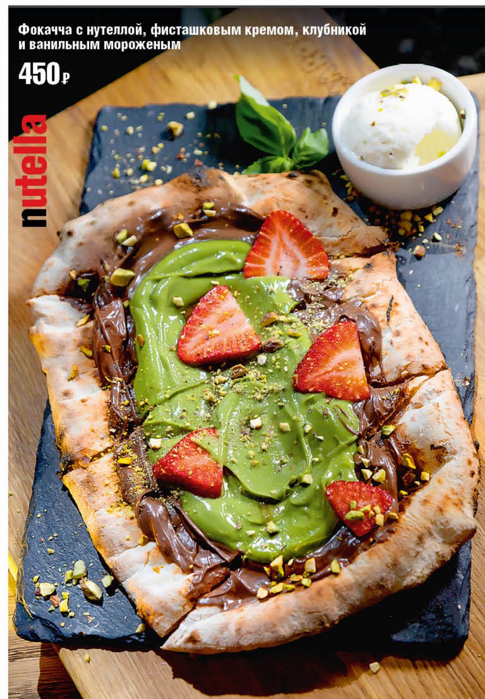
Фокачча с нутеллой, фисташковым кремом, клубникой и ванильным мороженым