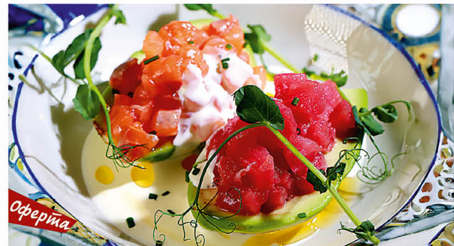
АВОКАДО С ТАРТАРОМ ИЗ ТУНЦА И ЛОСОСЯ и соусом Горгонзола 795 р