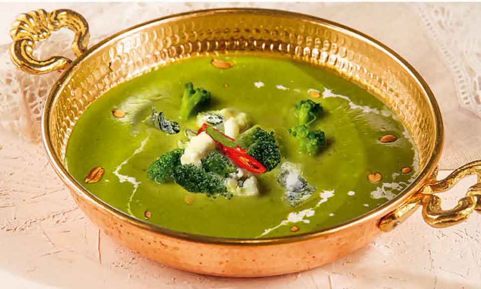
СУП-ПЮРЕ ИЗ БРОККОЛИ С ГОРГОНЗОЛОЙ 300₹