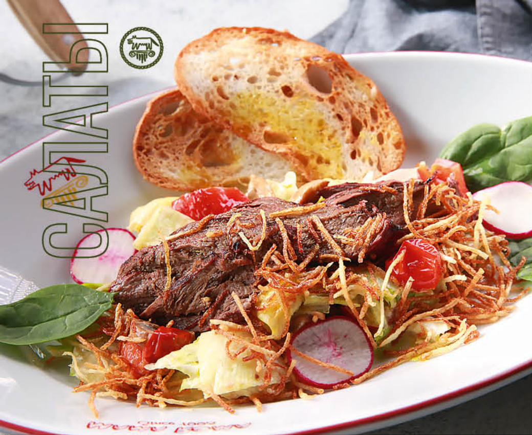
INSALATA DI ROBERTO Теплый салат с говядиной гриль, кростини и соусом Цезарь 650 р