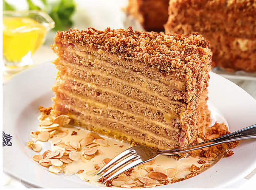
МЕДОВИК с ванильным соусом