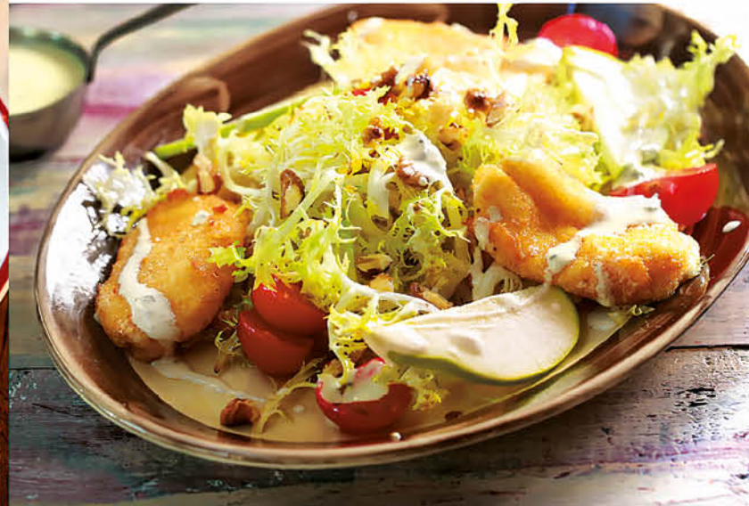
САЛАТ С МОЦАРЕЛЛОЙ ФРИТТА И СОУСОМ ГОРГОНЗОЛА жареная моцарелла, помидоры черри и груша 480 р