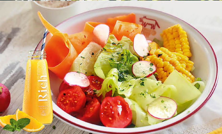
INSALATA FRESCA салат из свежих овощей с оливковым маслом Extra Virgin 395 р