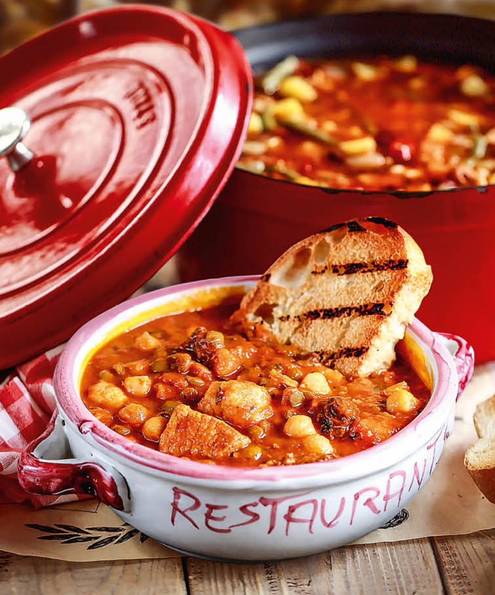
СУП-ГУЛЯШ ПО-ТОСКАНСКИ 495₹ мясной суп с говядиной, свиной, куриным филе, овощами и нутом