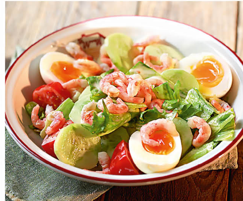
КАПРИ салат айсберг, креветки, огурцы, помидоры черри, яйца, соус Капри 530 р