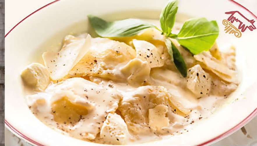
РАВИОЛНИ ЧЕТЫРЕ СЫРА с рикоттой в сливочном соусе с сыром горгонзола, пармезаном и моцареллой