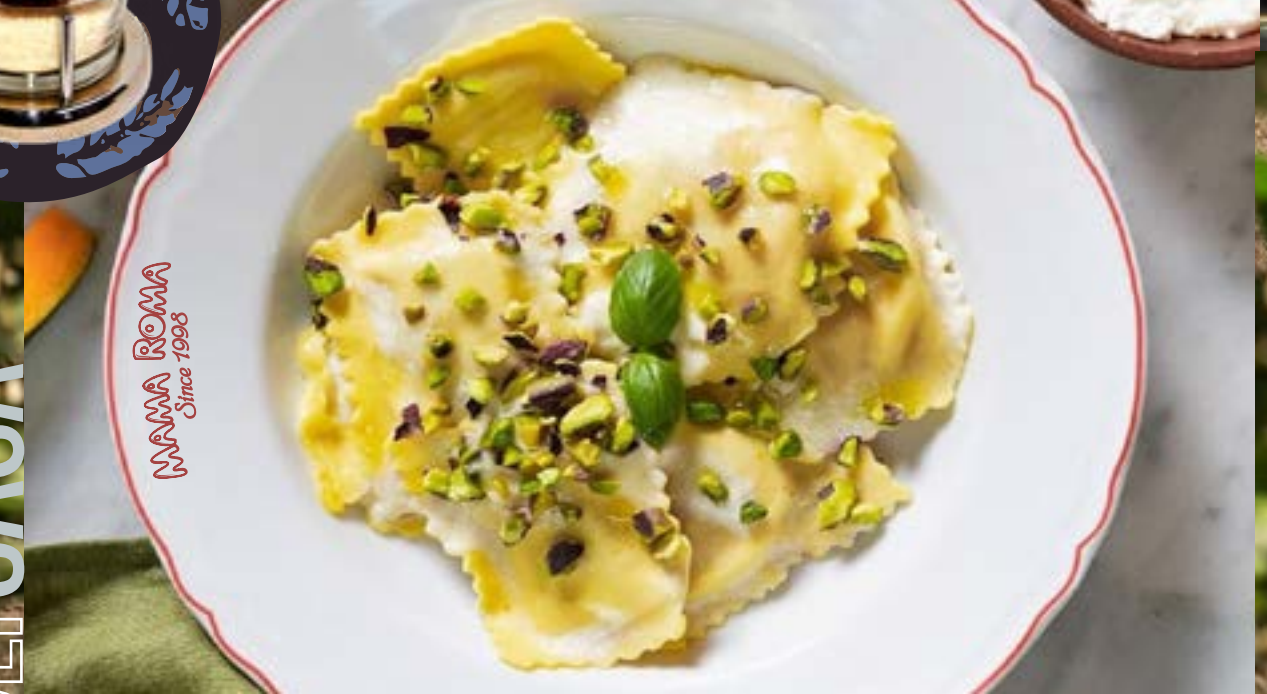
ДОМАШНИЕ РАВИОЛИ С РИКОТТОЙ в соусе из сливочного масла с фисташками 335₽