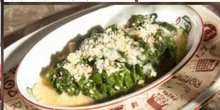
НЕЖНЫЙ ШПИНАТ С ПАРМЕЗАНОМ 235₹ обжаренный на сливочном масле