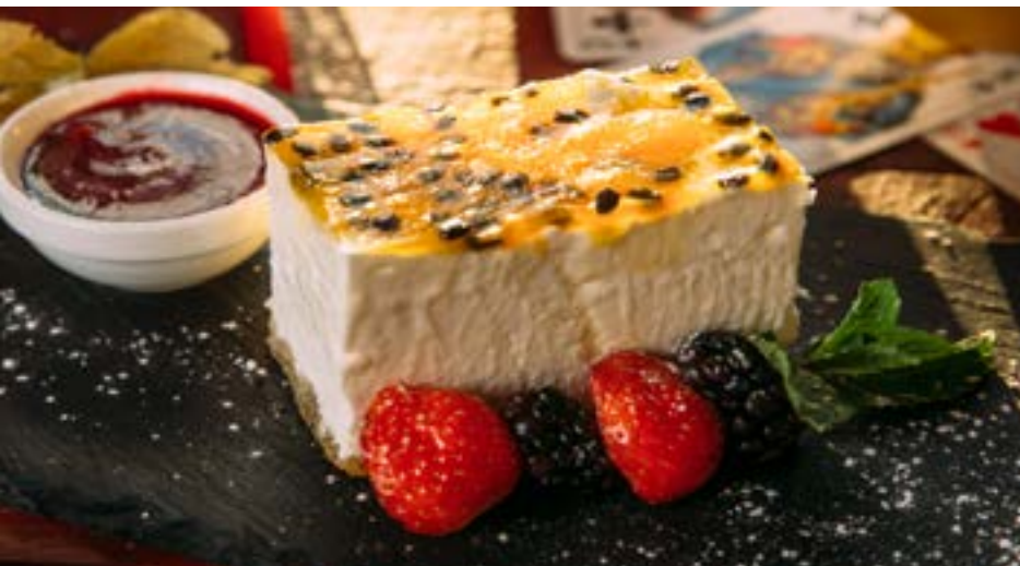
ЧИЗКЕЙК С МАРАКУЙЕЙ 310 р