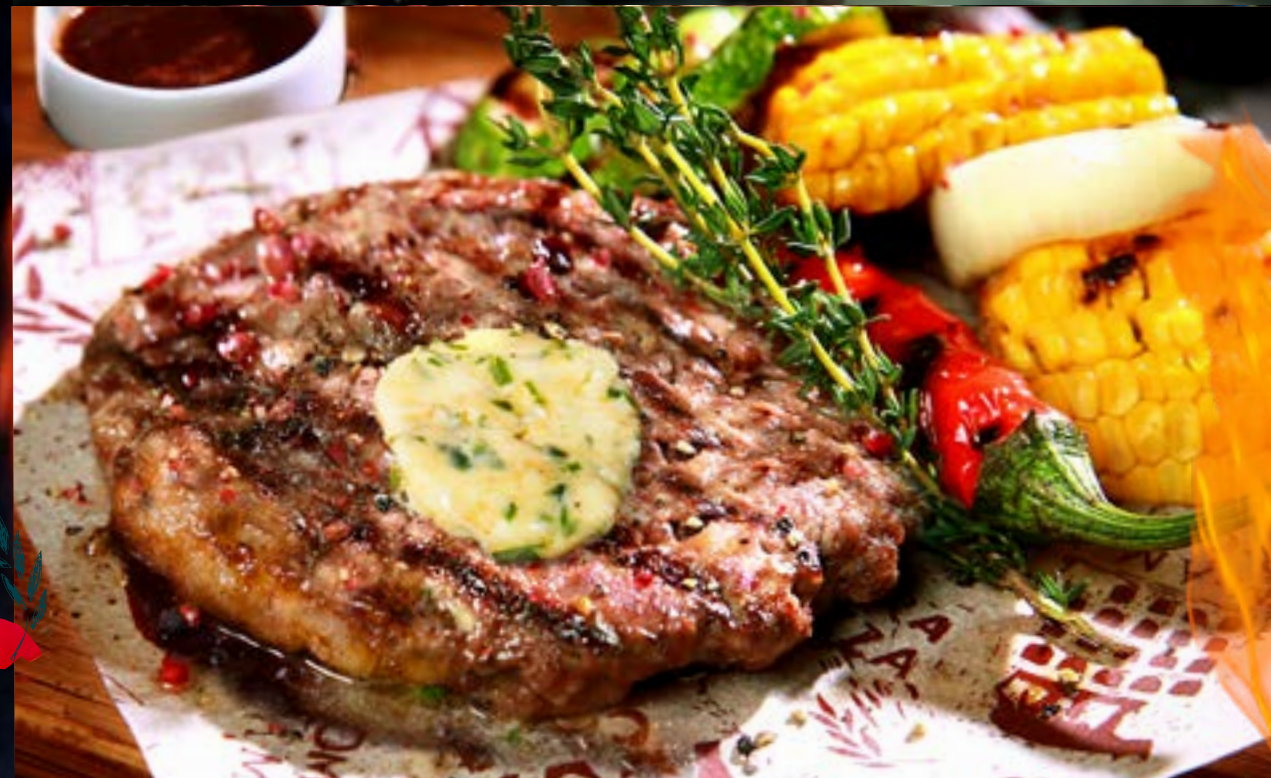
БИСТЕККА ИЗ МРАМОРНОЙ ГОВЯДИНЫ с овощами гриль