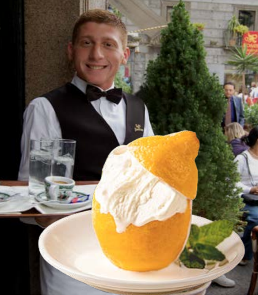
SORBETTO AL LIMONE 195₺ лимонный сорбет