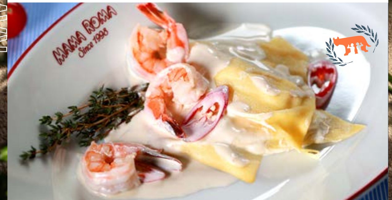
РАВИОЛИ ГРАНДЕ С ТИГРОВЫМИ КРЕВЕТКАМИ с рикоттой в сливочном соусе 375₽