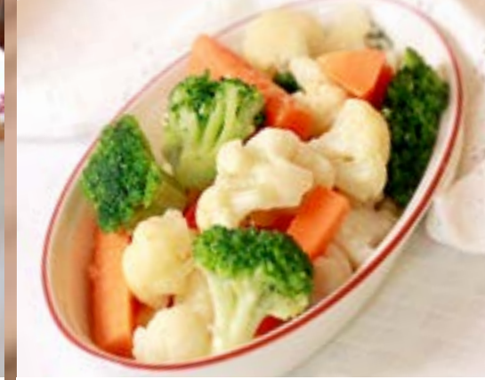
ОВОЩИ НА ПАРУ 210₹