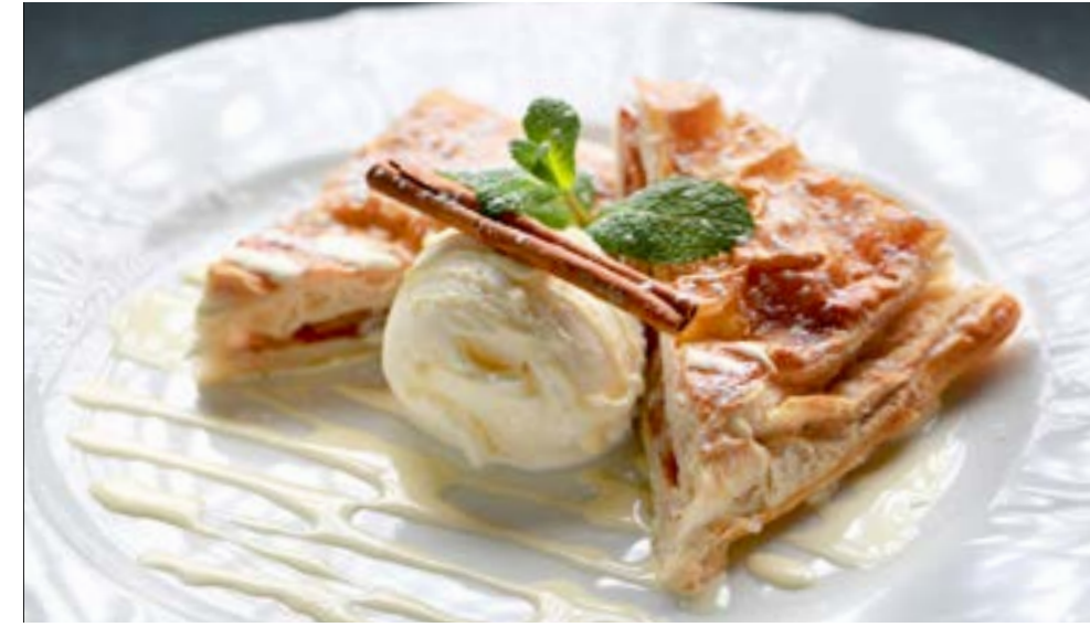
ЯБЛОЧНЫЙ ШТРУДЕЛЬ с ванильным мороженым 275 р