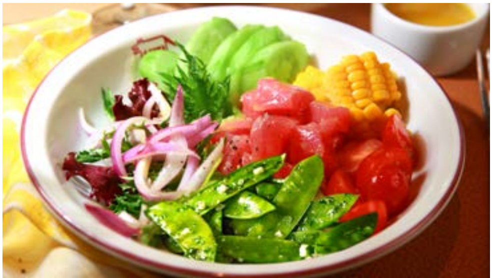
КРУДО ИЗ ТУНЦА С АПЕЛЬСИНОМ И МЕДОВОЙ ГОРЧИЦЕЙ 475₹ с молодым стручковым горошком, черри, кукурузой, свежим огурцом и миксом салатов