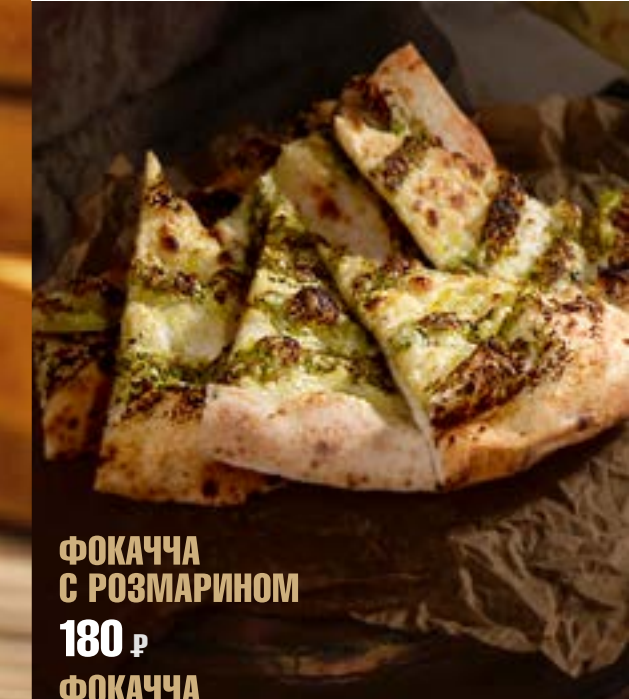
ФОКАЧЧА С РОЗМАРИНОМ 180 р ФОКАЧЧА С СОУСОМ ПЕСТО 195 р