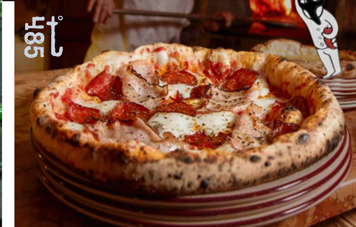
ПУЛЬЧИНЕЛЛА домашний бекон, салами, моцарелла