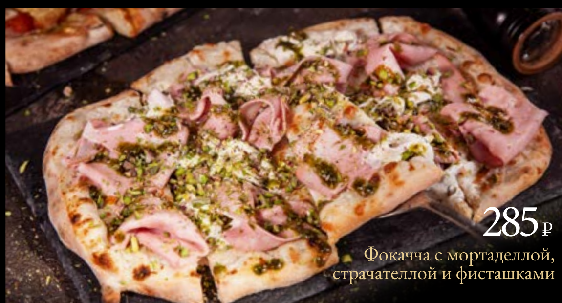
285 ₺ Фокачча с мортаделлой, страчателлой и фисташками