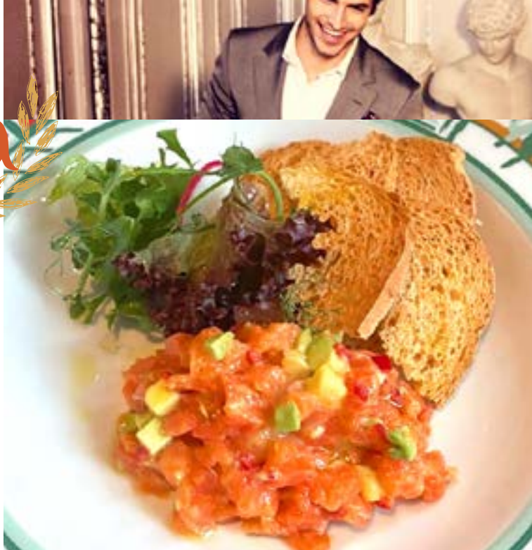
ТАРТАР ИЗ ЛОСОСЯ с авокадо, кростини в медово-горчичном соусе 435₹