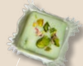
Фисташка в лаймовом шоколаде