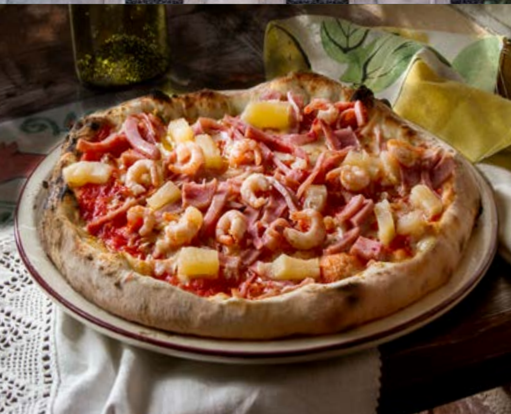
ЭКЗОТИКА креветки, ананас, ветчина, томаты, сыр моцарелла 395 р