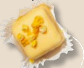
Манго в апельсиновом шоколаде