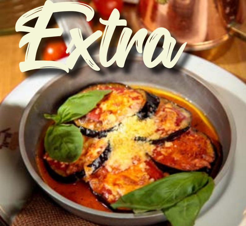
ЗАПЕЧЕННЫЕ БАКЛАЖАНЫ 275₹ с пармезаном, томатами и базиликом