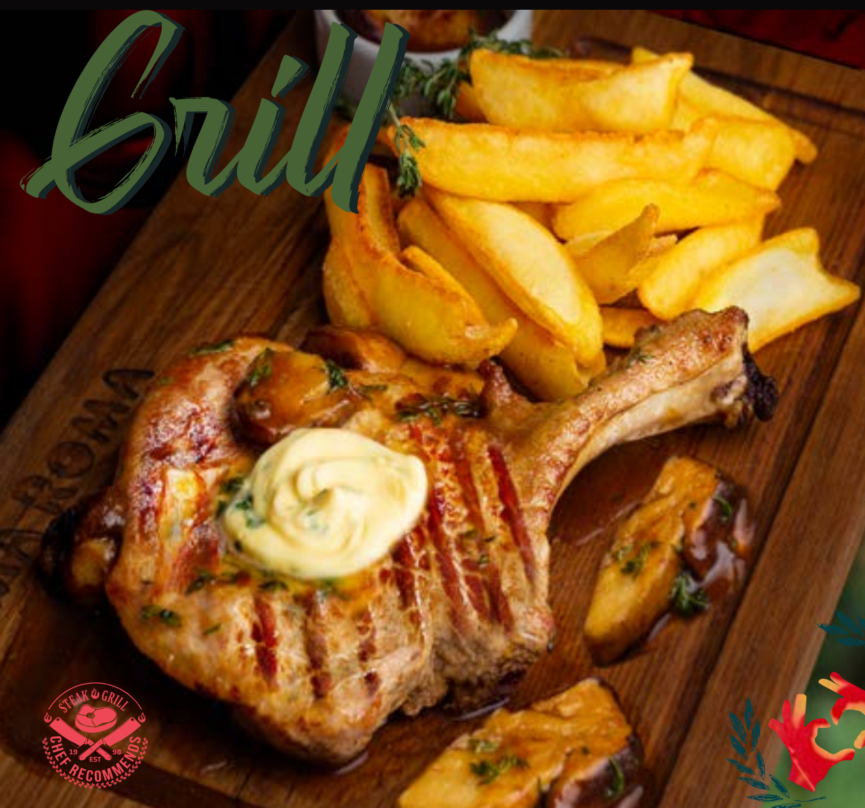
СОЧНЫЙ СТЕЙК ИЗ СВИНИНЫ с картофелем и розмарином