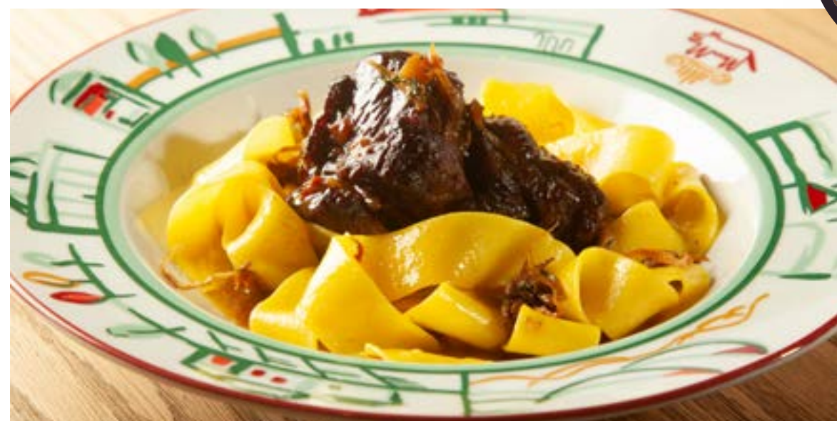
ПАППАРДЕЛЛЕ МИЛАНЕЗЕ С РАГУ ИЗ ЩЕЧЕК и шафрановым маслом 375₽