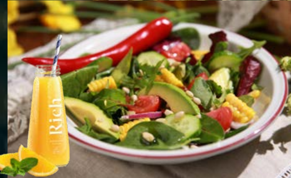
INSALATA FRESCA 235₽ салат из свежих овощей с авокадо и оливковым маслом Extra Virgin