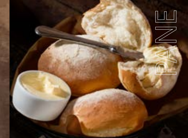
ИТАЛЬЯНСКИЙ ХЛЕБ со сливочным маслом 115 р