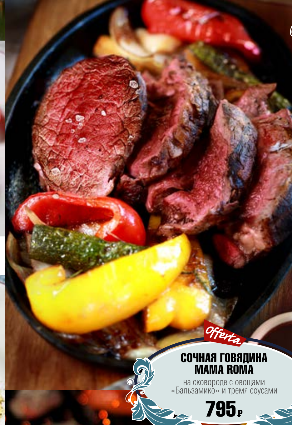
Офферта СОЧНАЯ ГОВЯДИНА МАМА РОМА на сковороде с овощами «Бальзамико» и тремя соусами