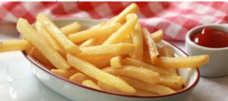
КАРТОФЕЛЬ ФРИ 170₹