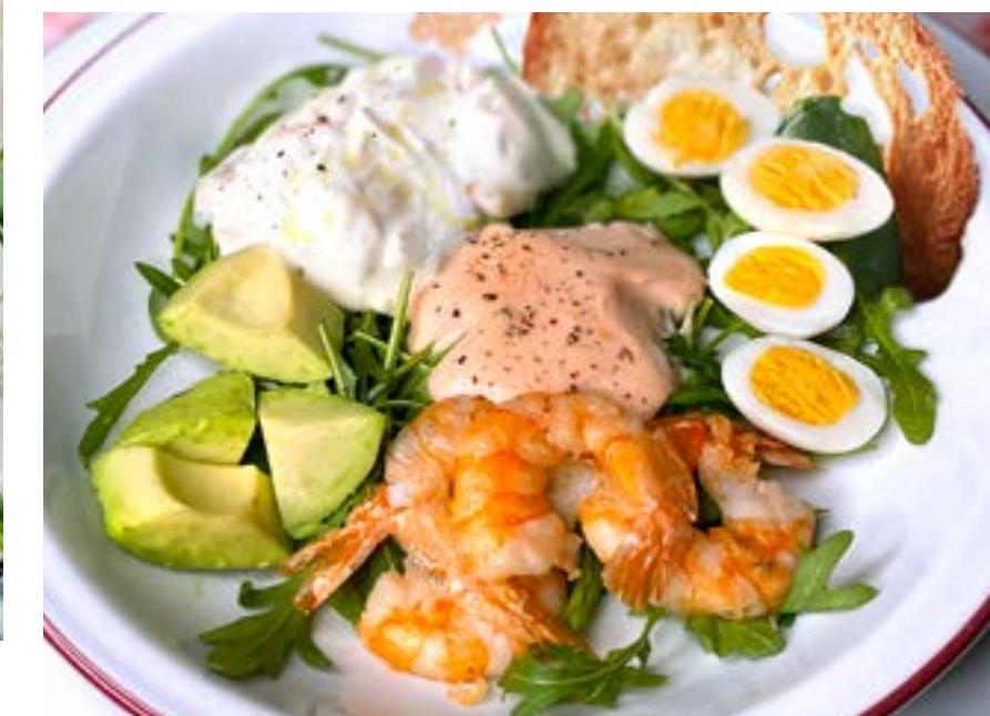
САЛАТ С КРЕВЕТКАМИ, АВОКАДО И СТРАЧАТЕЛЛОЙ 435₽ нежной страчателлой, рукколой, перепелиными яйцами и соусом Капри