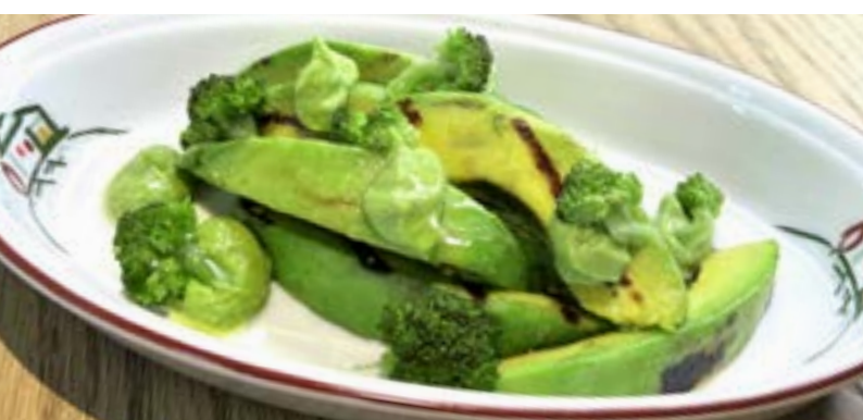
АВОКАДО НА ГРИЛЕ 265₹ с соусом из авокадо, киви и брокколи