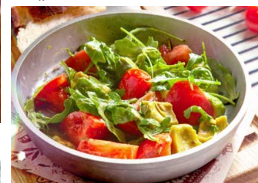
САЛАТ ИЗ АВОКАДО 375₽ авокадо, бакинские томаты с зеленью в горчично-медовом соусе