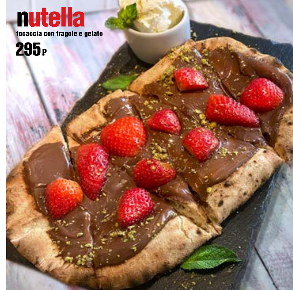
nutella focaccia con fragole e gelato 295 р