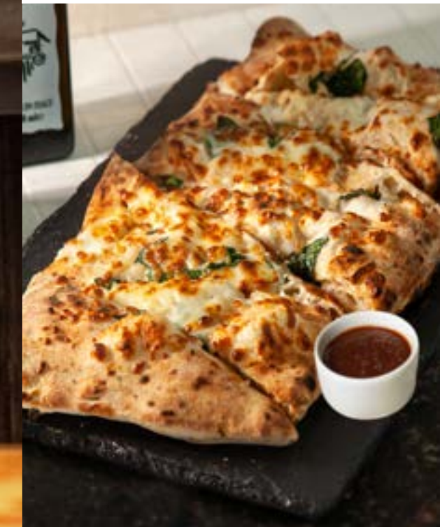
СЫРНАЯ ФОКАЧЧА с соусом Бьянко, с моцареллой, с сыром эмменталь и пармезаном 285 р