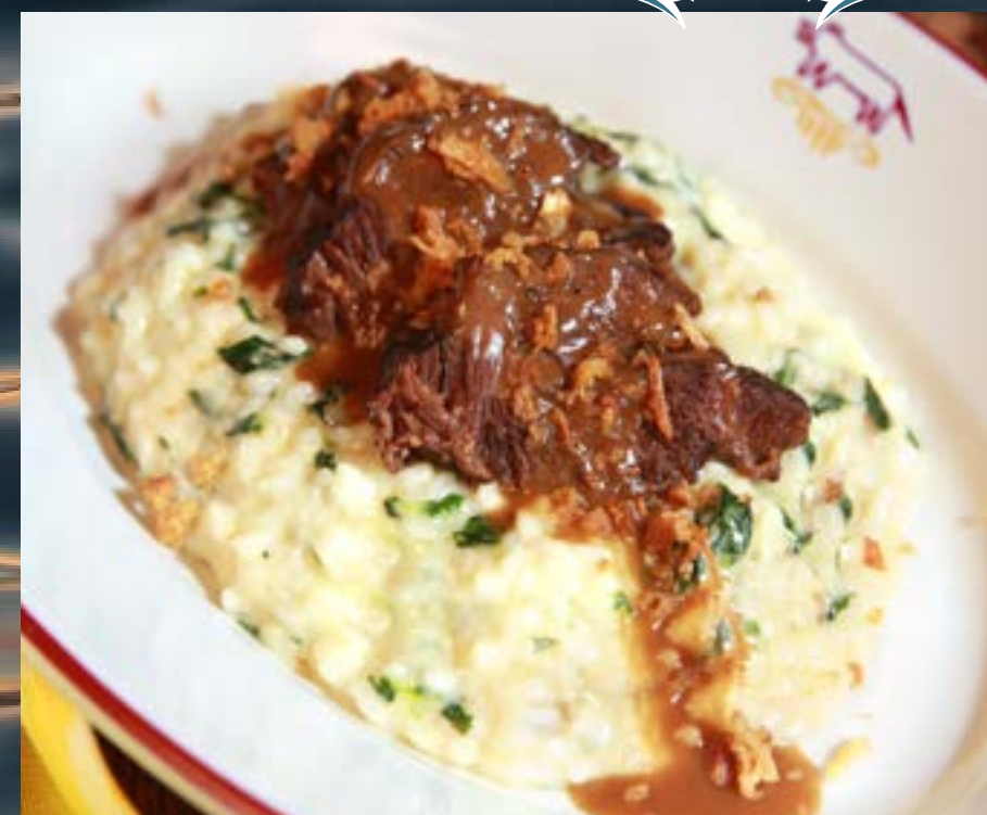
РИЗОТТО С НЕЖНЫМИ ТОМЛЕННЫМИ ГОВЯЖЬИМИ ЩЁЧКАМИ со шпинатом