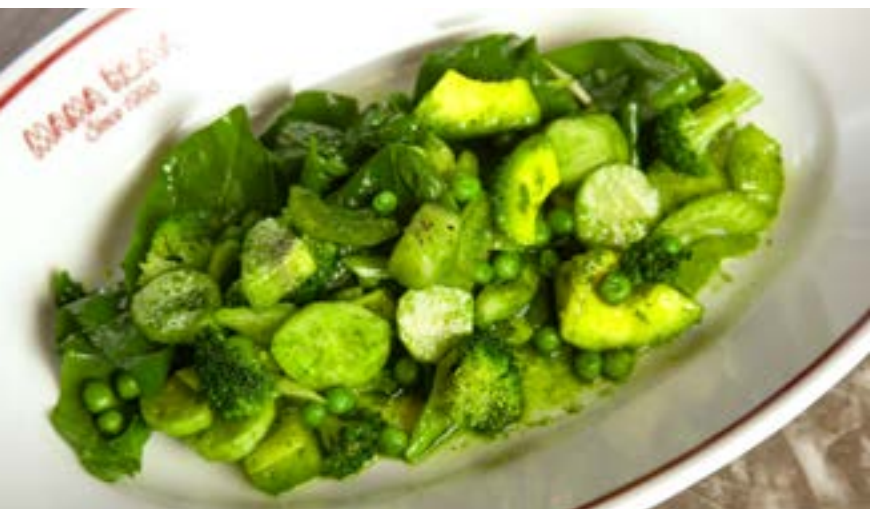
ЗЕЛЕНЬ САЛАТ С АВОКАДО И КИВИ шпинат, зеленый горошек, огурец, сельдерей с соусом из шпината и тархуна 325₹