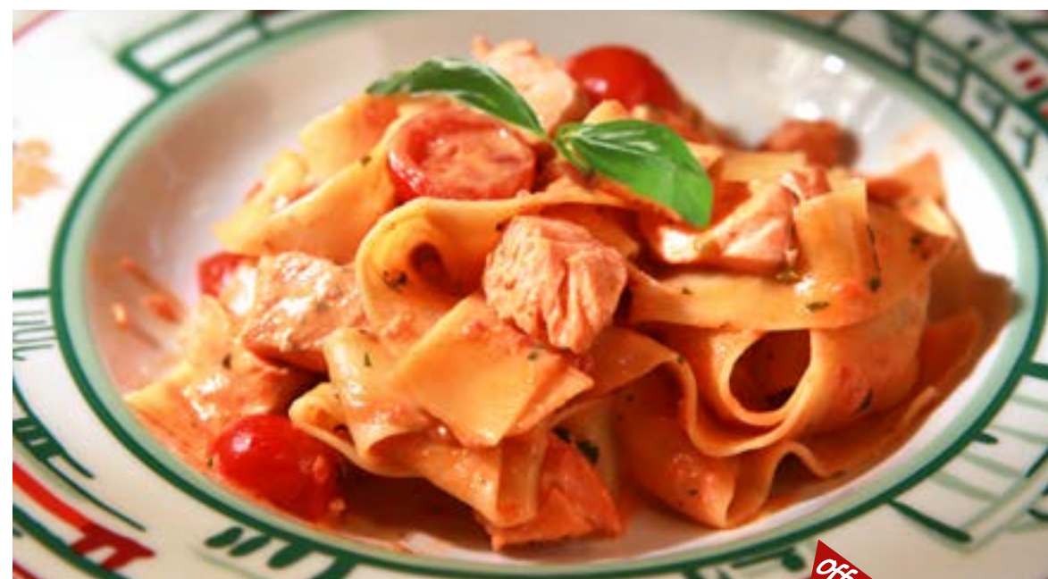
ПАППАРДЕЛЛЕ С ЛОСОСЕМ с базиликом, итальянскими травами, оливками, помидорами черри в сливочном соусе 395₽