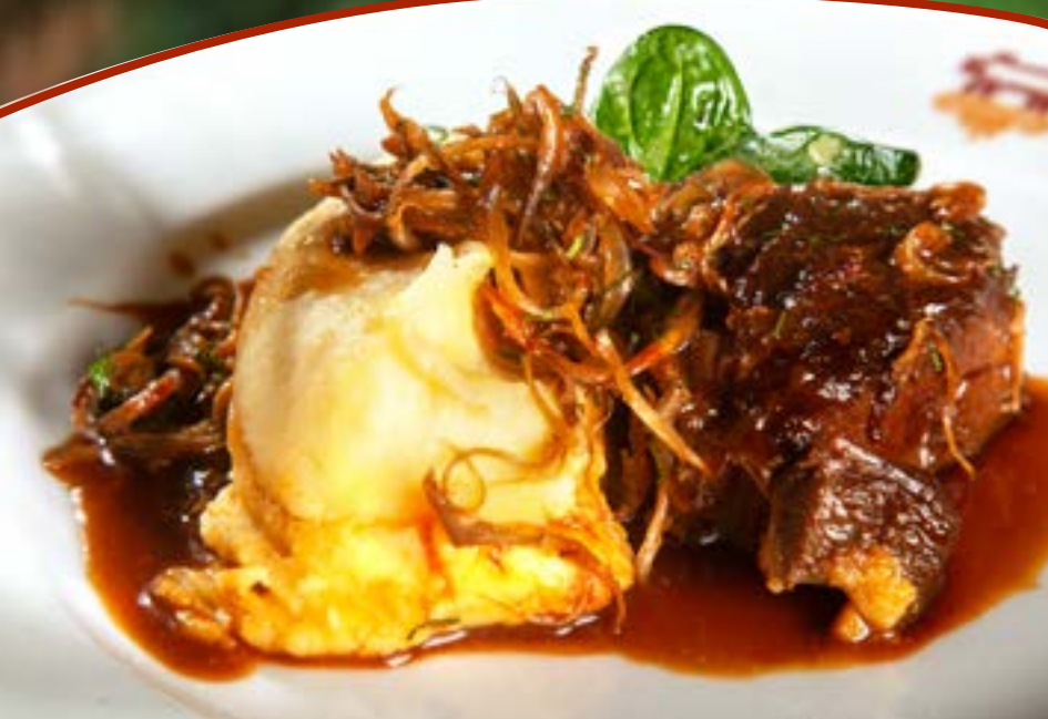
ГОВЯЖЬИ ЩЁЧКИ с нежным картофельным пюре и соусом из красного вина