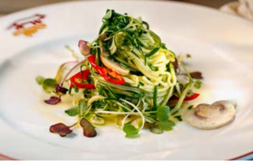
САЛАТ ИЗ ЦУКИНИ цукини, шампиньоны, оливковое масло, перец чили 255₹