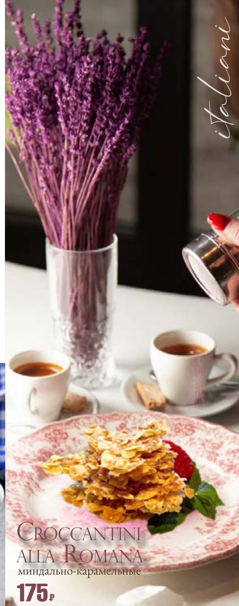
CROCCANTINI ALLA ROMANA миндально-карамельные 175₺