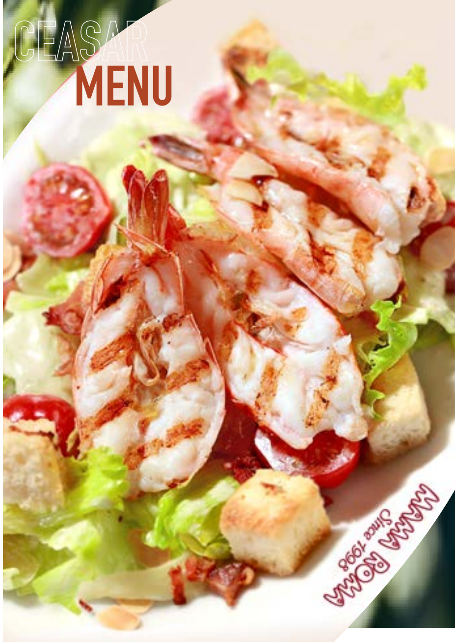
ЦЕЗАРЬ С КУРИЦЕЙ 385₽ ЦЕЗАРЬ С КРЕВЕТКАМИ 435₽ креветки на гриле, листья салата айсберг, помидоры черри, хрустящие сухарики, бекон, насыщенный соус Цезарь и лепестки миндаля