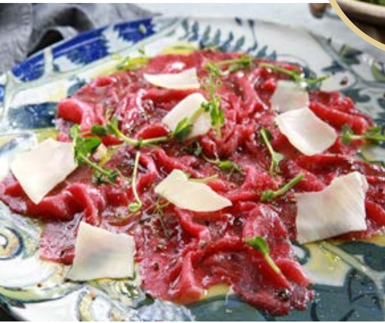
CARPACCIO карпаччо из говядины с пармезаном 395₹