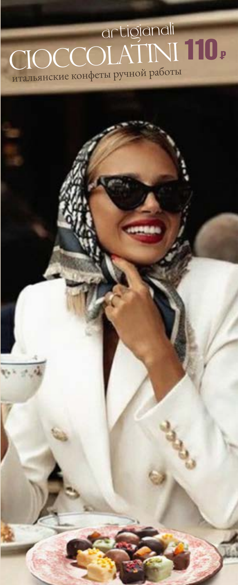
artigianali CIOCCOLATINI 110₺ итальянские конфеты ручной работы