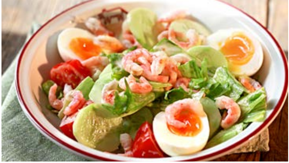
КАПРИ салат айсберг, креветки, огурцы, помидоры черри, яйца, соус Капри 420₹