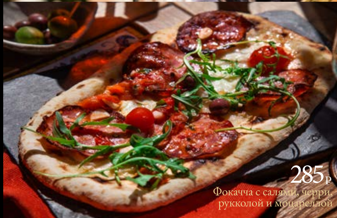
285 ₺ Фокачча с салями, черри, рукколой и моцареллой