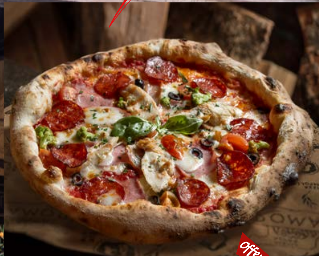
МАМА РОМА домашний бекон, салями, куриное филе, брокколи, маслины и помидоры черри 475 р