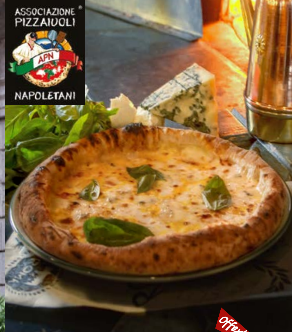
БЬЯНКА ЧЕТЫРЕ СЫРА сливочный соус, моцарелла, пармезан, горгонзола, эмменталь 435 р