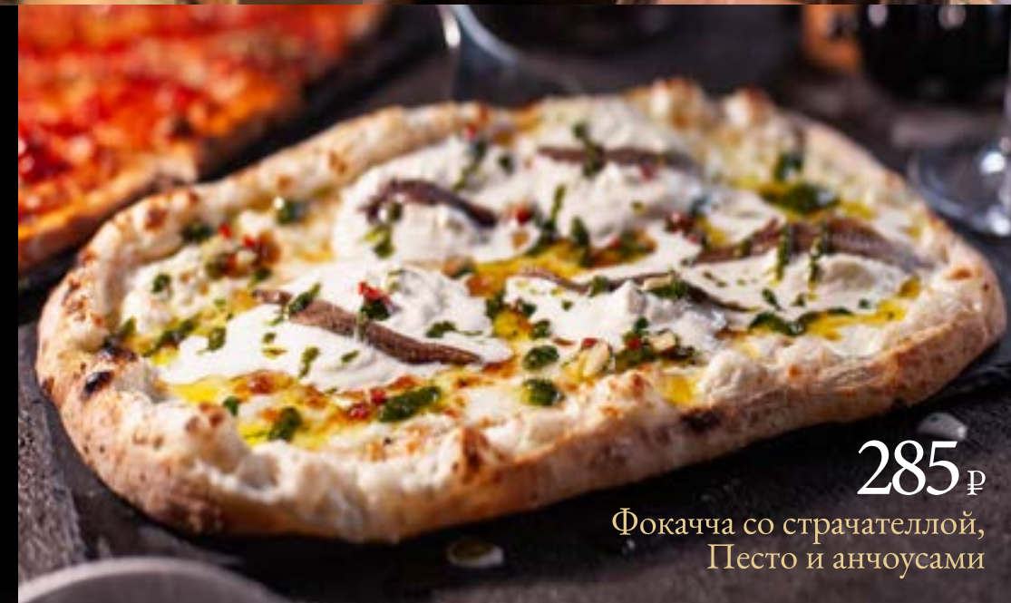
285 ₺ Фокачча со страчателлой, Песто и анчоусами