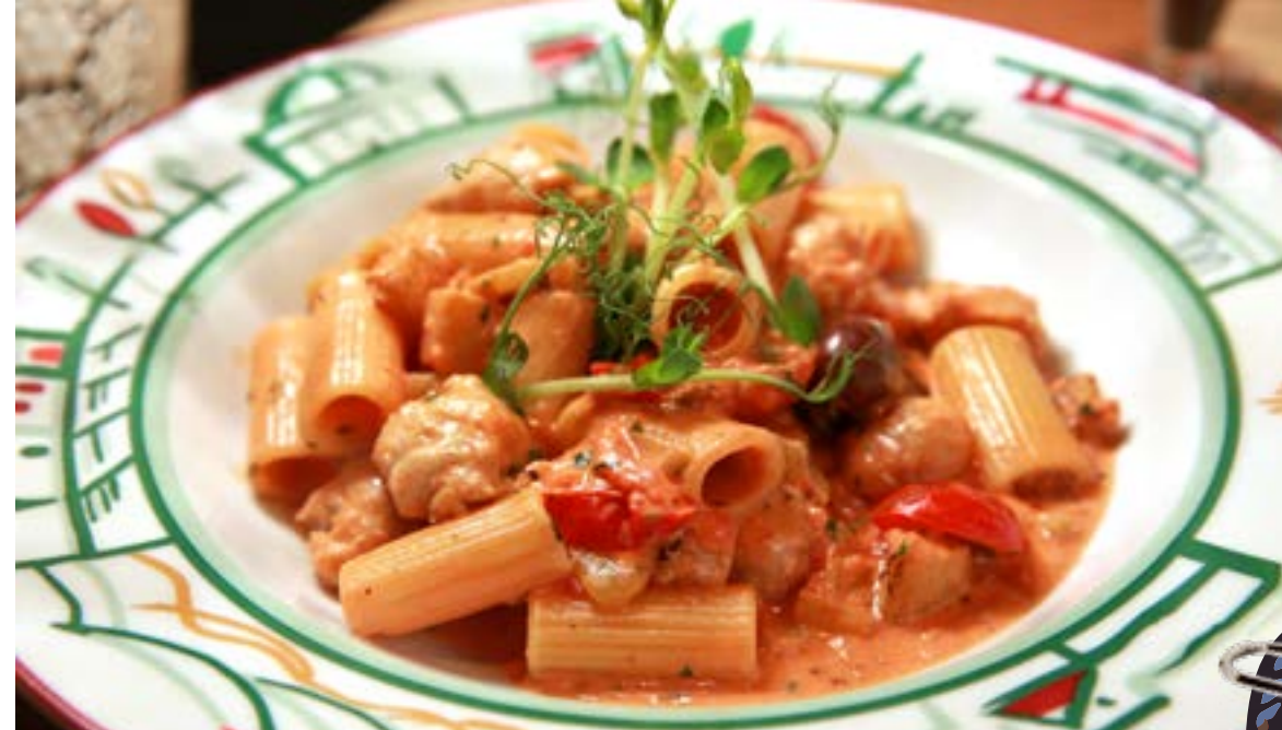
РИГАТОНИ С САЛЬСИЧЧЕЙ оливками в сливочно-томатном соусе 365₽