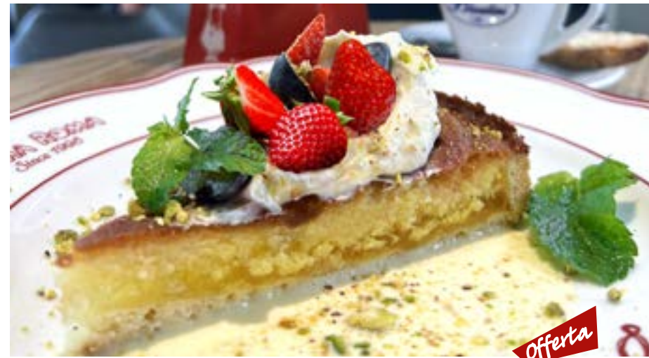
TORTA DI NONNA с кремом из маскарпоне с фисташками 235 р