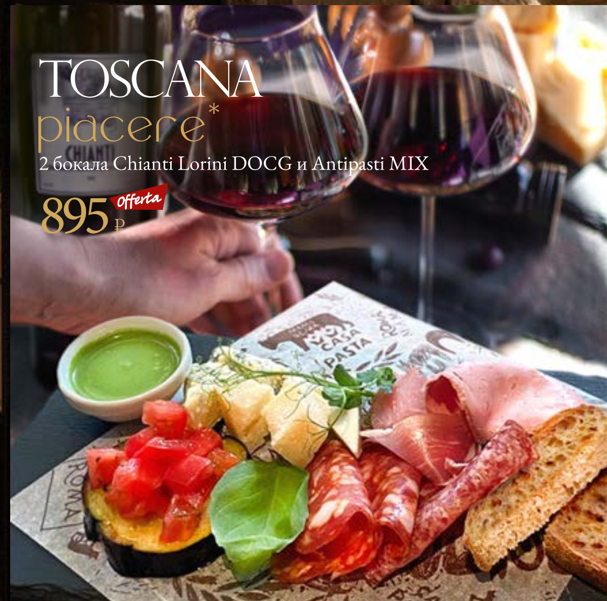
Antipasti MIX 395 ₺ *Грана падано, пекорино, прошутто, салями, баклажан с тар-таром из бакинских томатов, кростини, соус из рукколы