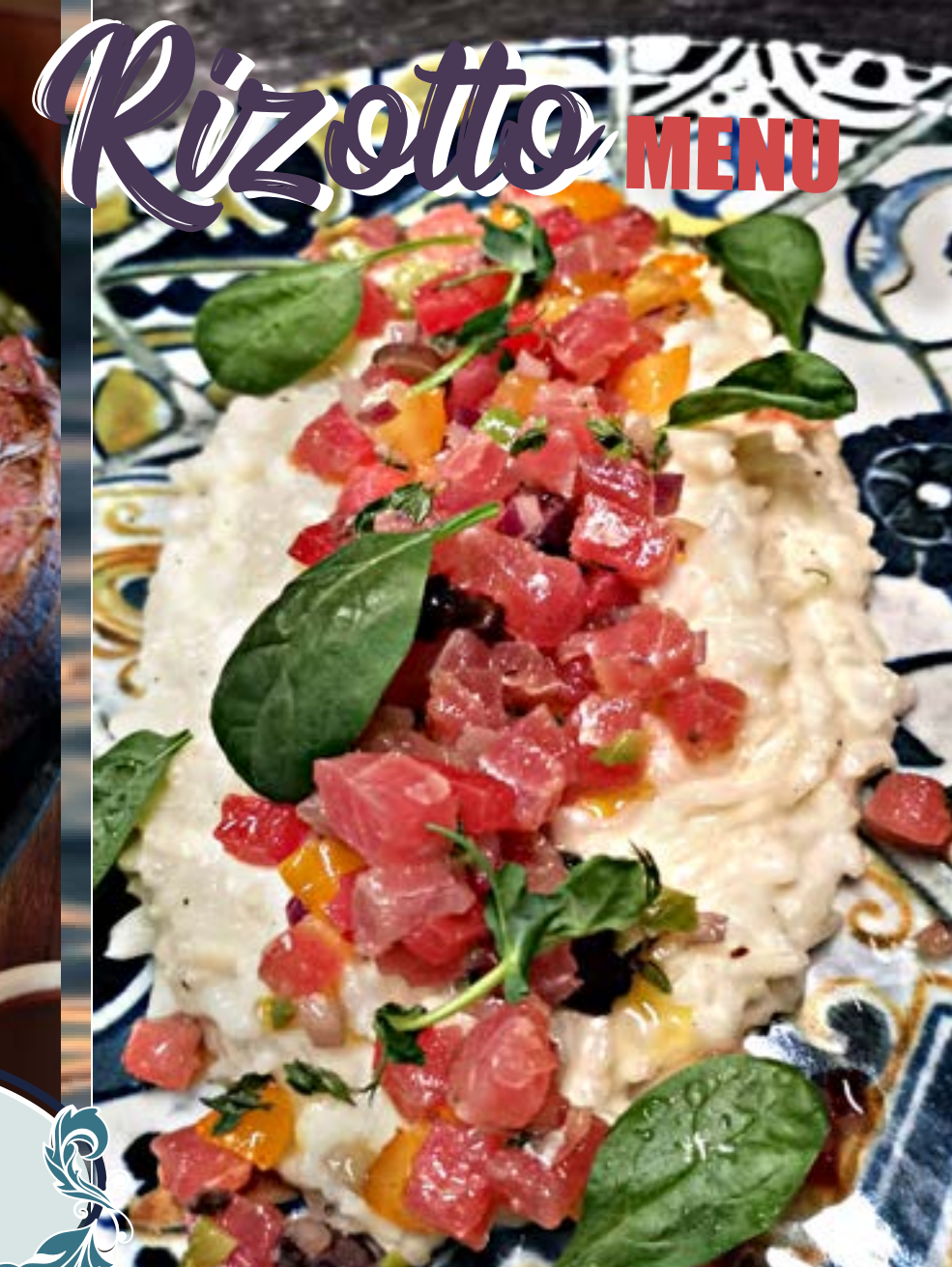
СЛИВОЧНОЕ РИЗОТТО С ТАРТАРОМ ИЗ ТУНЦА