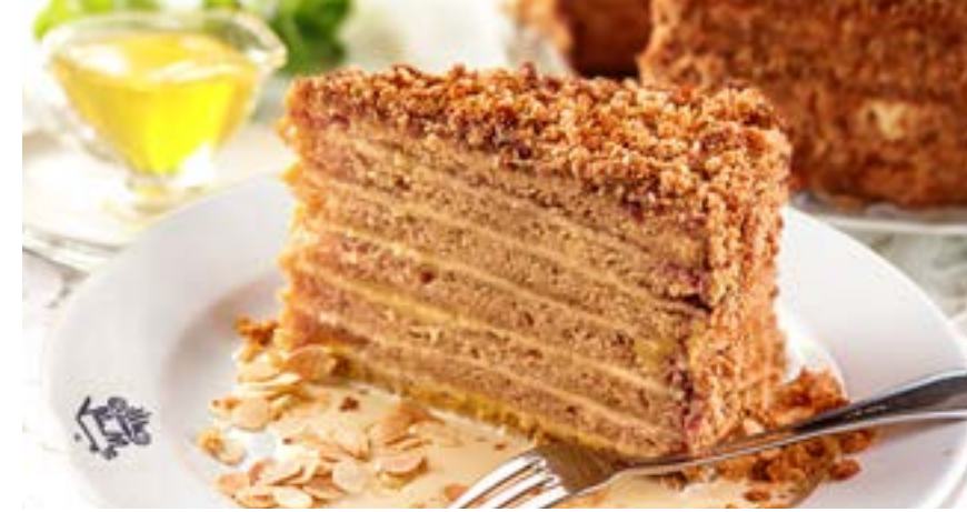
МЕДОВИК с ванильным соусом 290 р