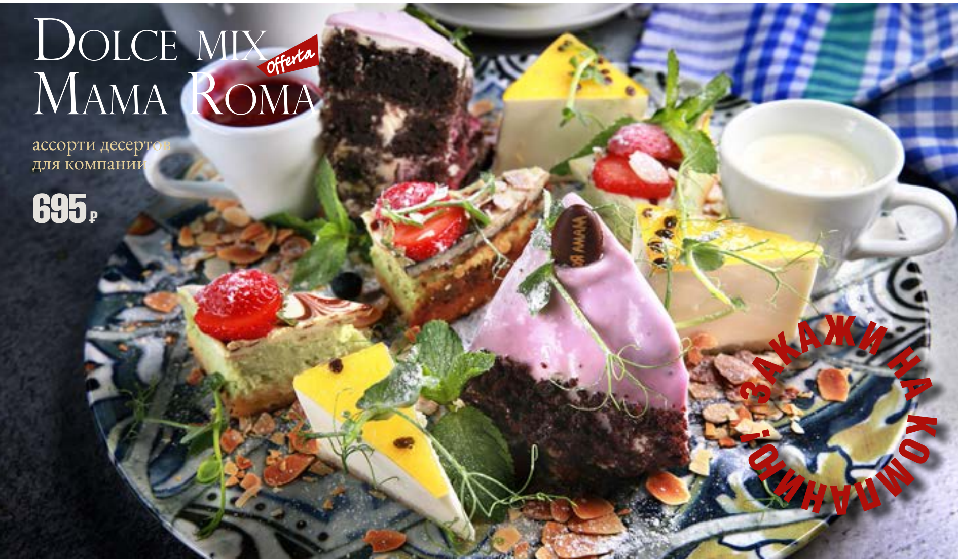
DOLCE MIX offerta MAMA ROMA