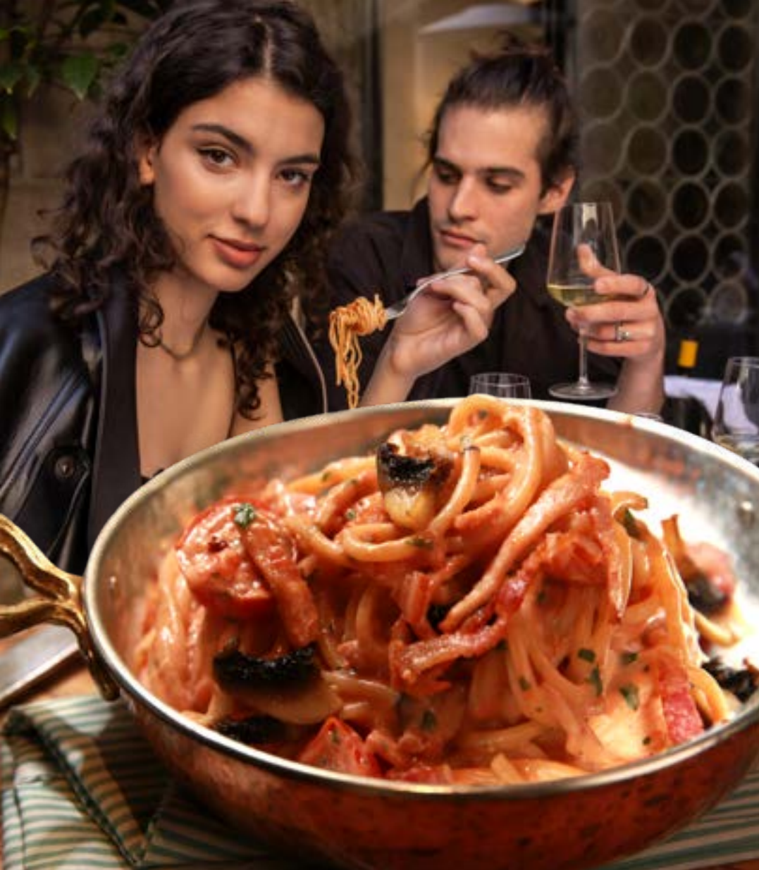
ПАСТА МАРИЯ бекон, ветчина, грибы, помидоры черри, сливочно-томатный соус 375₽