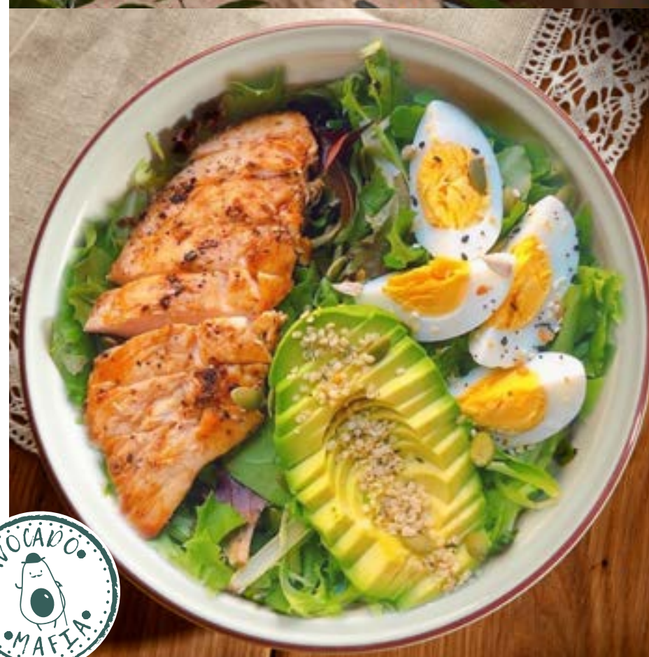
ЗЕЛЁНЫЙ САЛАТ С КУРИЦЕЙ, АВОКАДО И КИНОА 395₽ курица на гриле, микс салатов, авокадо, яйца, киноа и заправка из масла авокадо