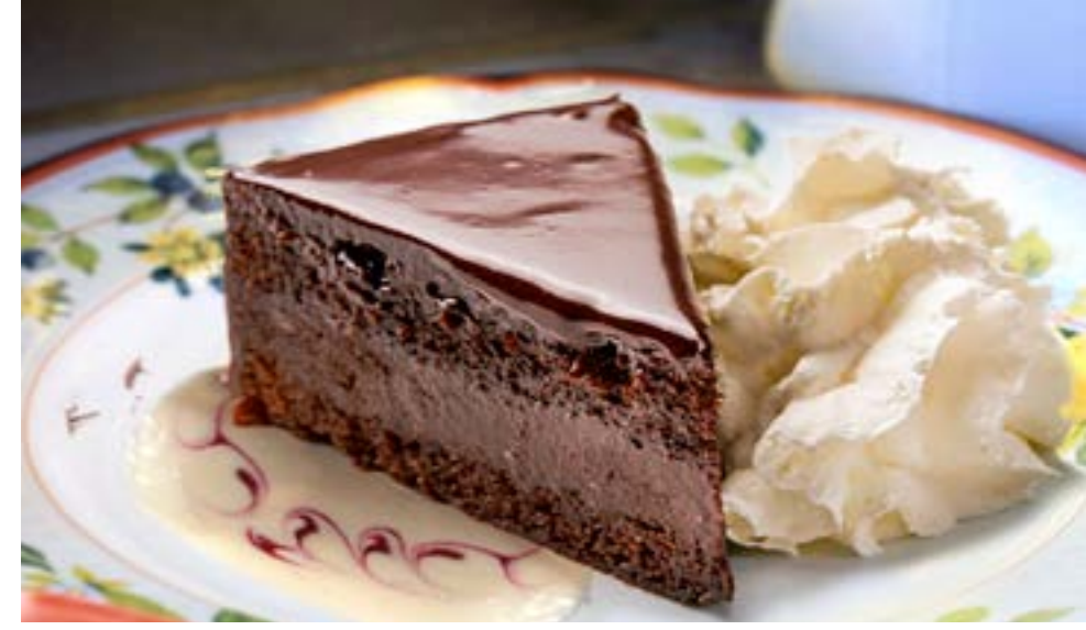
ЗАХЕР 315 р