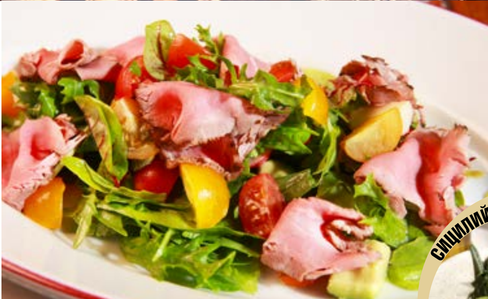
ЗЕЛЕНЬ МИКС САЛАТ С НЕЖНЫМ ТЕПЛЫМ РОСТБИФОМ черри и соусом Вителло Тоннато 435₹