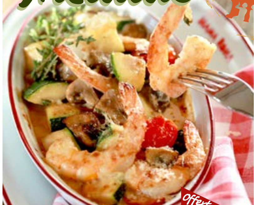
ГАМБЕРЕТТИ АЛЬ ФОРНО запеченные тигровые креветки в сливочном соусе с пармезаном, цукини и грибами 435₹