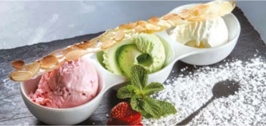
МОРОЖЕНОЕ «ТРЕ АМИЧИ» 275 р