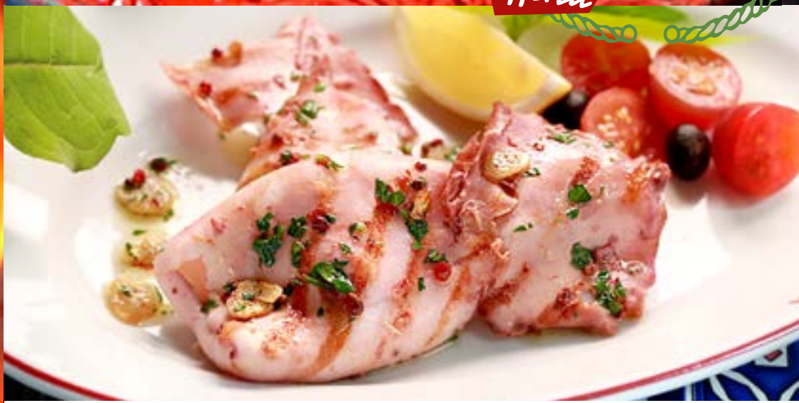
КАЛЬМАРЫ НА ГРИЛЕ в ароматном масле

РЫБНОЕ АССОРТИ МАМА РОМА лосось на гриле, тигровые креветки гриль, кольца кальмара и филе судака фри offerta 795р