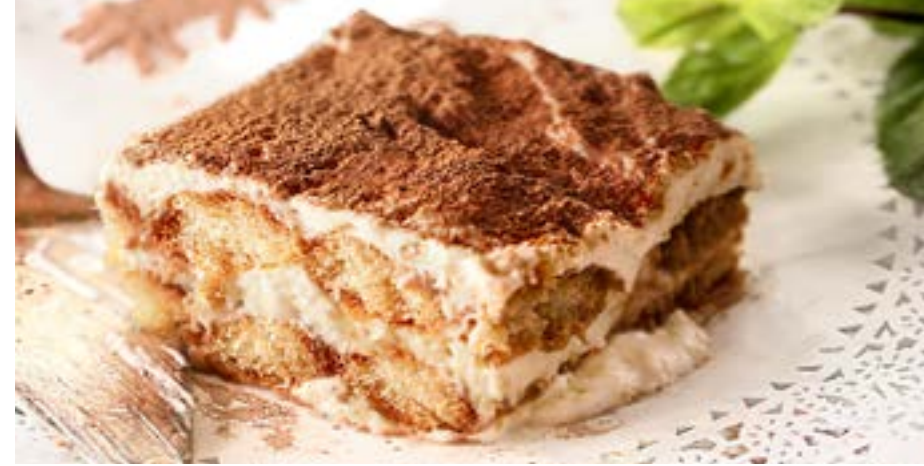
ТИРАМИСУ 255 р