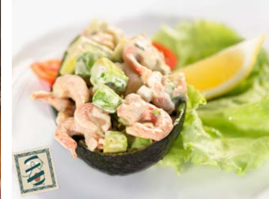
АВОКАДО С КРЕВЕТКАМИ 410₽