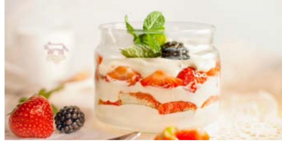
КЛУБНИЧНОЕ ТИРАМИСУ с нежным маскарпоне 320 р