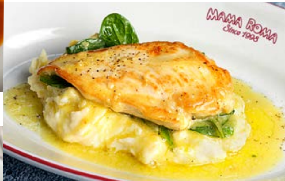
КУРИНОЕ ФИЛЕ С КАРТОФЕЛЬНЫМ ПЮРЕ шпинатом и соусом Бёрблан