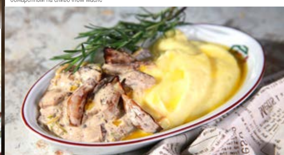
КАРТОФЕЛЬНОЕ ПЮРЕ 180₹ КАРТОФЕЛЬНОЕ ПЮРЕ С ЖУЛЬЕНОМ ИЗ БЕЛЫХ ГРИБОВ 325₹