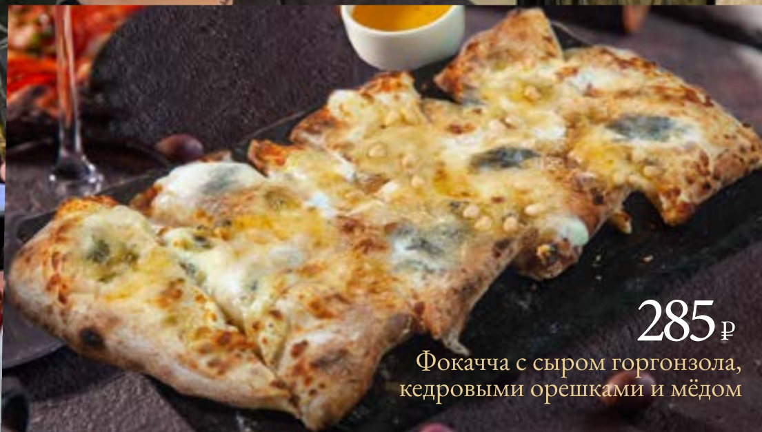
285 ₺ Фокачча с сыром горгонзола, кедровыми орешками и мёдом