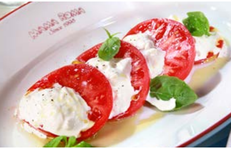
КАПРЕЗЕ нежная страчателла с бакинскими помидорами, оливковым маслом Extra Virgin и базиликом 395₹