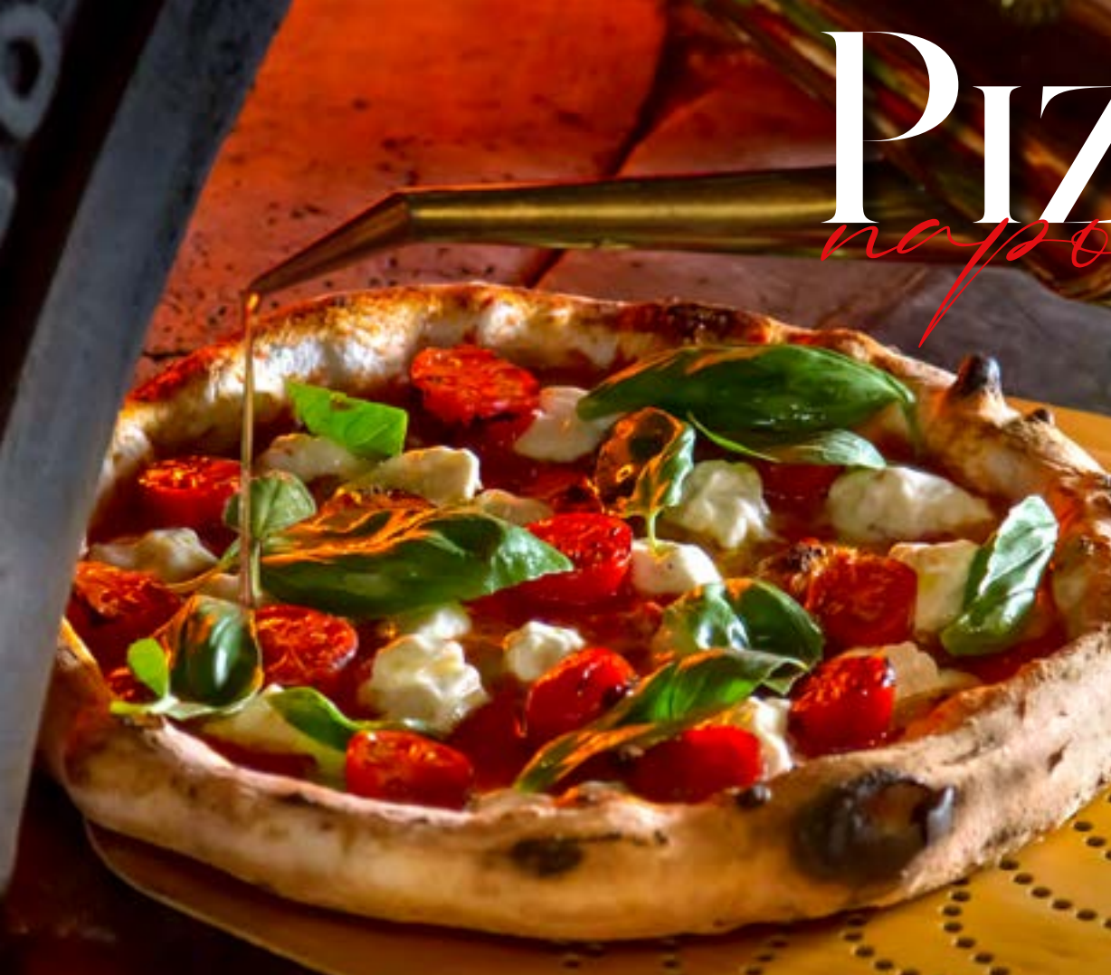
ТРИКОЛОРЕ моцарелла, базилик, помидоры черри, томатный соус