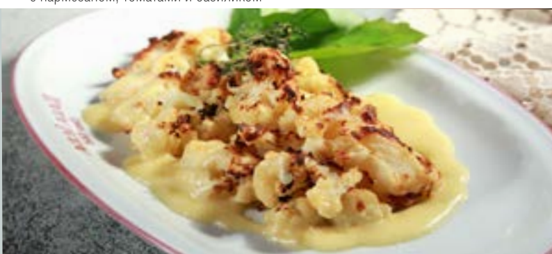
ЗАПЕЧЕННАЯ ЦВЕТНАЯ КАПУСТА 255₹ под сливочно-сырным соусом