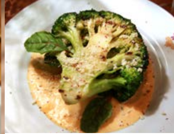
БРОККОЛИ НА ГРИЛЕ 295₹ в сливочном соусе с сыром, кукурузой и чили