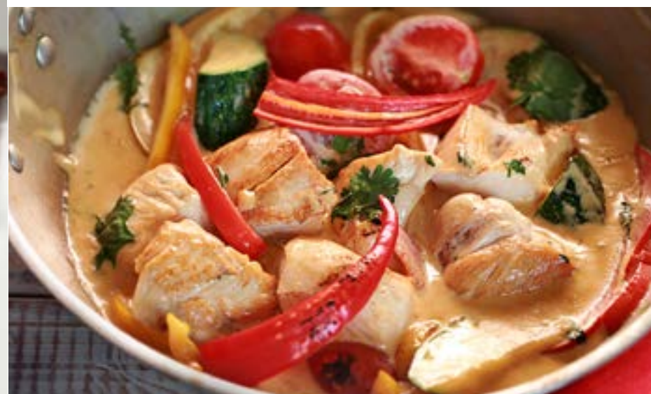
ПОЛЛО АЛЬ ФОРНО куриное филе в сливочном соусе с цукини, сладким перцем и кинзой