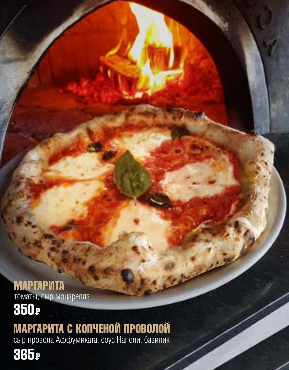
МАРГАРИТА томаты, сыр моцарелла 350 р