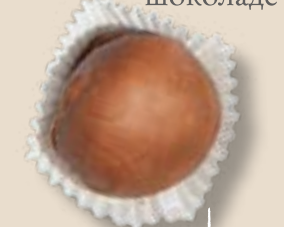
Грильяж с кедровым орехом