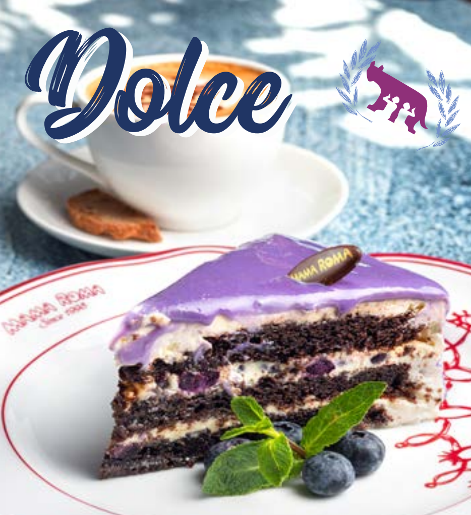
ЧЕРЁМУХОВЫЙ ТОРТ 285 р