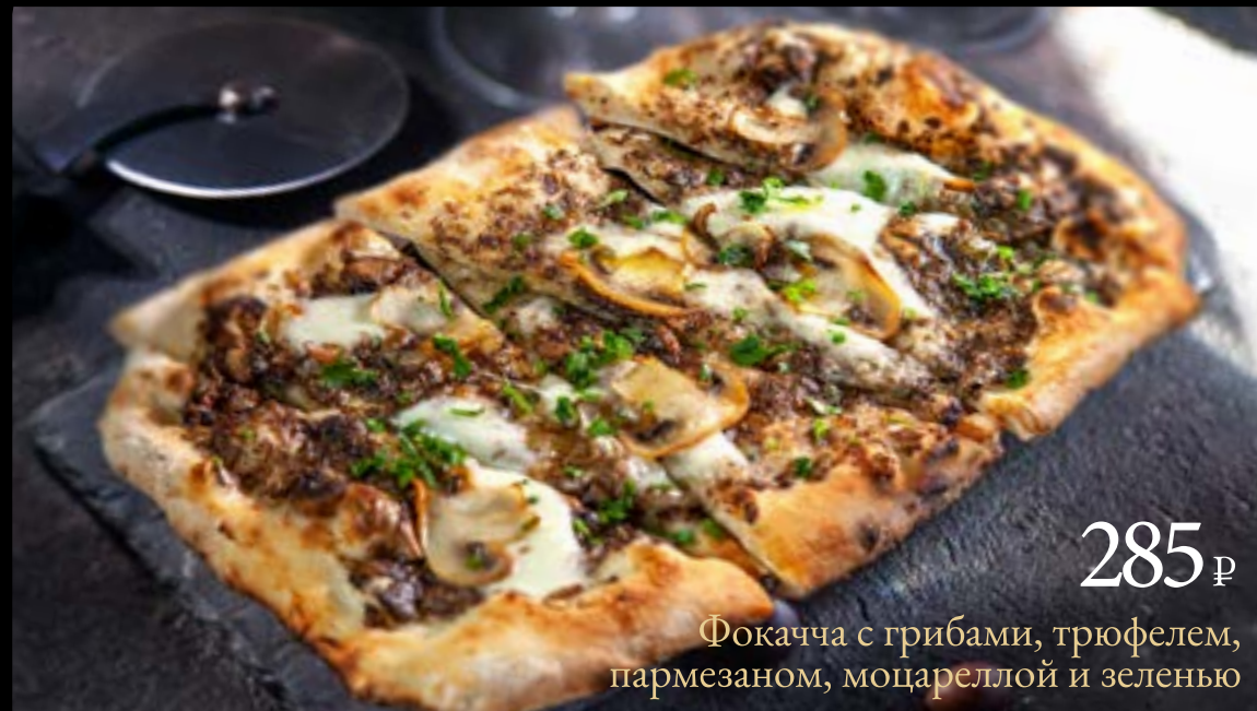
285 ₺ Фокачча с грибами, трюфелем, пармезаном, моцареллой и зеленью