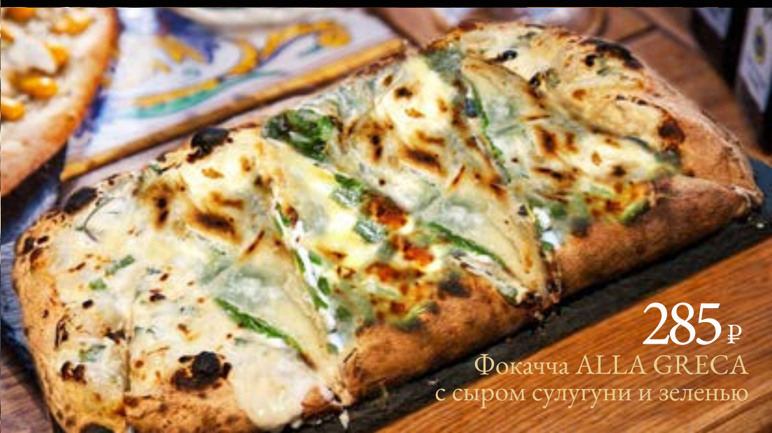
285 ₺ Фокачча ALLA GRECA с сыром сулугуни и зеленью