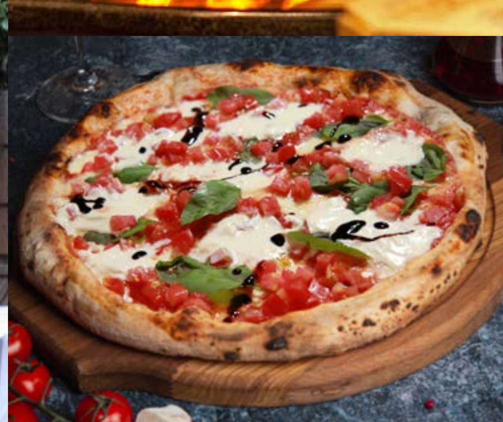
ПИЦЦА С НЕЖНОЙ СТРАЧАТЕЛЛОЙ И ТОМАТАМИ базиликом и бальзамическим соусом Modena 395 р