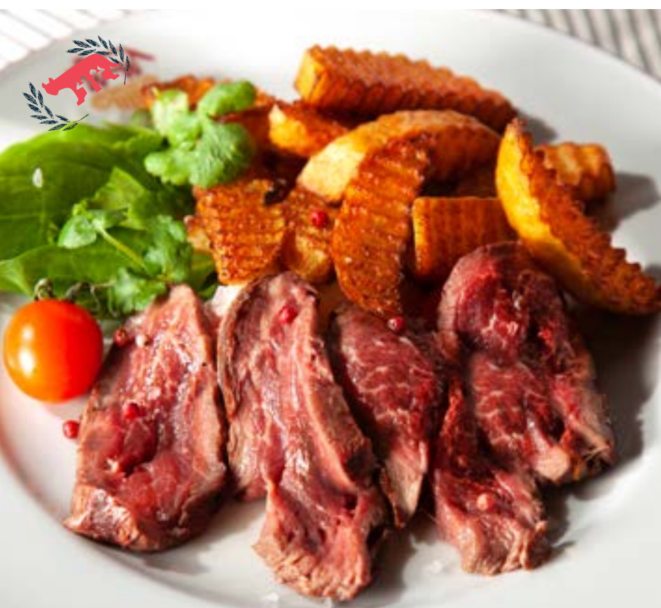
ТАЛЬЯТА ИЗ ГОВЯДИНЫ с домашним картофелем фри и свежим шпинатом