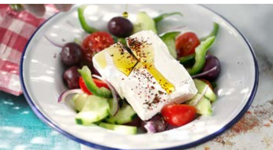
ГРЕЧЕСКИЙ САЛАТ 375₽ сладкий перец, огурцы, помидоры черри, красный лук, сицилийские бурые оливки, сыр фета, оливковое масло