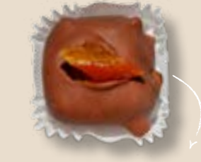
Молочный шоколад с абрикосом