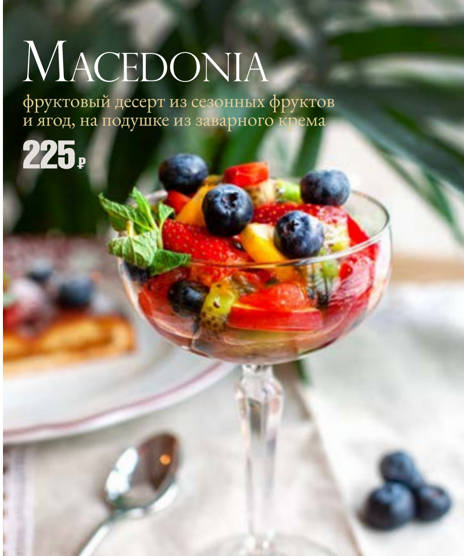
MACEDONIA фруктовый десерт из сезонных фруктов и ягод, на подушке из заварного крема 225₺