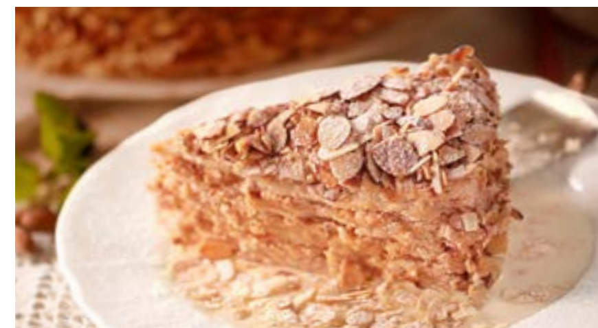
МИНДАЛЬНЫЙ ТОРТ 325 р