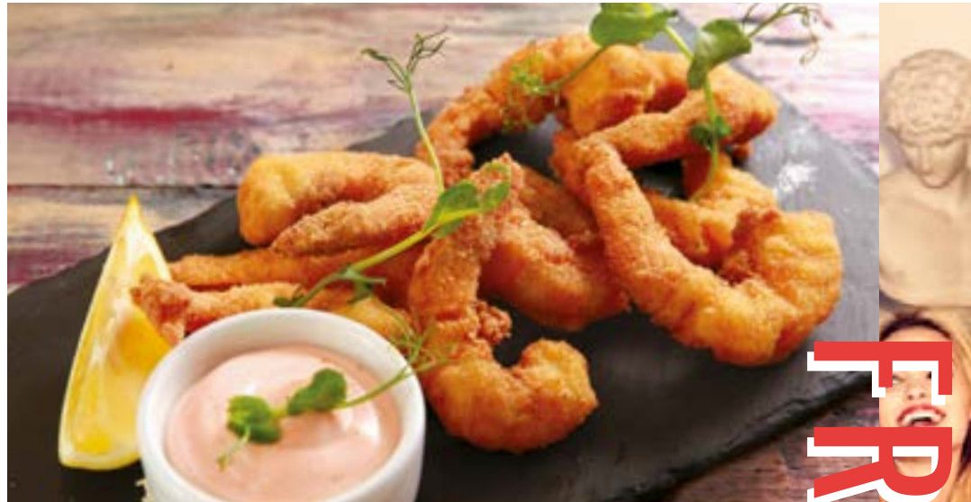
ГАМБЕРО ФРИТТО 485₹ тигровые креветки в панировке с соусом Капри