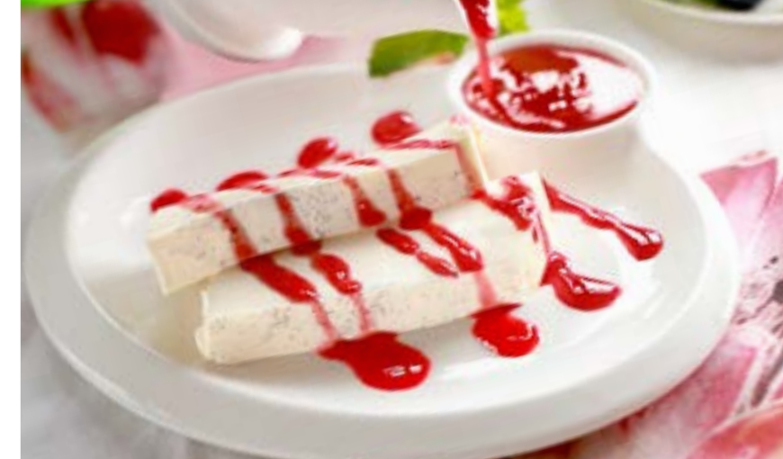
ПАННА КОТТА 275 р