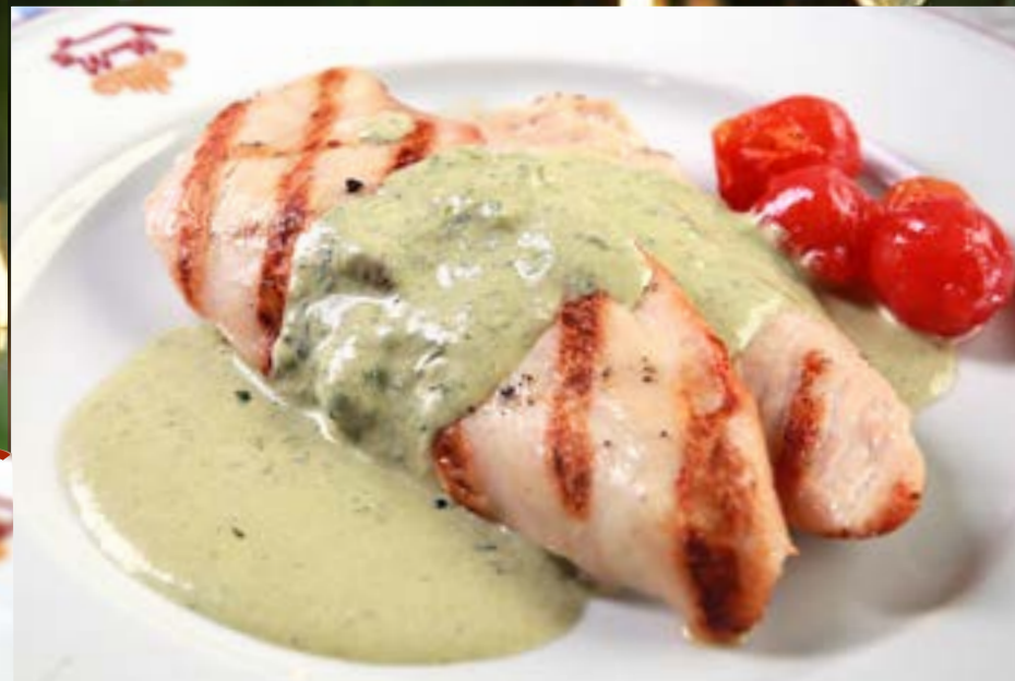
КУРИНОЕ ФИЛЕ НА ГРИЛЕ с сыром горгонзола в соусе Песто