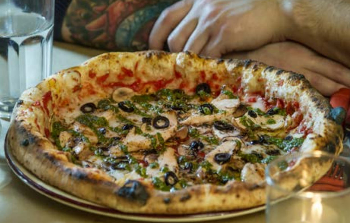
ПОЛЛО ПЕСТО куриное филе, соус Песто, грибы, черные оливки, томаты, сыр моцарелла