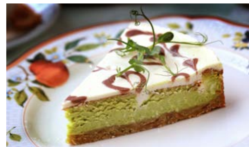
ФИСТАШКОВЫЙ ЧИЗКЕЙК 315 р