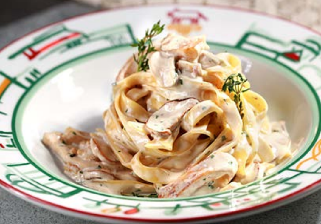
ТАЛЬЯТЕЛЛЕ С КУРИНЫМ ФИЛЕ лесными грибами в сливочном соусе 385₽