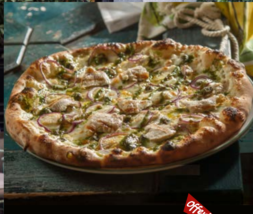
ЦЕЗАРЬ курица, соус Песто, соус Цезарь, каперсы, лук красный 465 р