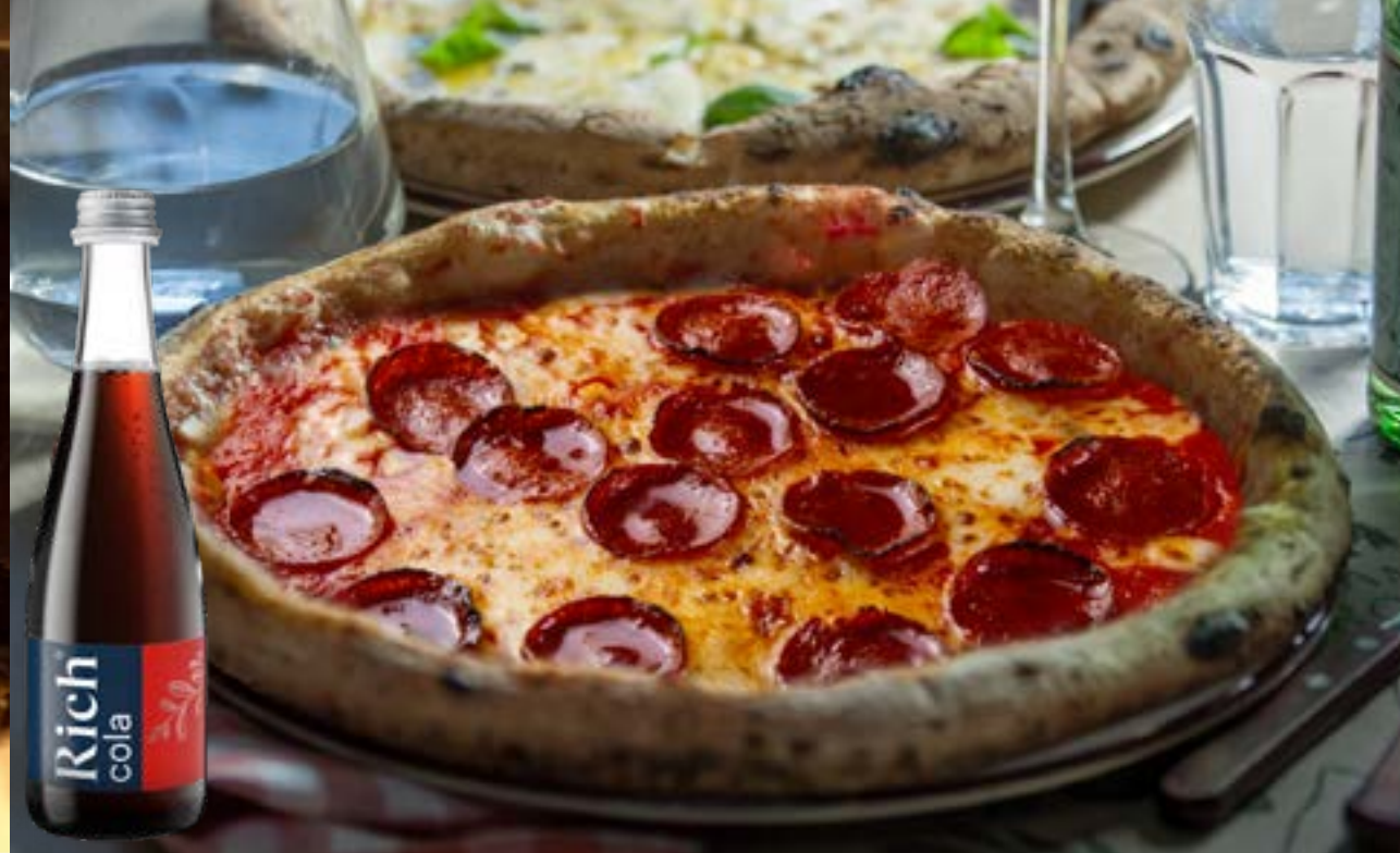
ПЕППЕРОНИ салами, томаты, сыр моцарелла