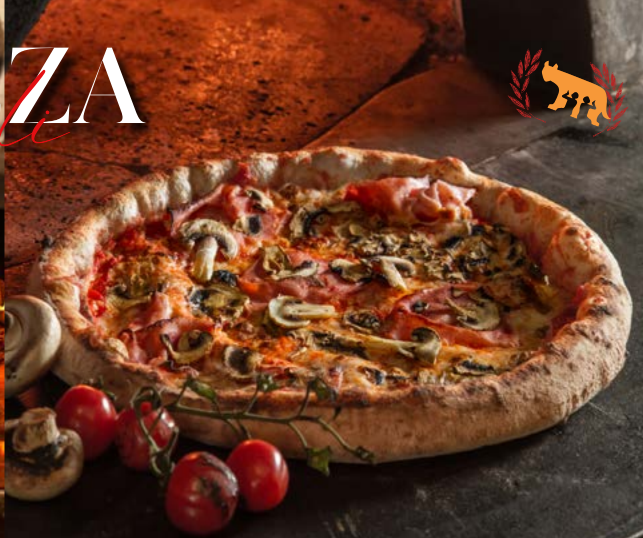
ПРОШУТТО ФУНГИ ветчина, грибы, томаты, сыр моцарелла