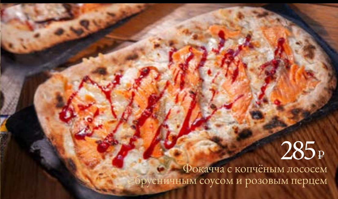
285 ₺ Фокачча с копчёным лососем и брусничным соусом и розовым перцем