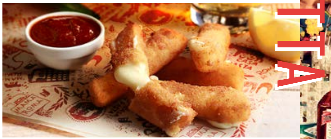
НЕЖНАЯ МОЦАРЕЛЛА В ХРУСТЯЩЕЙ КОРОЧКЕ с соусом Mama Roma 325₹