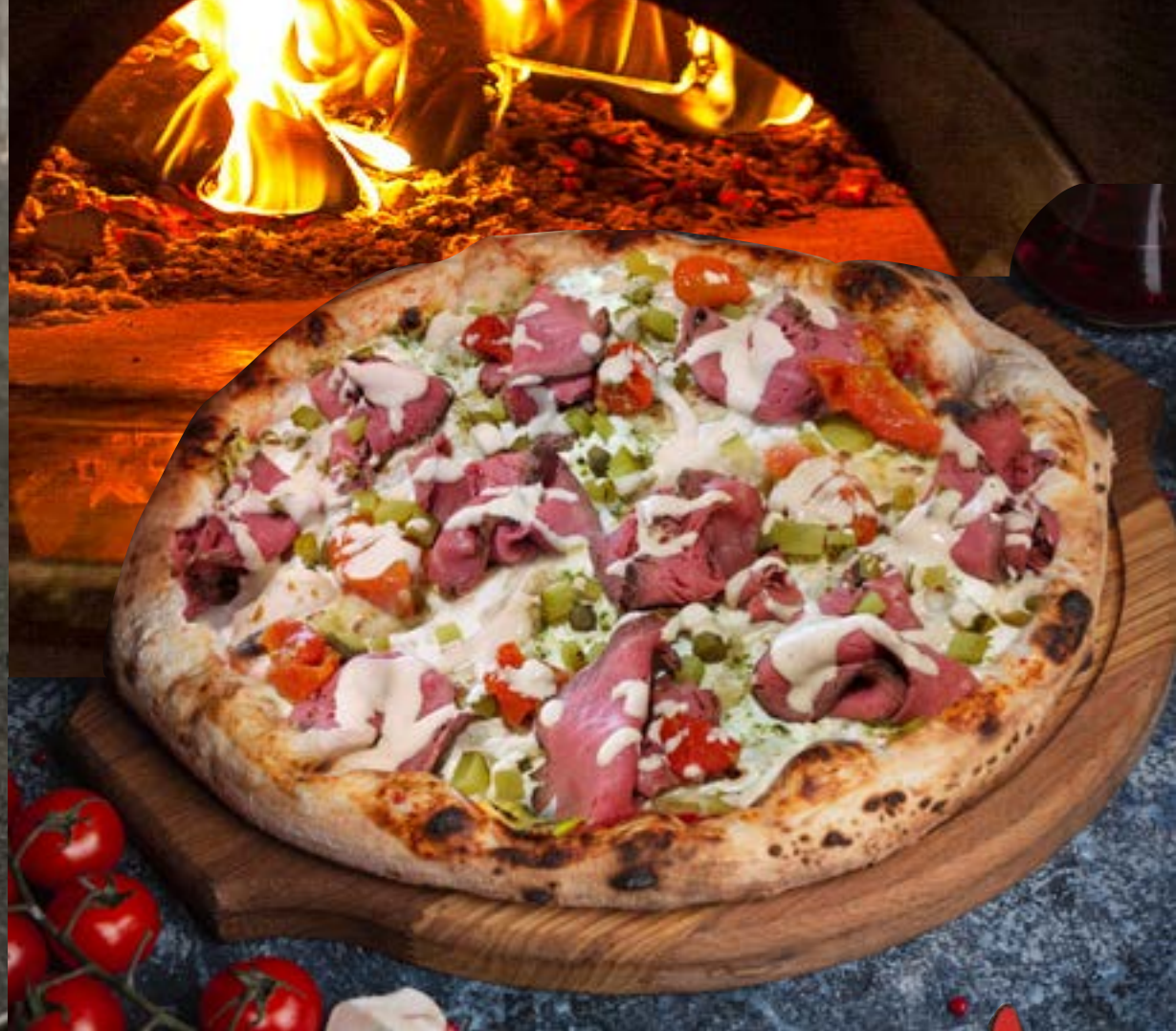
ПИЦЦА С НЕЖНЫМ РОСТБИФОМ СУ-ВИД с черри, маринованными огурчиками и соусом Вителло Тоннато