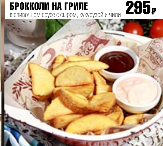
RATATE DI CASA 195₹ картофель по-деревенски с двумя соусами