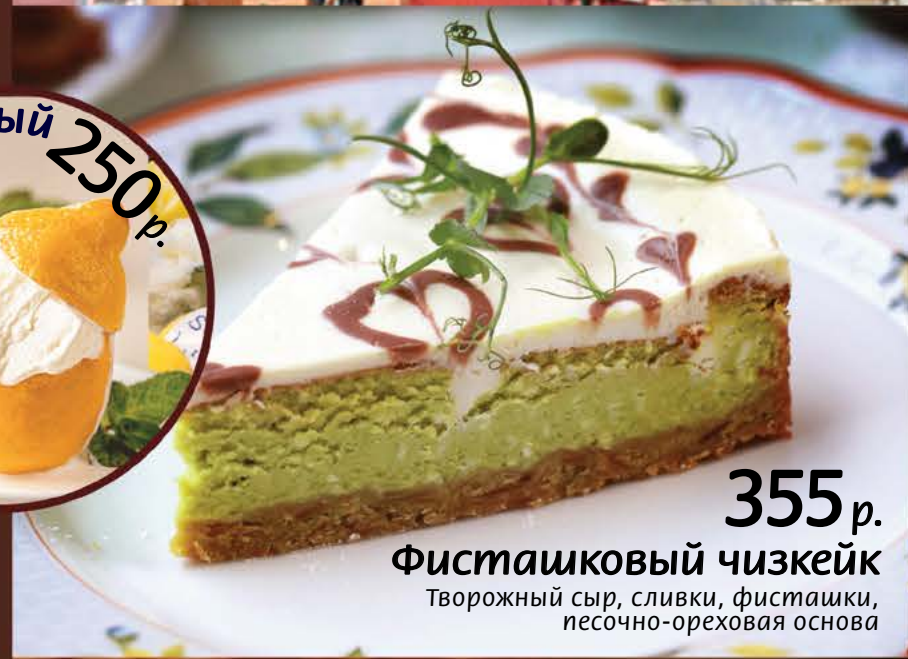
355 р. Фисташковый чизкейк Творожный сыр, сливки, фисташки, песочно-ореховая основа