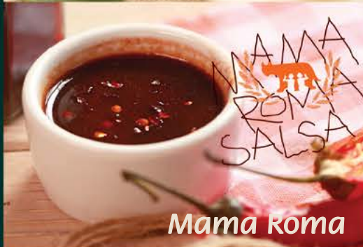
Mama Roma Salsa