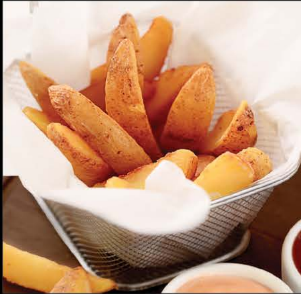
Patate di casa 190 р. картофель по-деревенски с двумя соусами