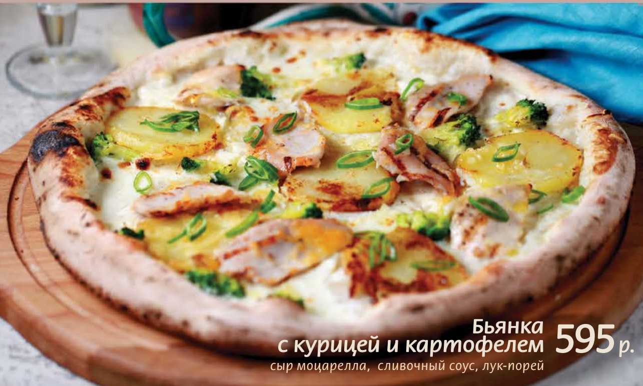
Бьянка 595 р. с курицей и картофелем сыр моцарелла, сливочный соус, лук-порей