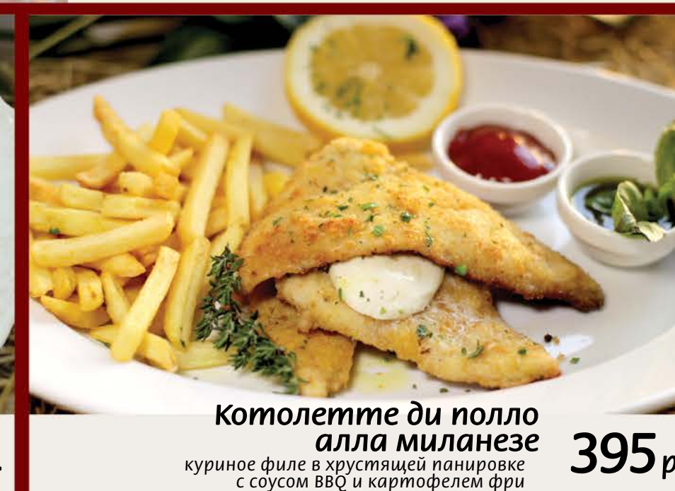
Котолетте ди полло алла миланезе 395 р. куриное филе в хрустящей панировке с соусом BBQ и картофелем фри