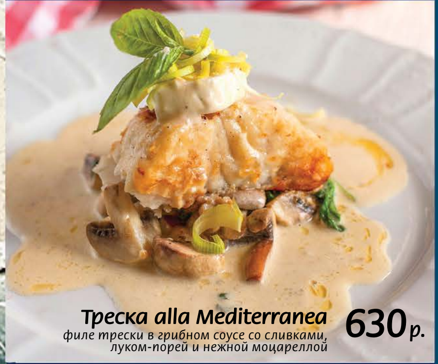
Треска alla Mediterranea 630 р. филе трески в грибном соусе со сливками, луком-порей и нежной моцареллой