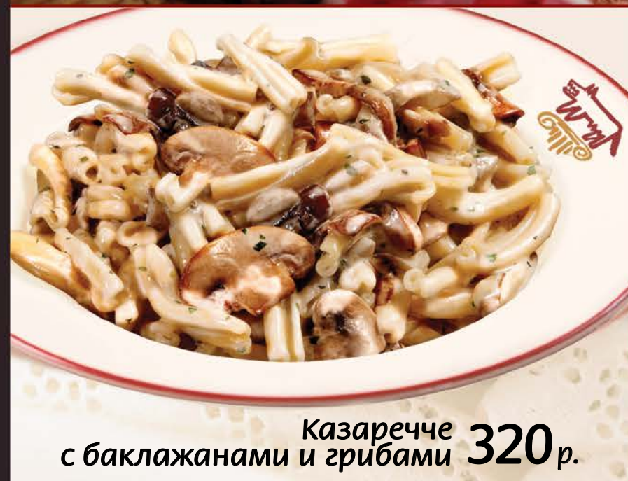
Казаречче с баклажанами и грибами 320 р.