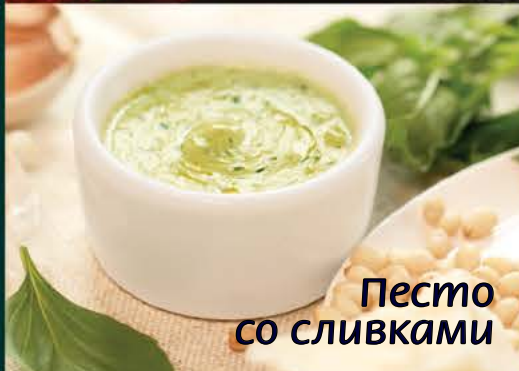
Песто со сливками