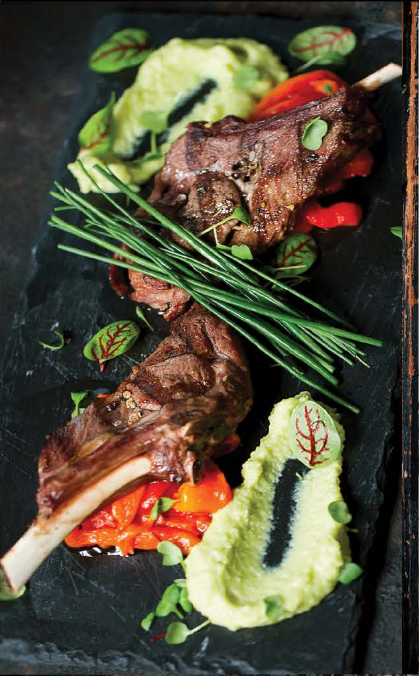
Баранина гриль котлетки из баранины с печеным перцем и пюре из зеленого горошка 1180 р.