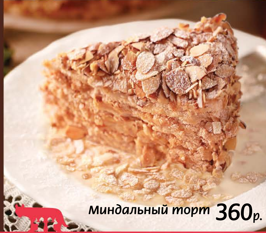
360 р. Миндальный торт