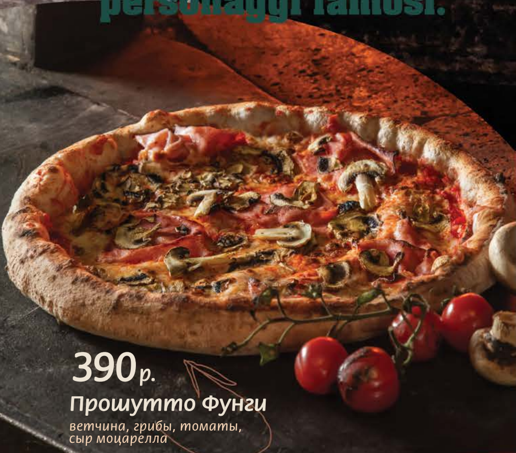
390 р. Прошутто Фунги ветчина, грибы, томаты, сыр моцарелла