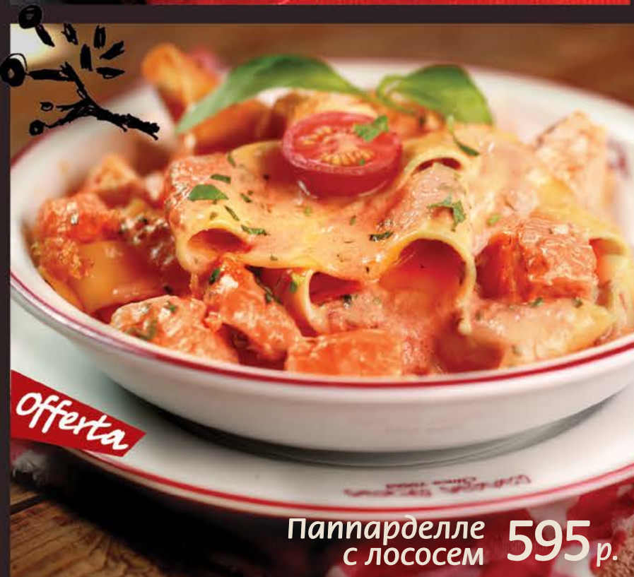
Паппарделле с лососем 595 р.