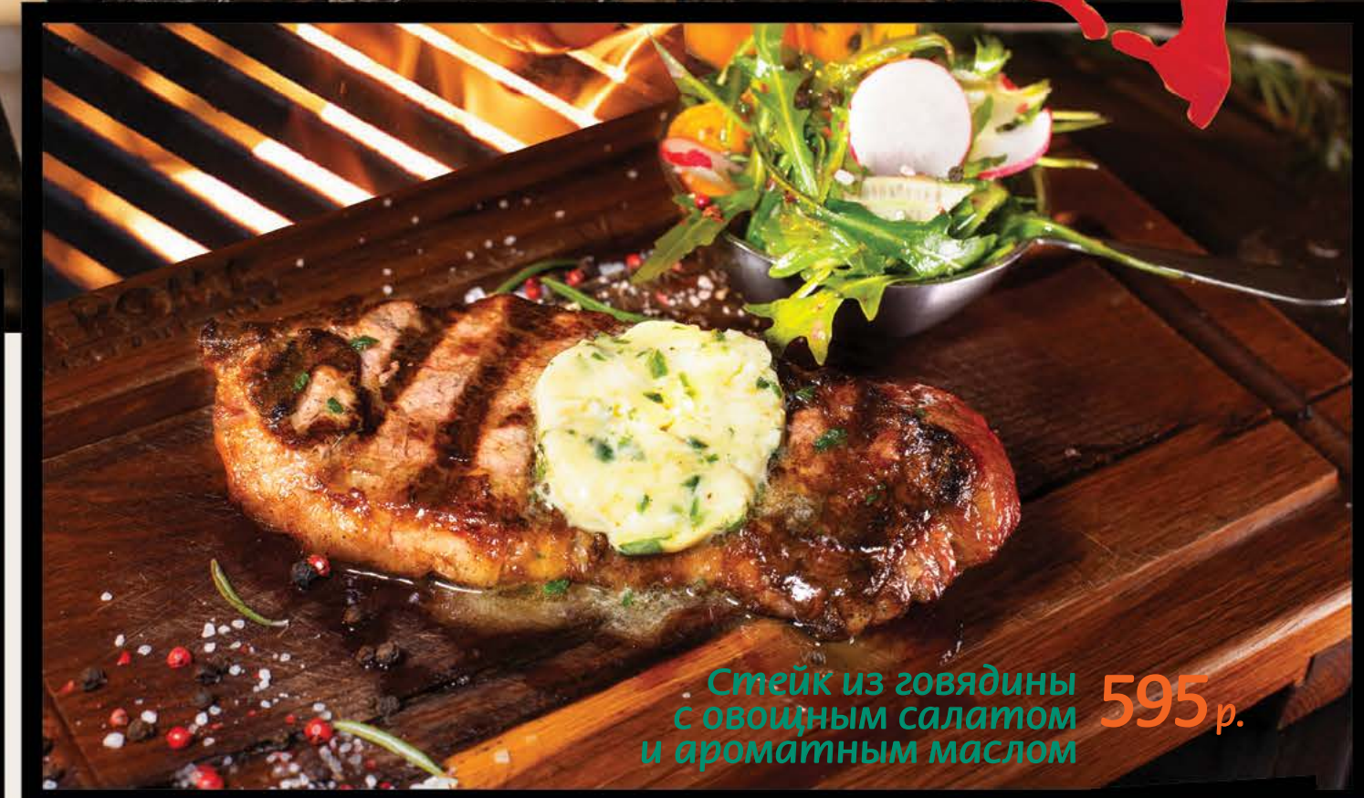
Стейк из говядины с овощным салатом и ароматным маслом 595 р.