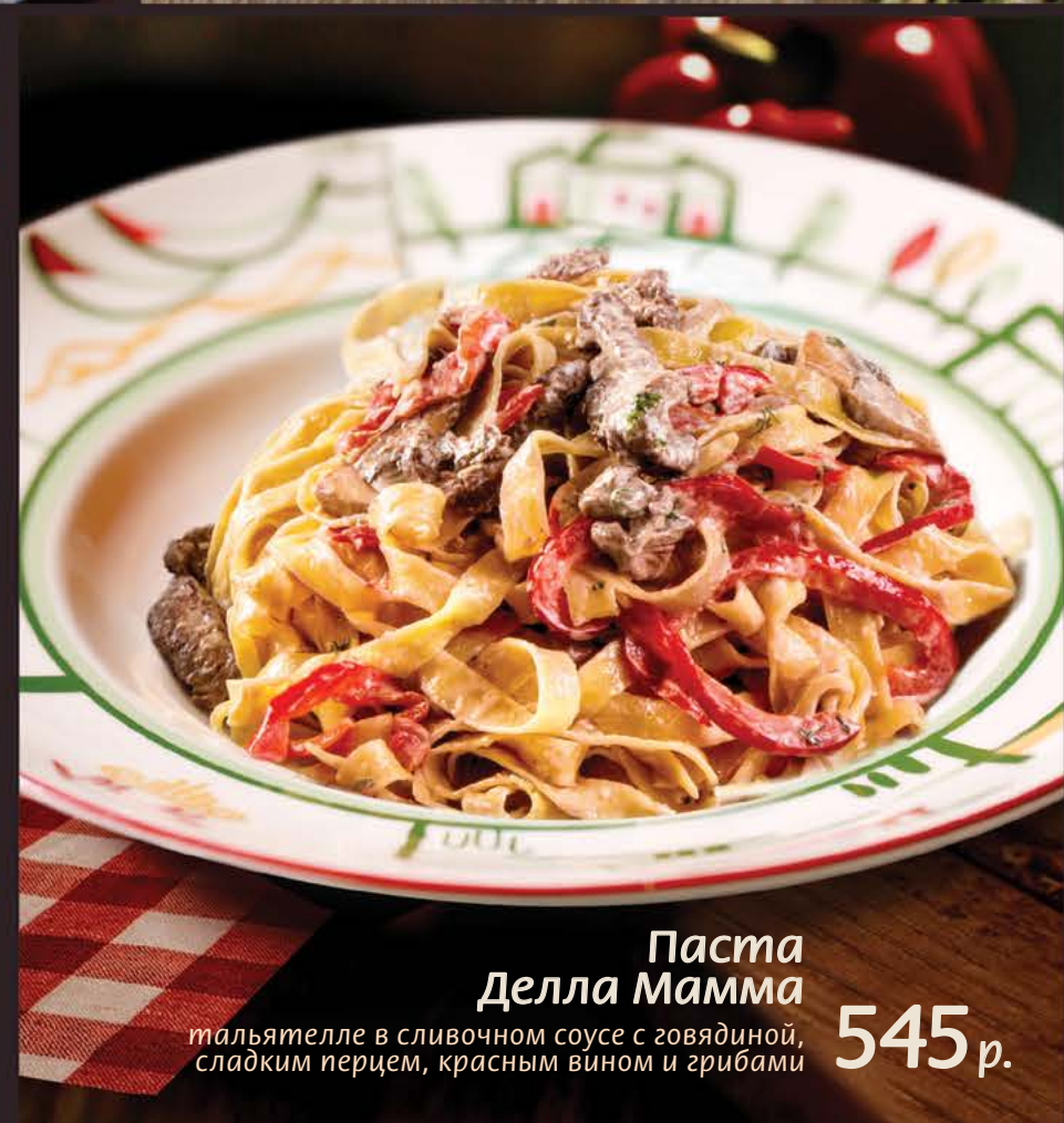
Паста Делла Мамма 545 р. тальянелле в сливочном соусе с говядиной, сладким перцем, красным вином и грибами