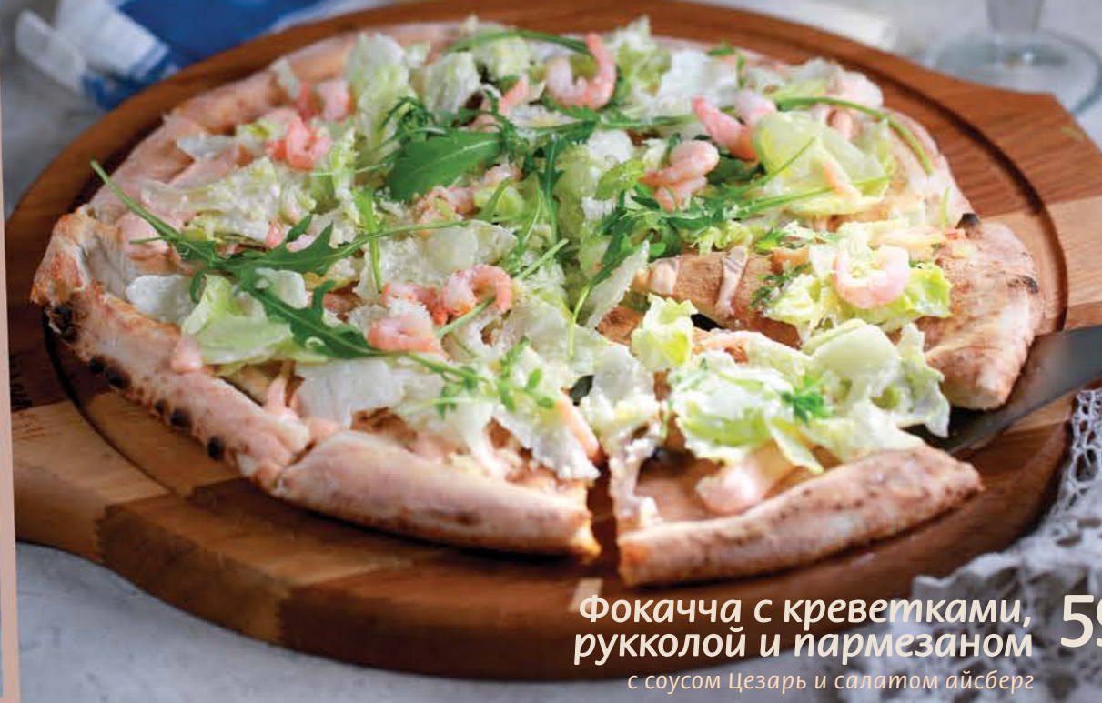
Фокачча с креветками, рукколой и пармезаном 595 р. с соусом Цезарь и салатом айсберг