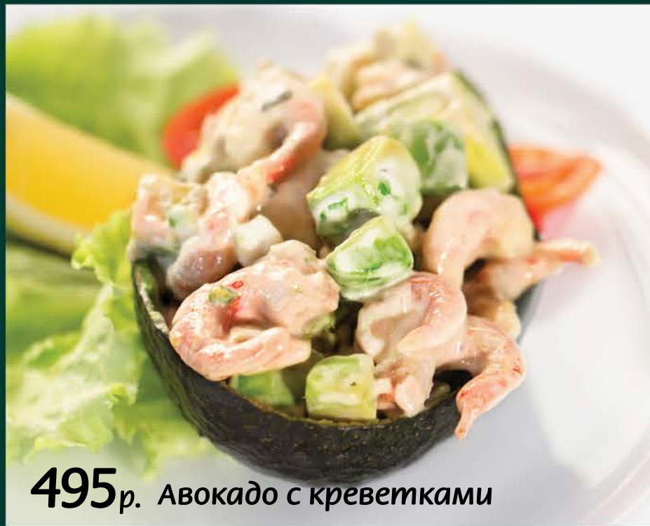
495 р. Авокадо с креветками