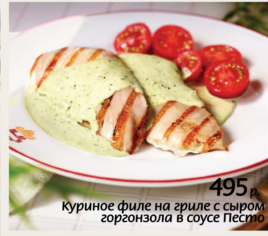
495 р. Куриное филе на гриле с сыром горгонзола в соусе Песто