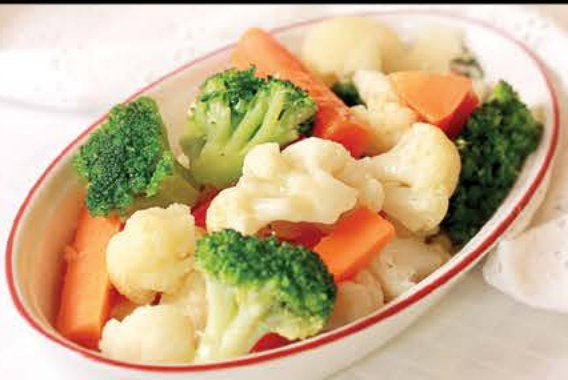
Овощи на пару 155 р.