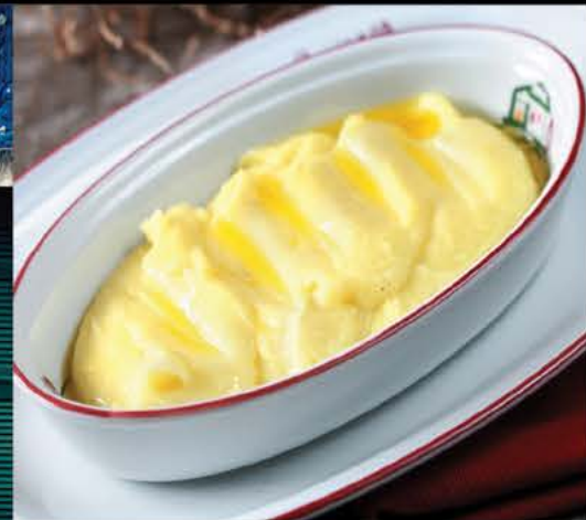
Картофельное пюре 145 р.