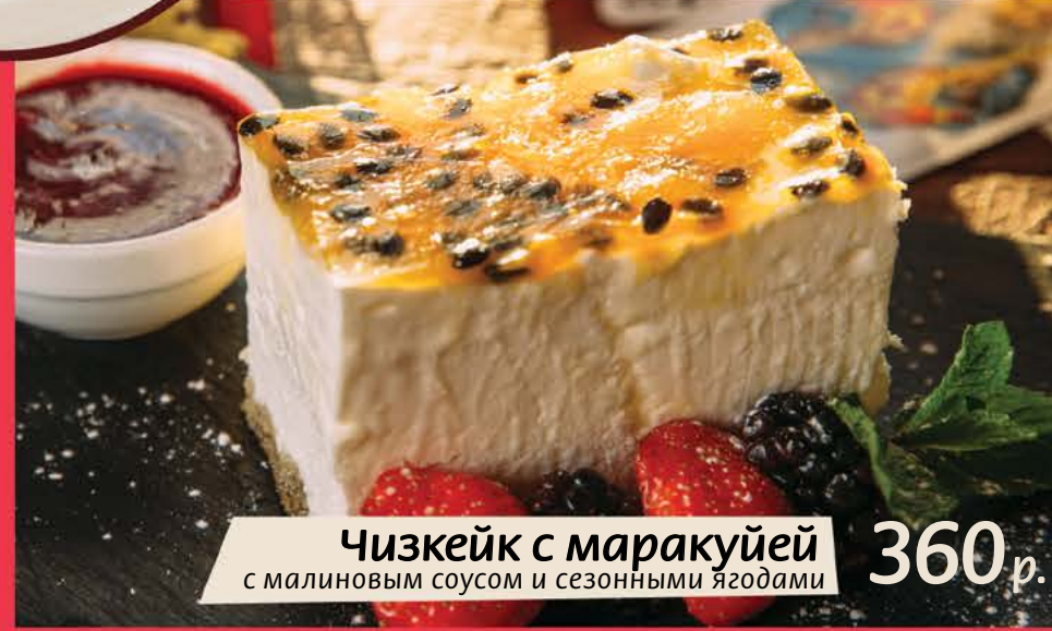
360 р. Чизкейк с маракуйей с малиновым соусом и сезонными ягодами