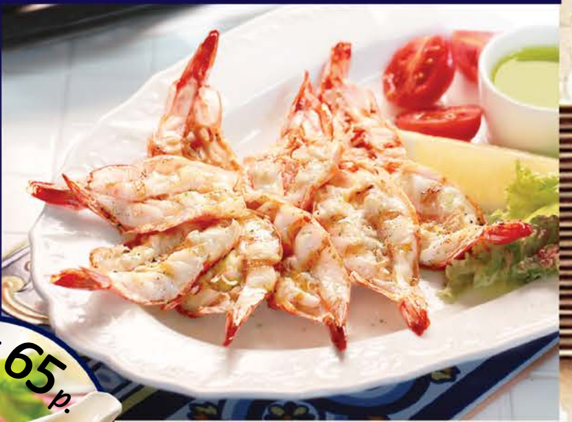
Тигровые креветки 725 р.