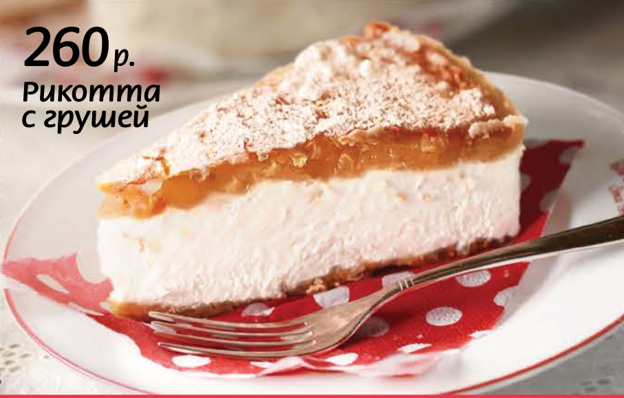
260 р. Рикотта с грушей