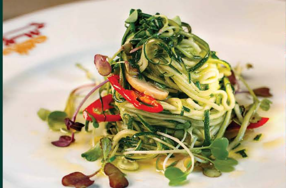
250 р. Салат из цукини цукини, шампиньоны, оливковое масло, перец чили