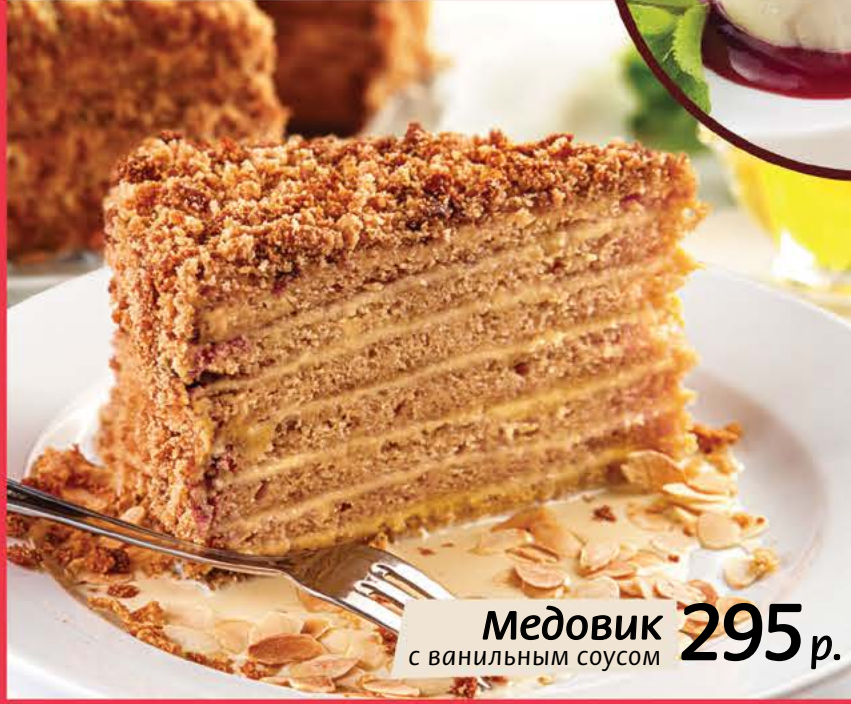
295 р. Медовик с ванильным соусом