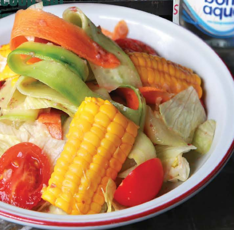
280 р. Insalata Fresca салат из свежих овощей с оливковым маслом Extra Virgin