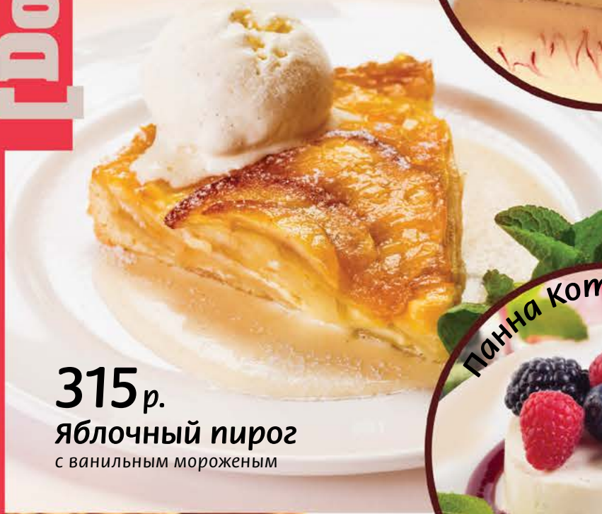
315 р. яблочный пирог с ванильным мороженым