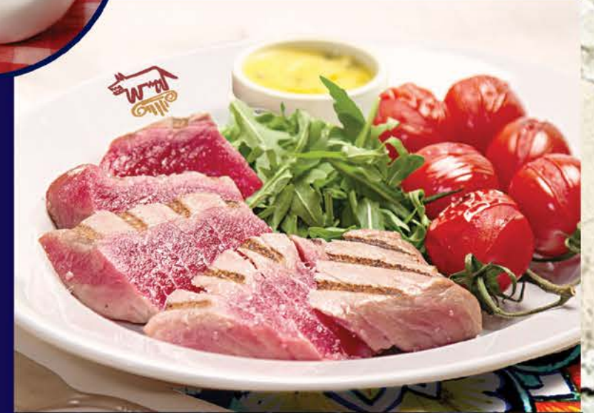
Филе розового тунца на гриле по-сицилийски 795 р.