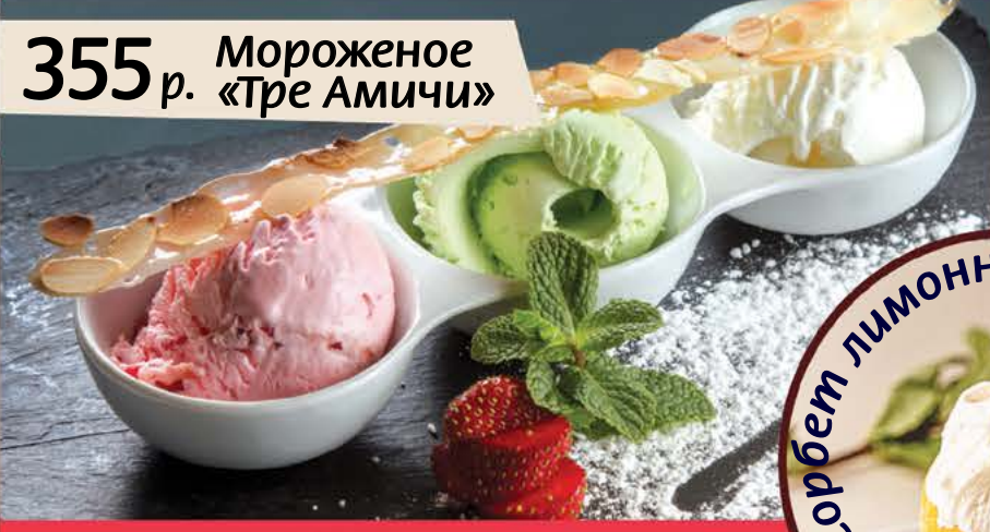
355 р. Мороженое «Тре Амичи»