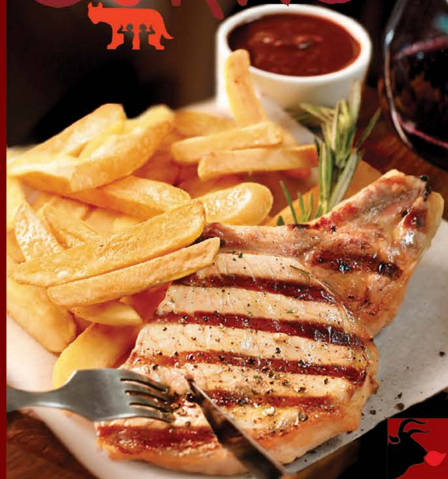
Сочный стейк из свинины с картофелем и розмарином 525 р.