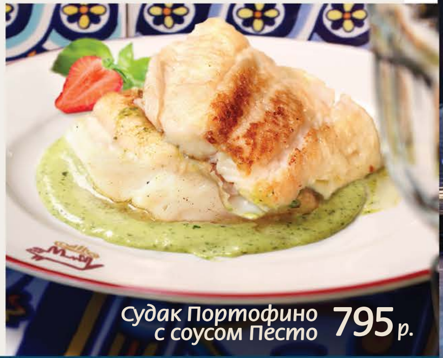
Судак Портофино 795 р. с соусом Песто