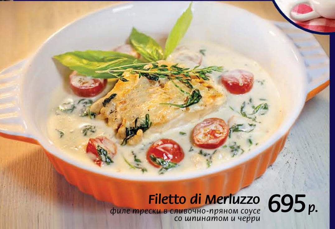
Filetto di Merluzzo 695 р. филе трески в сливочно-пряном соусе со шпинатом и черри