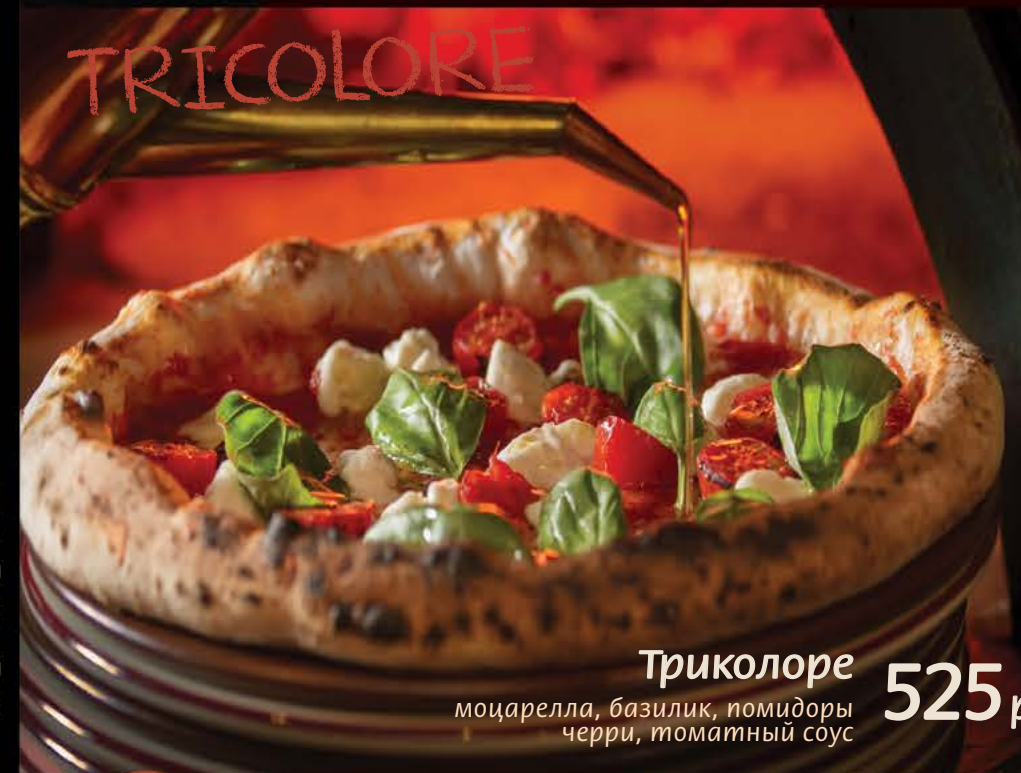
525 р. Триколоре моцарелла, базилик, помидоры черри, томатный соус