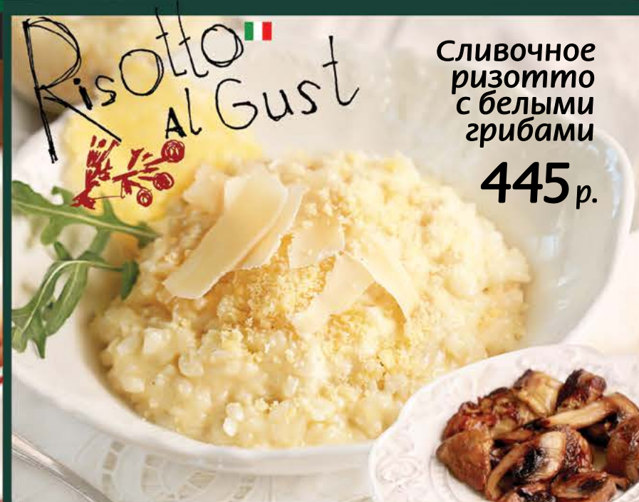
Сливочное ризотто с белыми грибами 445 р.