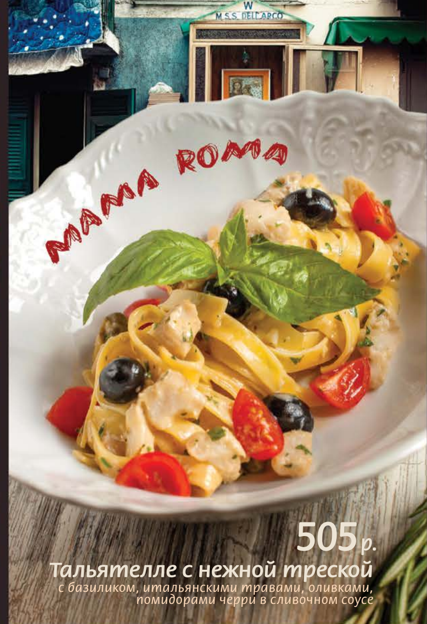
Тальятелле с нежной треской 505 р. с базиликом, итальянскими травами, оливками, помидорами черри в сливочном соусе