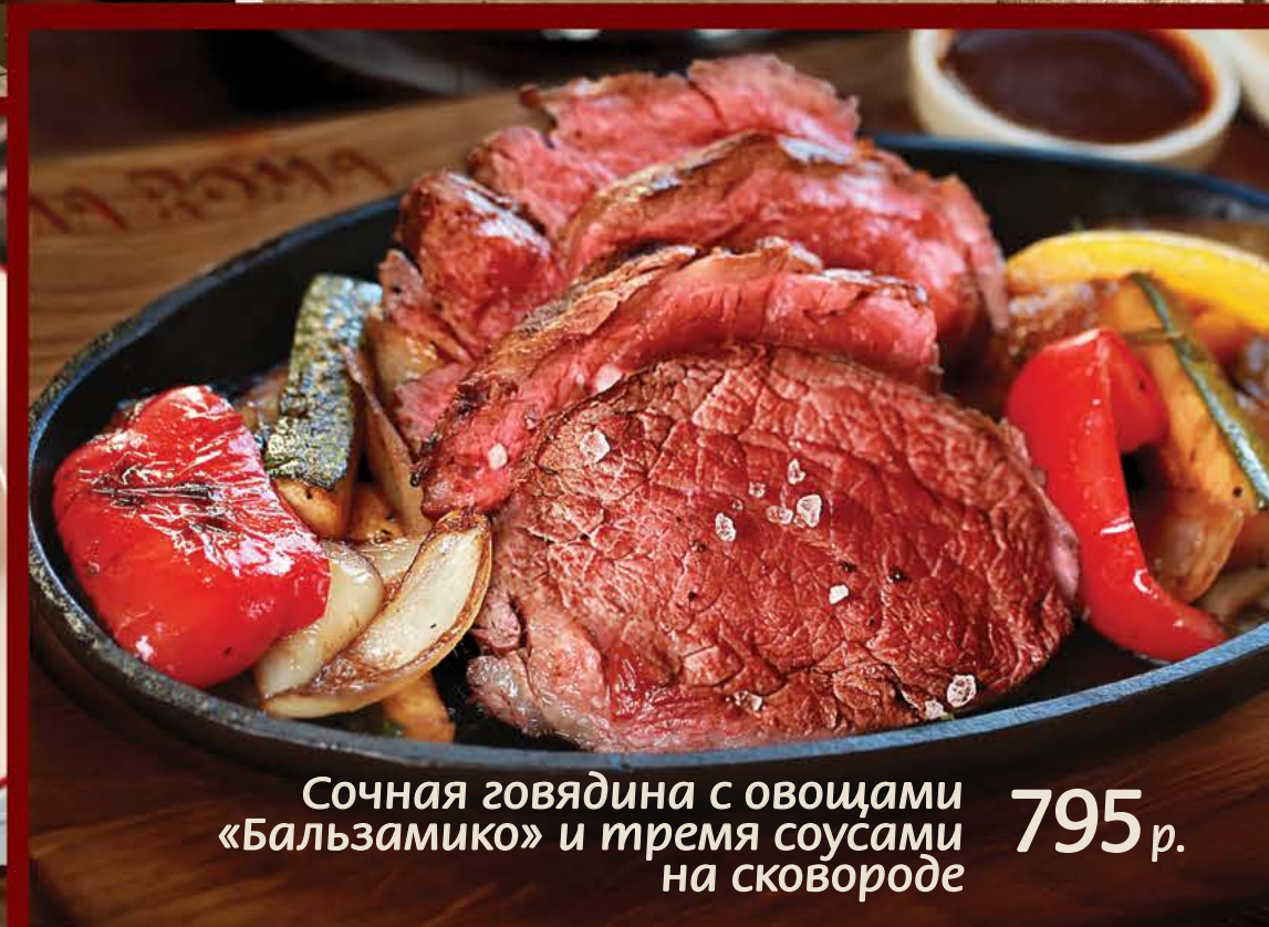
Сочная говядина с овощами «Бальзамико» и тремя соусами на сковороде 795 р.