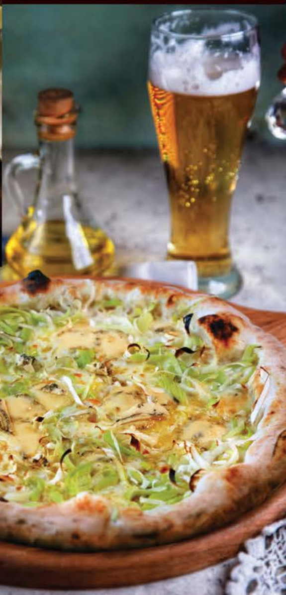
590 р. Бьянка с сыром горгонзола и луком-пореем