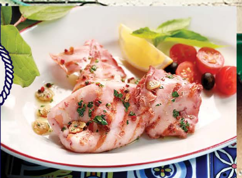
Кальмары на гриле в ароматном масле 375 р.