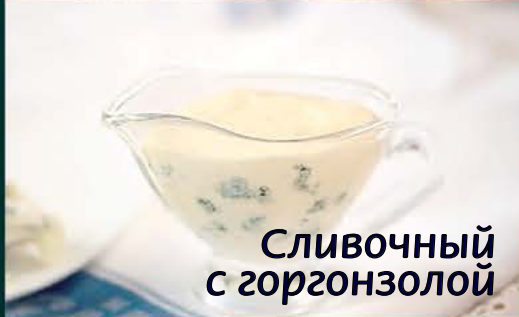
Сливочный с горгонзоллой