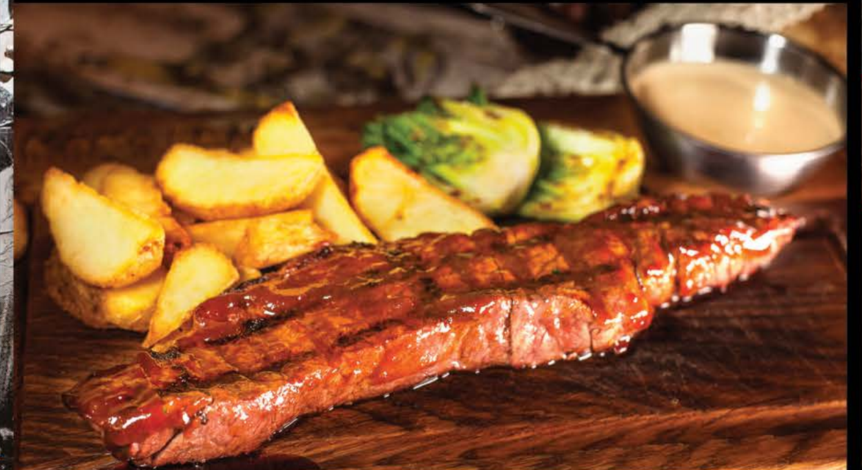
Стейк Денвер глазированный соусом BBQ с деревенским картофелем 1150 р.