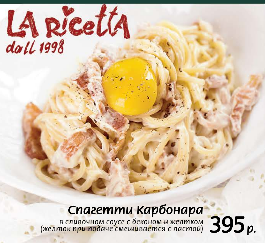
Спагетти Карбонара 395 р. в сливочном соусе с беконом и желтком (желток при подаче смешивается с пастой)