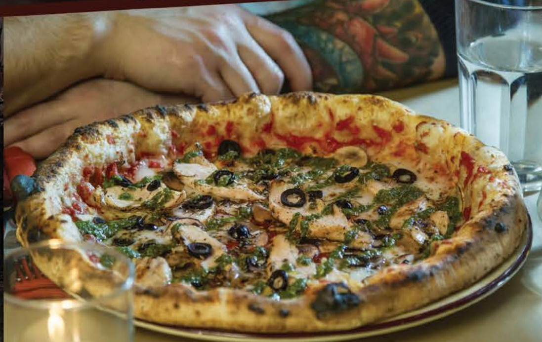
415 р. Полло Песто куриное филе, соус Песто, грибы, черные оливки, томаты, сыр моцарелла