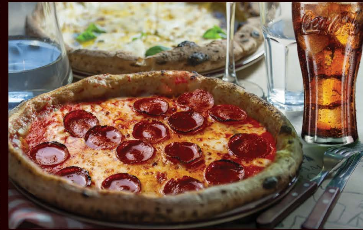
Пепперони 365 р. салями, томаты, сыр моцарелла