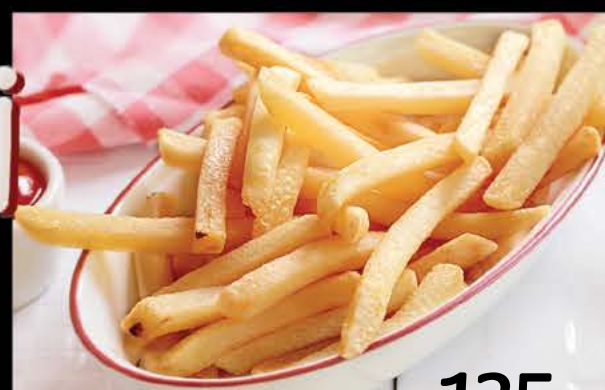
Картофель фри 135 р.