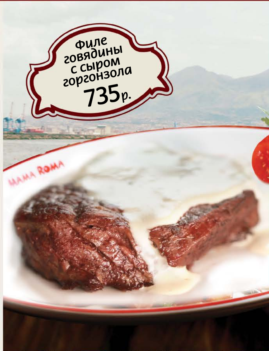
Филе говядины с сыром горгонзола 735 р.