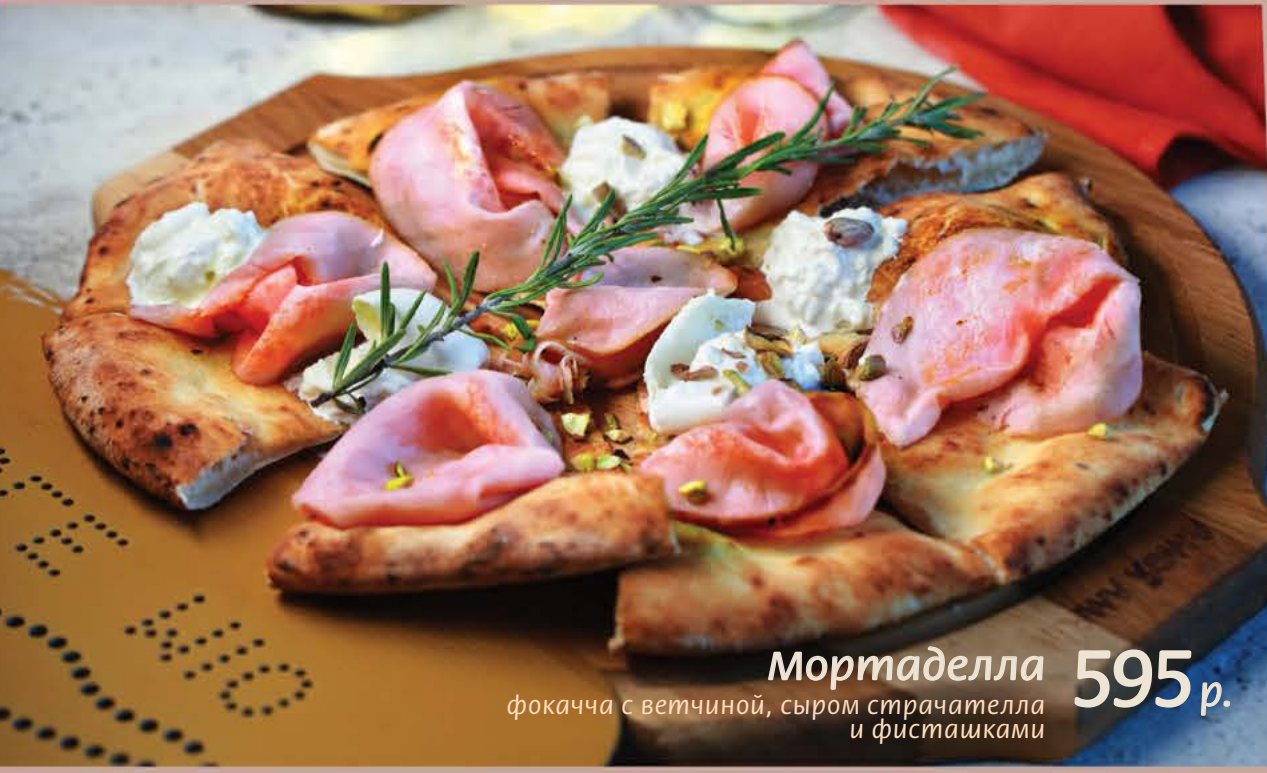
Мортаделла 595 р. фокачча с ветчиной, сыром страчателла и фисташками