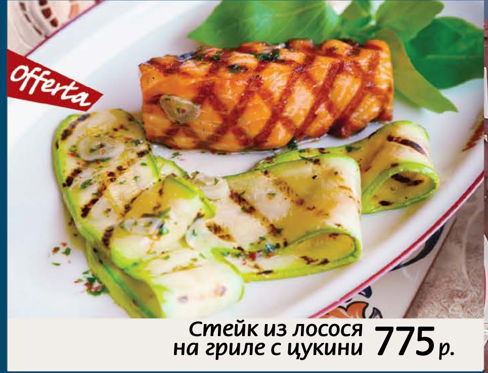
Стейк из лосося на гриле с цукини 775 р.