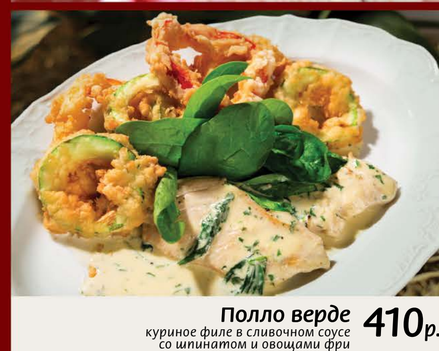
Полло верде 410 р. куриное филе в сливочном соусе со шпинатом и овощами фри