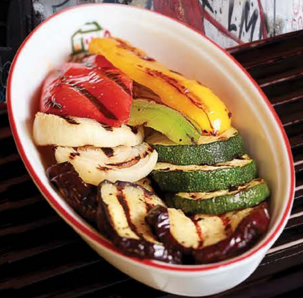
Овощи на гриле 265 р.