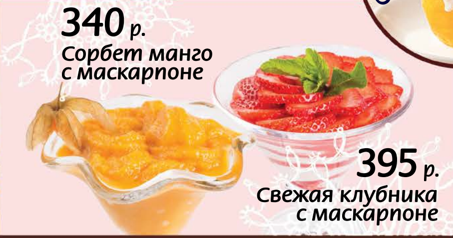
340 р. Сорбет манго с маскарпоне