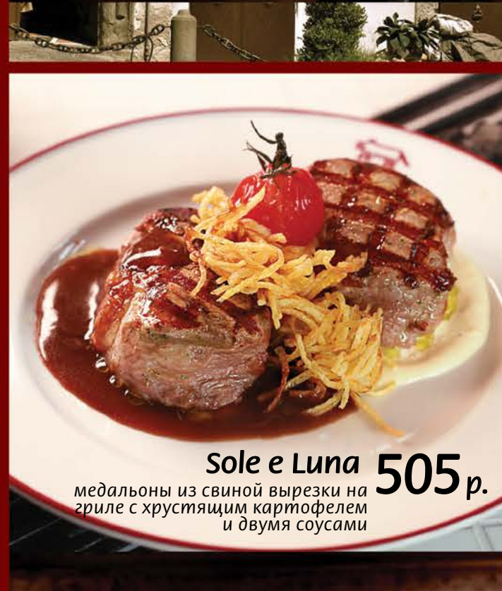
Sole e Luna 505 р. медальоны из свиной вырезки на гриле с хрустящим картофелем и двумя соусами