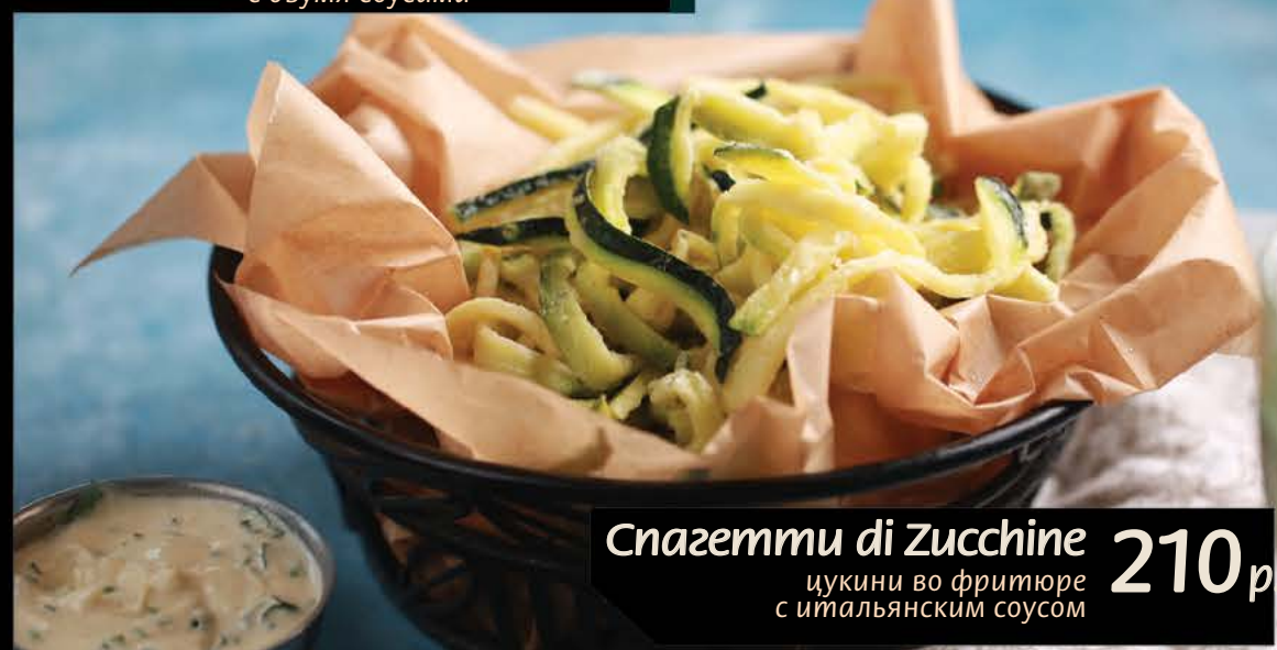
Spaggetti di Zucchine 210 р. цуккини во фритюре с итальянским соусом