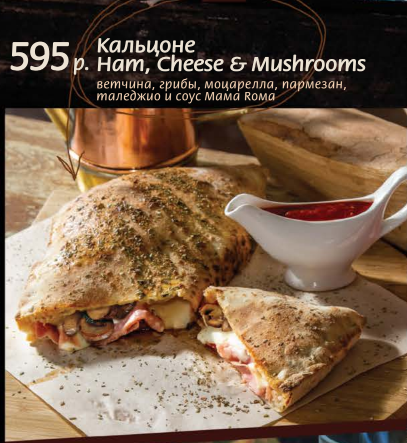
595 р. Кальцоне Ham, Cheese & Mushrooms ветчина, грибы, моцарелла, пармезан, таледжио и соус Мама Рома