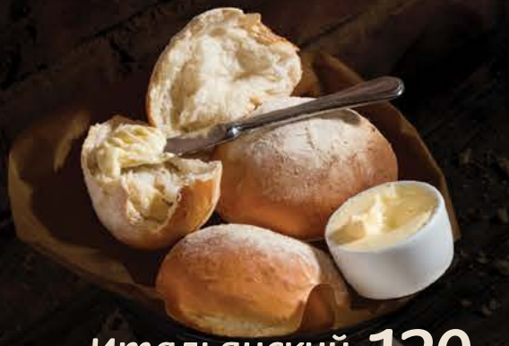
120 р. Итальянский хлеб со сливочным маслом