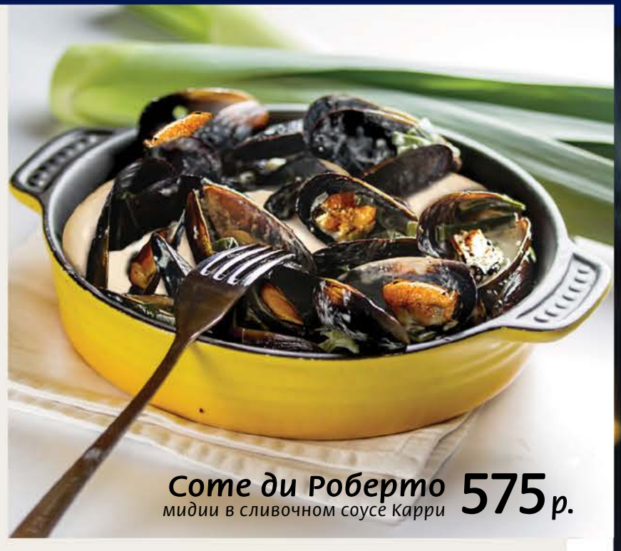
Соме ди Роберто 575 р. мидии в сливочном соусе Карри