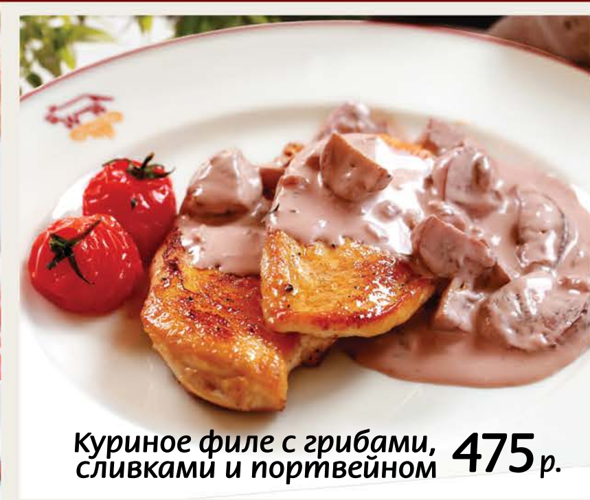
Куриное филе с грибами, сливками и портвейном 475 р.