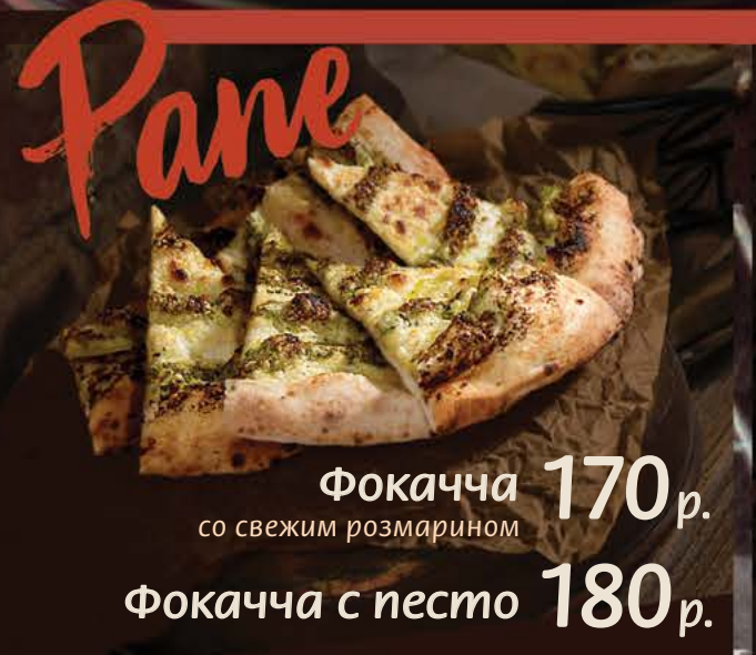
170 р. Фокачча со свежим розмарином 180 р. Фокачча с песто