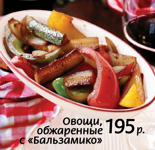
Овощи, обжаренные с «Бальзамико» 195 р.