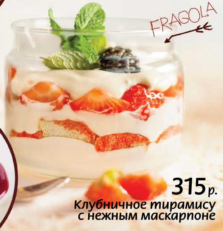
315 р. Клубничное тирамису с нежным маскарпоне