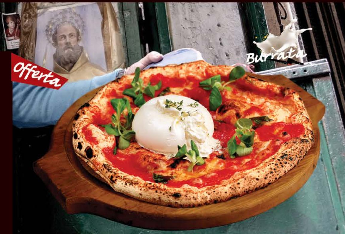
фокачча с нежной бурратой и соусом Наполи 680 р.