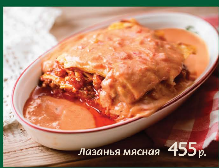
Лазанья мясная 455 р.