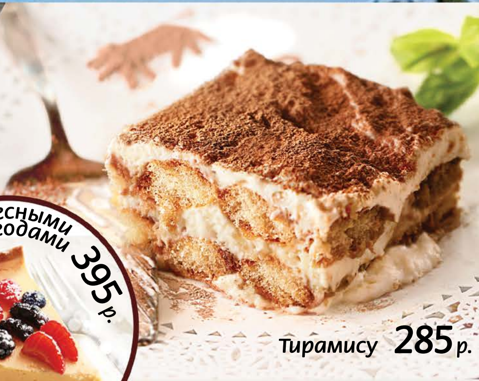
Тирамису 285 р.