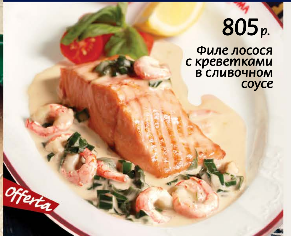
805 р. Филе лосося с креветками в сливочном соусе