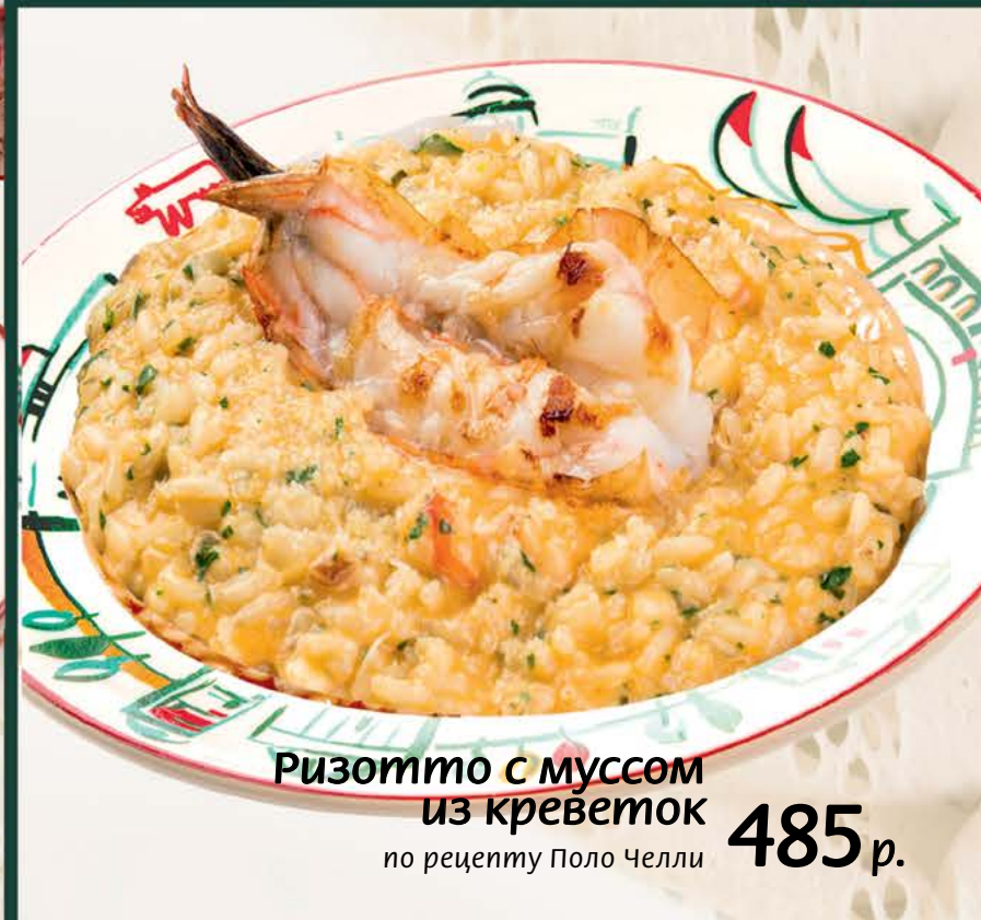
Ризотто с муссом из креветок 485 р. по рецепту Поло Челли