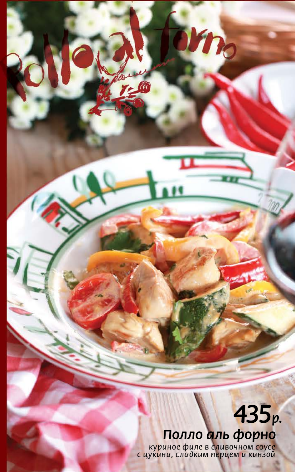
435 р. Полло аль форно куриное филе в сливочном соусе с цукини, сладким перцем и кинзой