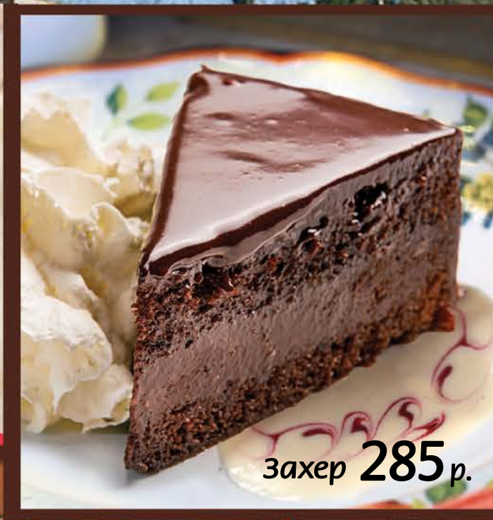
Захер 285 р.