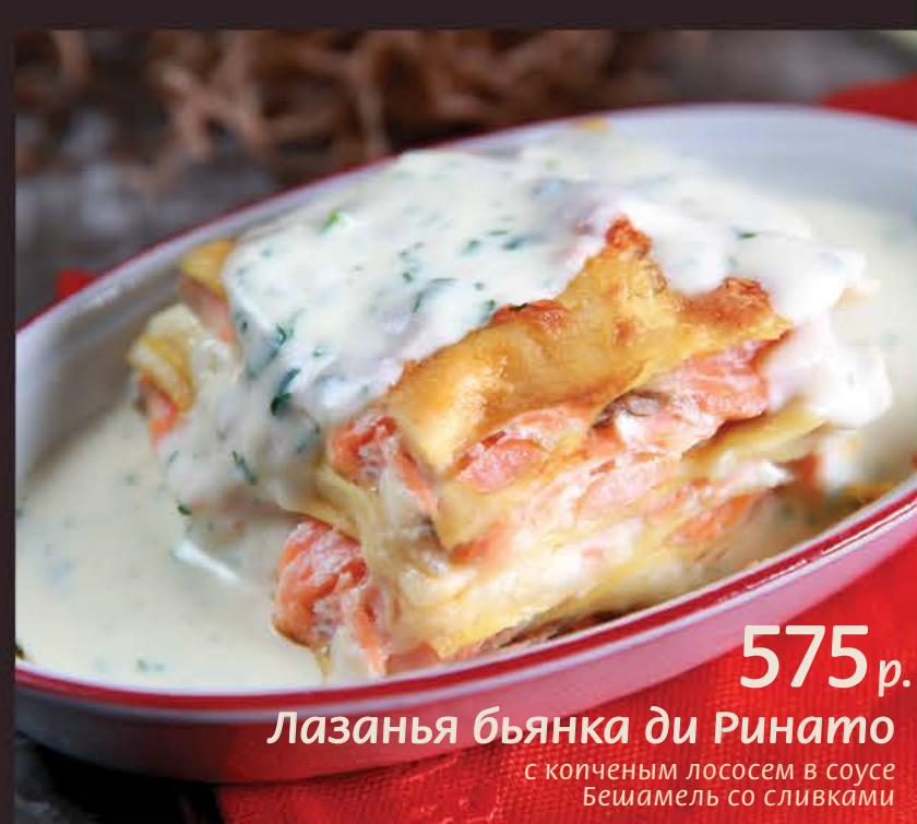
Лазанья бьянка ди Ринато 575 р. с копченым лососем в соусе Бешамель со сливками