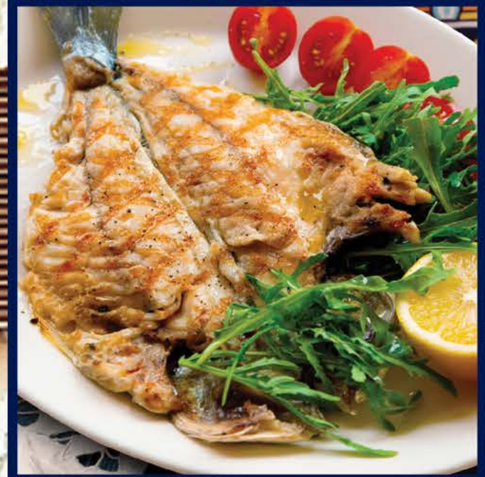
750 р. Ората на гриле с рукколой