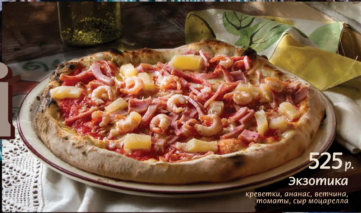
525 р. Экзотика креветки, ананас, ветчина, томаты, сыр моцарелла