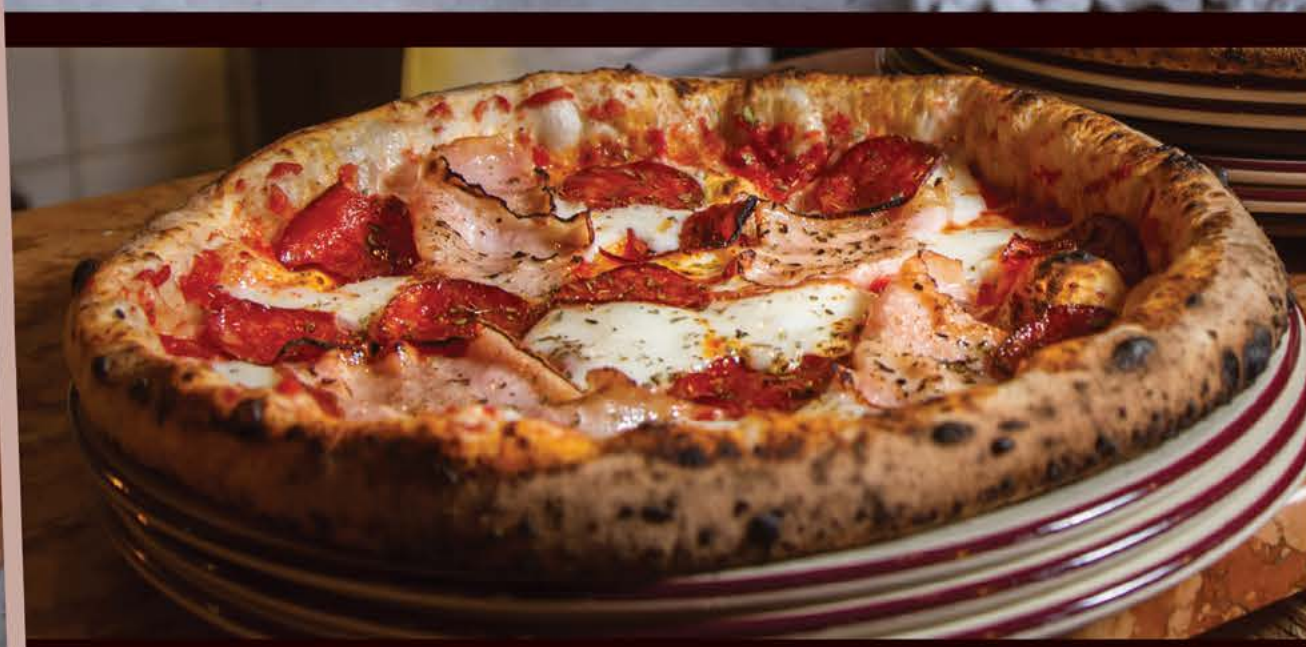
Пульчинелла 465 р. домашний бекон, салями, моцарелла